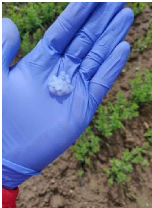
Slika 7. Oblik mikrokapsula prije stavljanja u tlo