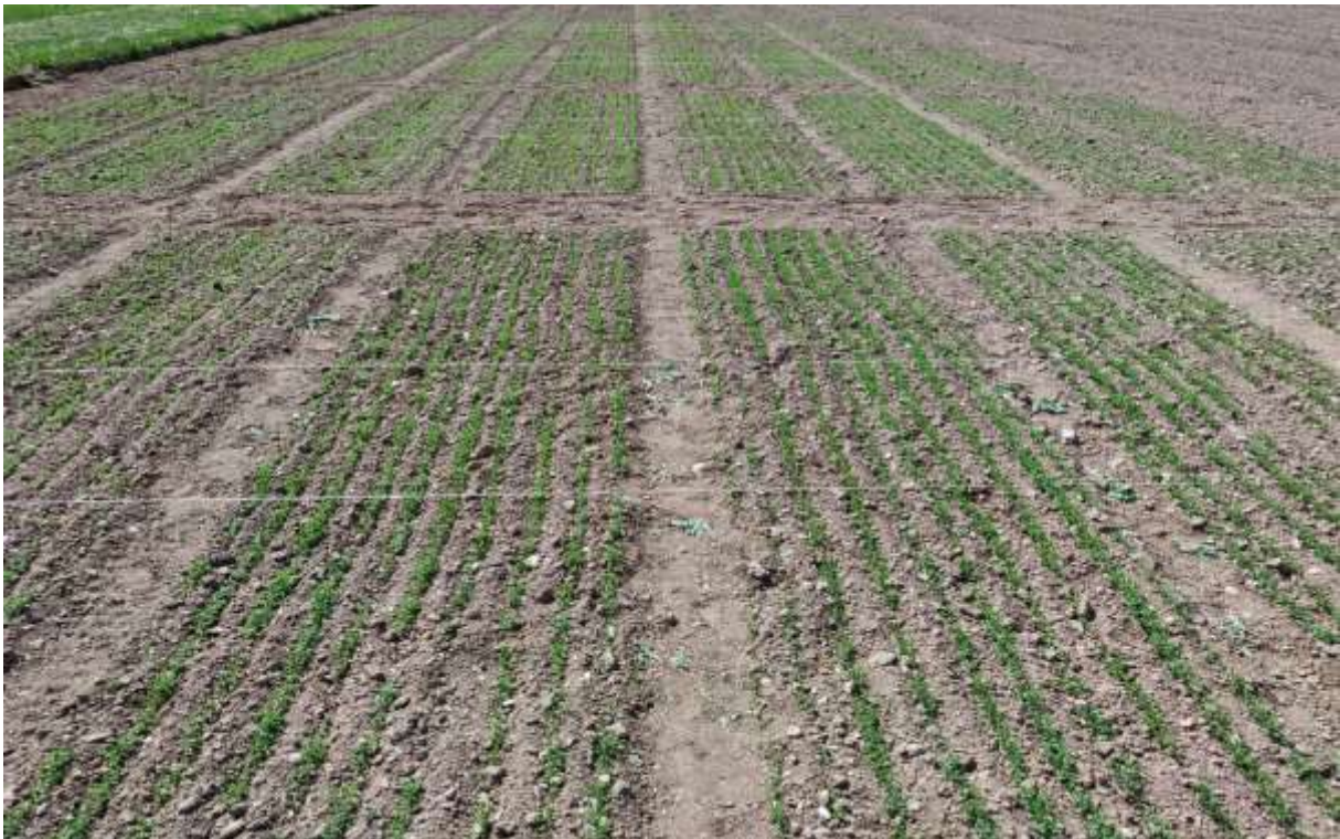
Slika 2. Lan nakon nicanja

Dobiveni podaci obradit će se analizom varijance, a razlike između srednjih vrijednosti testirane su LSD testom na nivou od 5%.