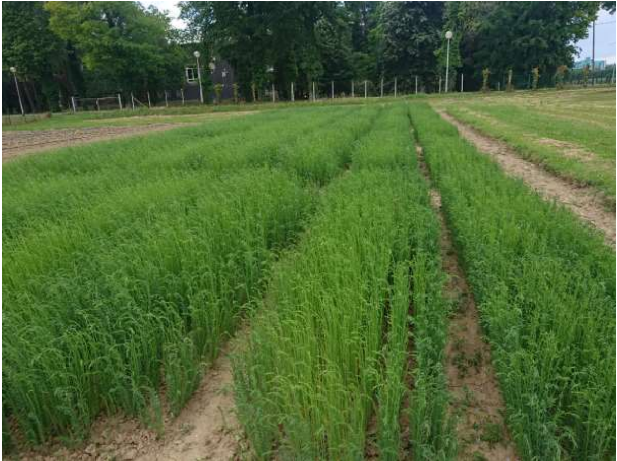
Slika 3. Intenzivni porast lana