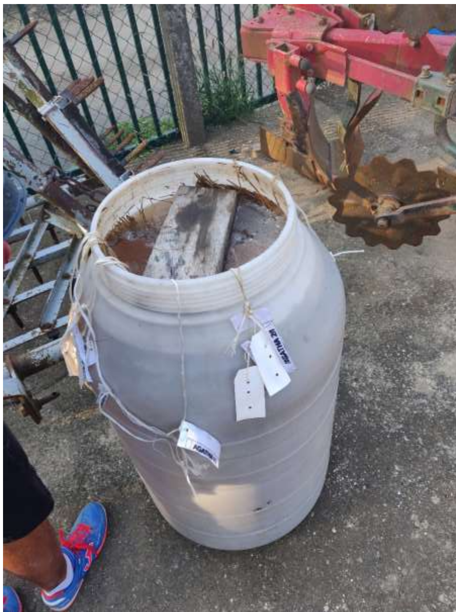
Slika 4. Biološka metoda meceracije lana