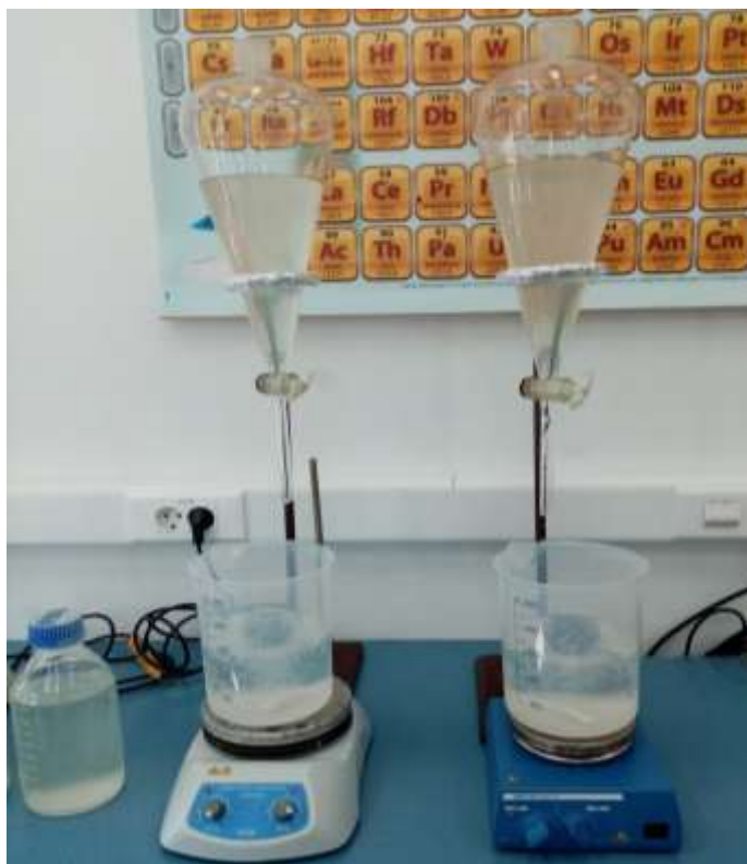
Slika 5. Priprava mikrokapsula pomoću lijevka za odjeljivanje

Na slici 7. prikazan je oblik mikrokapsula neposredno prije stavljanja u tlo.