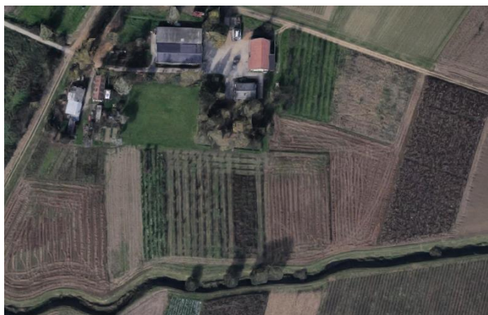
Slika 12: Pokušalište Šašinovec

Pokusno polje nalazi se na površini Pokušališta Šašinovec (slika 12.) Agronomskog fakulteta u istočnom dijelu grada Zagreba.