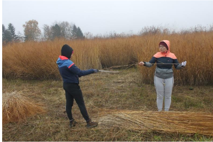
Slika 24: Mjerenje visine biljke