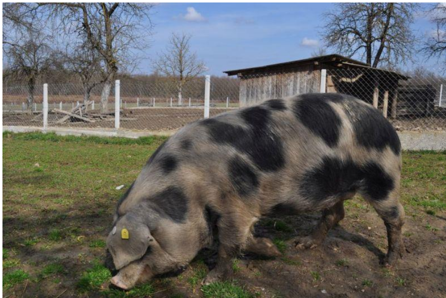
Slika 2.1. Banijska šara svinja

uzgaja na području Sisačko-moslavačke, Bjelovarsko-bilogorske, Zagrebačke, Zadarske, Požeško-slavonske i Vukovarsko-srijemske županije (HAPIH 2022.).