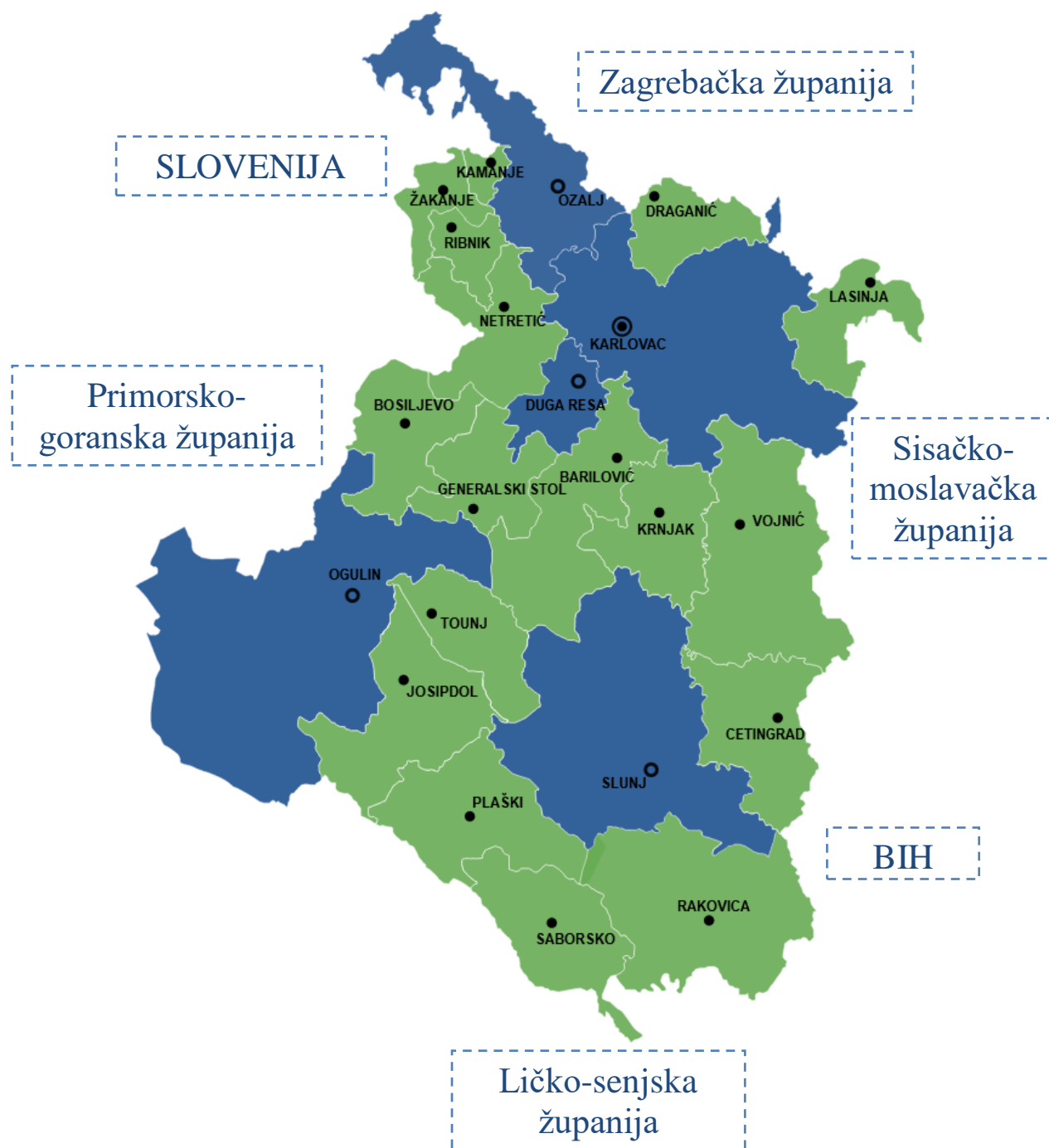
Slika 1. Karta Karlovačke županije