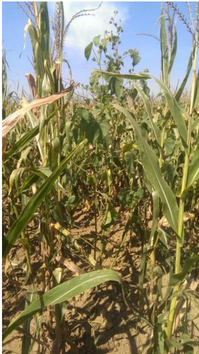
Slika 4. Razgranata stabljika mračnjaka u usjevu kukuruza.

Stabljika je snažna, ravna i okrugla, promjera do 5 cm i visine 40 – 350 (400) cm, pokrivena mekanim bjelkastim dlačicama. U rijetkom sklopu se grana (slika 4.), a u gustom sklopu je stabljika tanja i sasvim bez grana (Flegar i Novak, 2005).