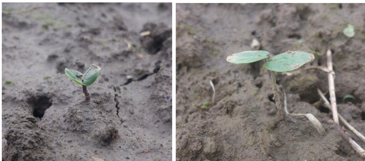
Slike 1., 2. Kotiledoni europskog mračnjaka

Opisujući ovu vrstu Kojić i Šinžar (1985) navode da sadrži specifičan miris koji se osjeti u slučaju loma ili gnječenja stabljike ili listova. Kotiledoni su okrugli, malo jajasti, oko 10 mm u promjeru, pri osnovi donekle srcoliki. Obrasli su sitnim, jednostavnim i žljezdastim dlačicama. Stabljike kotiledona su duge 8-10 mm i također gusto dlakave (Kojić i Šinžar, 1985). Mlade biljčice mračnjaka podsjećaju na biljčice pamuka.