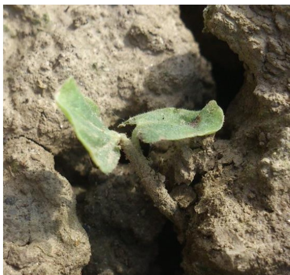
Slika 10. Potpuno otvoreni kotiledon mračnjaka.

Utvrđivanje broja izniklih klijanaca je obavljeno dva puta tjedno u fazi razdvojenih kotiledona (slika 10). Nakon svakog utvrđivanja broja, ponikle jedinice su uklonjene.