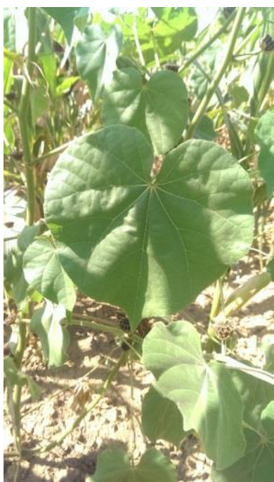
Slika 5. Razvijeni list mračnjaka.

Cvjetovi su smješteni pojedinačno u pazušcu listova ili su skupljeni u mali štitasti cvat na vrhu stabljike. Čaška cvijeta je građena od 5 latica svijetlo žute, žute do žutonarančaste boje (Flegar i Novak, 2005). Plod je tobolac. Zbirni tobolci su dužine 1,3-2,5 cm i promjera 2,5 cm, obrasli dlačicama, u trenutku dozrijevanja su tamnosive do crne boje (Flegar i Novak, 2005).