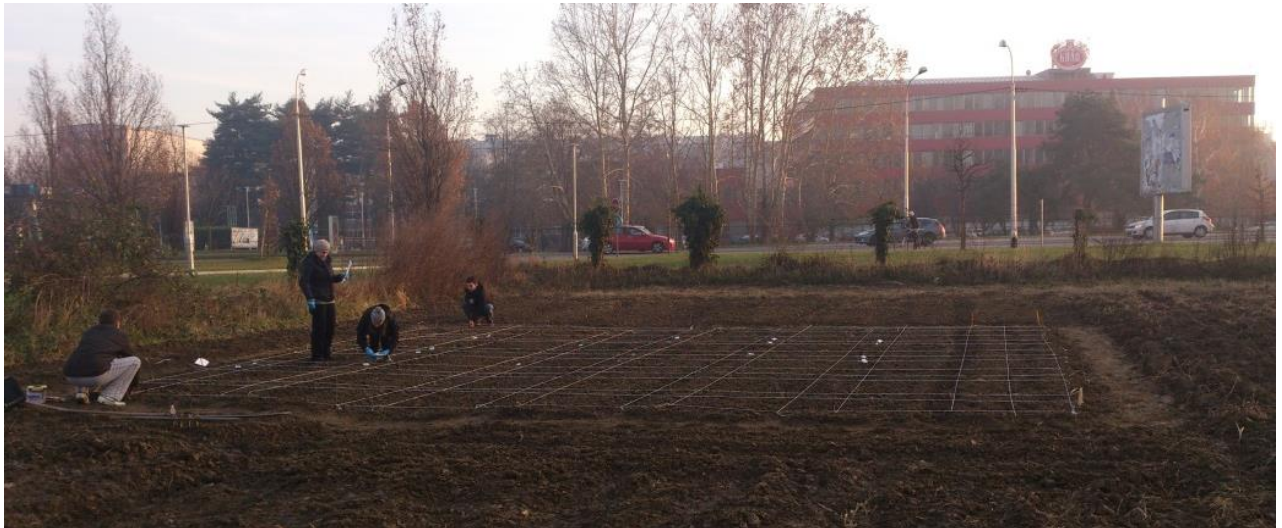
Slika 9. Postavljanje pokusa (Snimio: Kovačić, I.).

posijano po 50 sjemenki (5 redova međurednog razmaka 10 cm s razmakom unutar reda od 1 cm). Sjetva je obavljena ručno na 2 cm dubine, što se smatra optimalnom dubinom za nicanje ove korovne vrste (Loddo i sur., 2013).