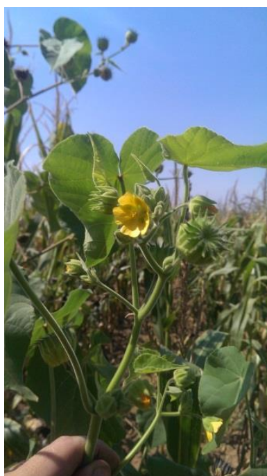
Slika 6. Žuti cvijet i nedozrijeli zeleni tobolac mračnjaka, (Snimio: Kovačić, I.). Slika 7. (desno) Zreli tobolac mračnjaka (Snimio: Kovačić, I.).