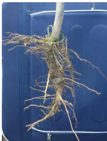
Slika 3. Korijen europskog mračnjaka

Korijen je vretenast jak i svijetle boje (Slika 3.). Glavni korijen prodire do dubine jednog metra u tlima s niskom razinom podzemne vode. Ako je podzemna voda visoko, glavni korijen ne ide duboko već jače razvija postrano korijenje. Korijen ima veliku moć apsorpcije vode pa je biljka otporna na sušu (Kojić i Šinžar, 1985).