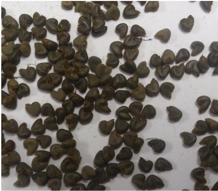
Slika 8. Sjemenke europskog mračnjaka

Flegar i Novak (2005) ističu da sjemenka može u tlu sačuvati klijavost do 50 godina. Sposobnost dugačkog zadržavanja klijavosti (i nakon 40 godina) Hulina (1998) ističe i kod drugih autora (Crocker, 1950; Harrington, 1970. i Americanos 1994.).