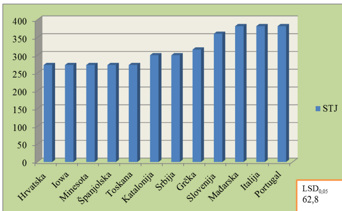
Grafikon 1. STJ zraka potrebna za početak nicanja mračnjaka.

Rezultati rada prikazani su za sve istraživane populacije kroz sumu toplinskih jedinica zraka i tla potrebnu za nicanje. Na temelju prikupljenih meteoroloških podataka (temperatura), biološkog minimuma za mračnjak, datuma početka nicanja te datuma završnog nicanja 50% posijanih sjemenki, za svaku populaciju je izračunata potrebna suma toplinskih jedinica (STJ) zraka za početak nicanja te STJ zraka i tla za 50% nicanje svih istraživanih populacija (grafikoni 1,2 i 3).