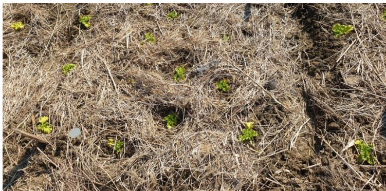
Slika 11. Malčirane presadnice

Prosjeck vegetacije, od sadnje presadnica do berbe, ove sorte je 40-50 dana i svojstvo sorte je iznimno dugo razdoblje do izduljivanja i prelaska u generativnu fazu (cvatnje i stvaranje sjemena) (Sakata 2021). To svojstvo je dopustilo produženi boravak salata na polju kako bi se postigli komercijalni prinosi, no nakon 60 dana primijećeno je izduživanje te se nije uspjela postići veličina rozete kakva je svojstvena za ovu sortu. Berba je provedena 63 dana nakon sadnje, odnosno, 1.6.2021. godine (Slika 12.). Berba se obavila ručno. Zbog uvijeta tokom trajanja pokusa pojedini tretmani su pretrpjeli gubitke i minimalni broj je bio 12 jedinki salate unutar tretmana.