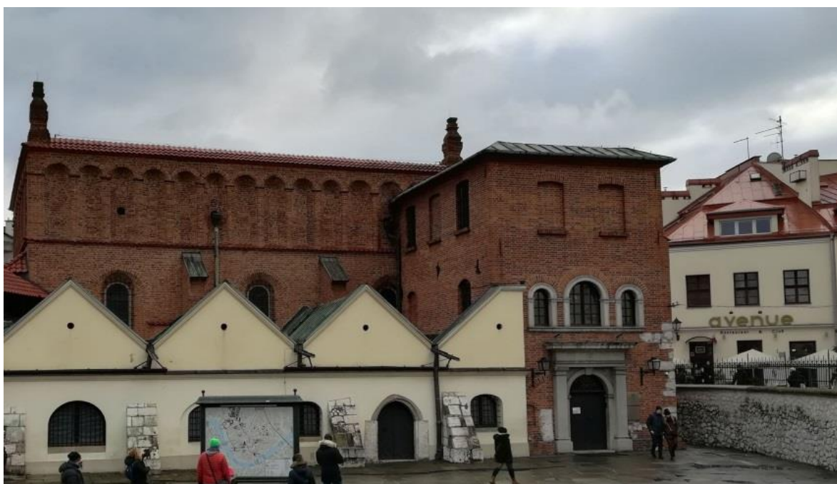
Slika 5. Kazimierz, pogled na Staru Sinagogu, a u pozadini na trendy restoran i klub Avenue (prosinac 2018.)