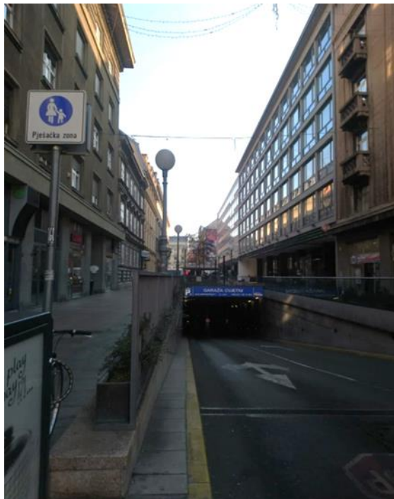
Slika 2. Garaža u Varšavskoj ulici u Zagrebu (siječanj 2020., autorski rad)