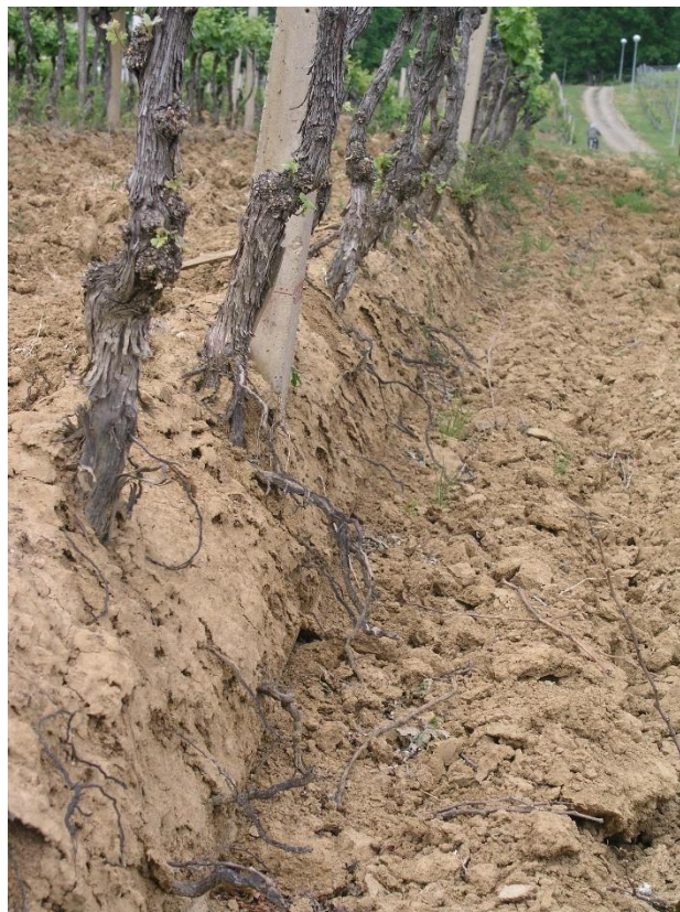
Slika 2. Učinak erozije kod obrade tla

U preglednom radu o mogućnostima suzbijanja korova u vinogradu autori posvećuju posebno poglavlje zatravljivanju vinograda kao načinu održavanja tla u vinogradima. Ističu nedostatke obrade tla što ima za posljedicu eroziju i ogoljavanje korijena (slika 2). Rad navodi prednosti zatravljivanja i daje detaljne upute o provođenju zatravljivanja.