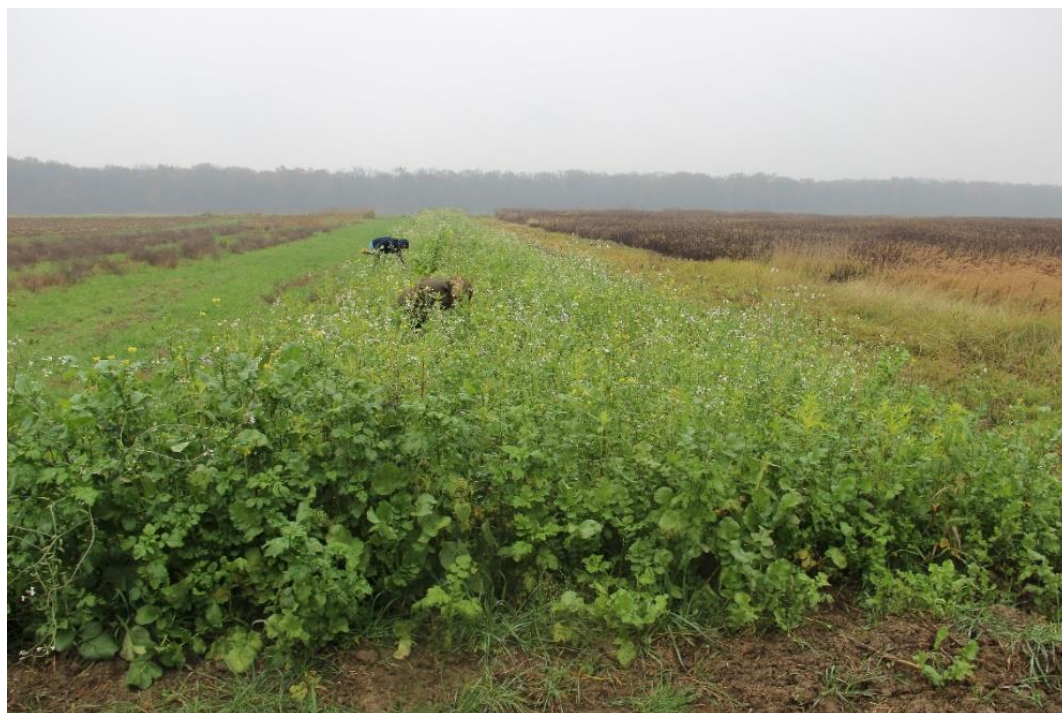
Slika1. Nadzemna masa smjese pokrovne kulture

Kako je u Uvodu navedeno, pokrovne kulture imaju višestruke mogućnosti u cilju postizanja održive poljoprivrede. Iako se po definiciji pokrovnim kulturama smatra uzgoj kultura ili smjese različitih kultura koje se ne žanju, odnosno ostaju na polju, s gledišta potiskivanja i suzbijanja korova pokrovnim kulturama se mogu smatrati svi usjevi (postrni usjevi, međuusjevi, zelena gnojidba, zatravljivanje trajnih nasada, podusjevi, nadusjevi i sl.) koji svojim sklopom i nadzemnom biomasom priječe razvoj i potiskuju korove. Multifunkcionalnost pokrovnih usjeva ističu i brojni autori osim u Uvodu navedenih prednosti, iz pregledanih radova može se vidjeti da se mogu dodati i mogućnosti korištenja kao medonosnih kultura te kao vrste za uređenje krajobraza, odnosno ukrasnih površina. Ovisno o cilju (funkciji) ili što je češće, kombinaciji više ciljeva važan je odabir vrsta za pokrovni usjev. Tako npr. za zelenu gnojidbu važno je odabrati vrste brzog i bujnog rasta koje osim što stvaraju znatnu nadzemnu biomasu istovremeno potiskuju korove (Slika 1.).