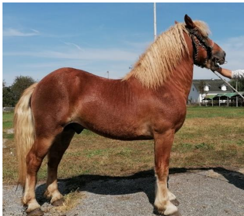
Slika 2.2. Hrvatski posavac

prirode Lonjsko polje i na području Slovenije (u području sliva rijeke Save). Danas je veći dio uzgoja namijenjen proizvodnji mlade ždrijebadi za tržište Italije. Prema zadnjim podacima Hrvatske agencije za poljoprivredu i hranu (2020.) u Hrvatskoj je evidentirano 5.856 grla pasmine hrvatski posavac.