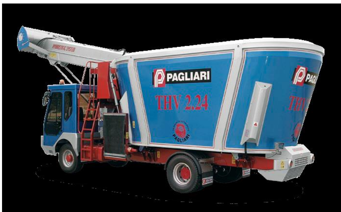
Slika 4.18. Samokretni stroj Pagliari THV 2.24