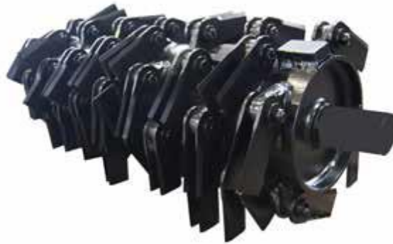
Slika 4.15. Prikaz noževa na glodalici samokretnog stroja proizvođača Faresin

Miješanje u spremniku se postiže s dvije okomite pužnice na kojima su postavljeni noževi za usitnjavanje hrane. Samokretni strojevi LEADER ECOMODE su u mogućnosti prilagoditi brzinu u različitim fazama utovara u odnosu na fazu miješanja, tako da je na kraju punjenja gotovi obrok spreman za distribuciju.