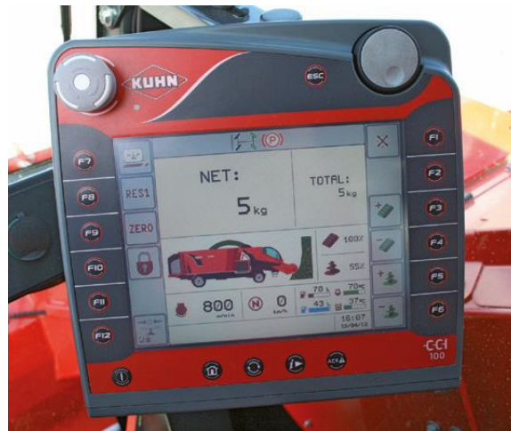
Slika 4.8. Zaslون samokretnog stroja za izuzimanje, miješanje i raspodjelu silaže Kuhn

Nizozemska tvrtka Trioliet ima u ponudi nudi već duže vrijeme samokretne strojeve za izuzimanje, miješanje i raspodjelu silaže. Novi model ovog proizvođača “Triotrac” dolazi u izradi s teleskopskom glodalicom koja omogućava izuzimanje silaže do 6 metara visine, a zahvat glodalice iznosi 1,85 metara. Zbog teleskopske glodalice i bolje preglednosti vozača, kabina je podesiva po visini, za razliku od drugih proizvođača kod kojih je fiksna. Unutar kabine ima prikaz kamere za vožnju unatrag. Triotrac-ov sustav za izuzimanje može se koristiti za izuzimanje skladištene silaže kao i za valjkaste ili četvrtaste bale. Spremnik za miješanje ovog proizvođača je zapremine 10 m 3 do 24 m 3 te se u njemu nalaze dvije vertikalne pužnice pogonjene hidrauličim motorom i promjenjive brzine. Pražnjenje je moguće obaviti na prednjem ili stražnjem dijelu spremnika na bočnoj strani.