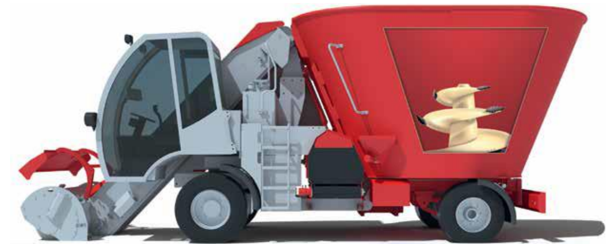
Slika 4.2. Samokretni stroj za izuzimanje, miješanje i raspodjelu silaže BVL V-mix Drive

Slika 4.2. prikazuje samokretni stroj njemačkog proizvođača BVL, model VMix-Drive. Profilirana glodalica s jakim zubima služi za utovar silaže, a može izuzimati i valjkaste i četvrtaste bale kao i ostale vrste silaže. U spremniku se nalazi pužnica za miješanje opremljena s noževima za rezanje silaže. Veličina pužnice treba biti u skladu s veličinom zapremine spremnika. Noževi na pužnici su lako premjestivi te se mogu prilagođavati ovisno o vrsti hrane koja se miješa. Kako bi se hranjenje moglo nadgledati, unutar kabine operater ima cjelokupni prikaz stroja u radu čime se isključuje mogućnost pogrešnog rada pri uporabi stroja. Troškovi hranjenja iznose više od polovice direktnog troška poljoprivrednog poslovanja, te se stoga preporučuje korištenje ovakvih strojeva na poljoprivrednim gospodarstvima.