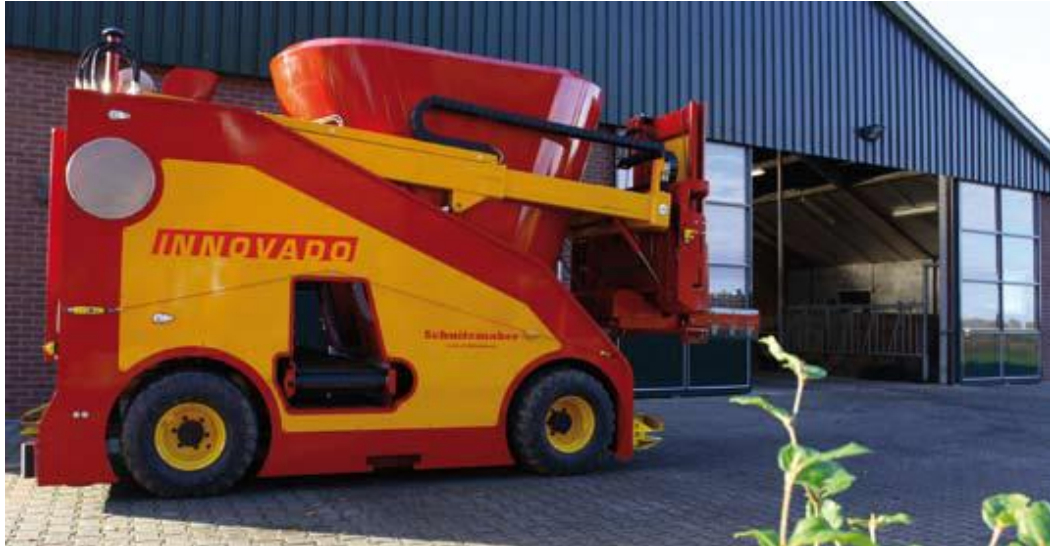
Slika 4.21. Robotizirani stroj Schuitmaker Innovado

Komunikacija sa strojem se može ostvarivati i bežično. Prilagođavanja obroka te vaganje silaže odvija se preko računala. Prilikom kretanja stroja kroz staju laseri prepoznaju prepreke ako se nalaze na putu njegovog kretanja. Ako se ljudi ili životinje približe stroju, on se automatski zaustavlja. Laser nakon nekoliko sekundi provjerava okruženje te ako je i dalje ometano, odmah šalje signal poljoprivredniku kako bi se prepreka otklonila. Osim lasera stroj je opremljen i gumbom za potpuno zaustavljanje koje se može upotrijebiti u bilo kojem trenutku.