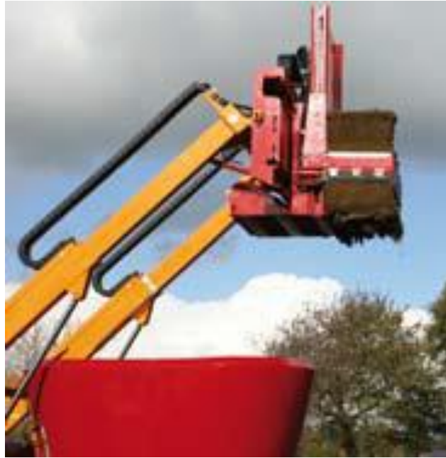
Slika 4.22. Rezač stroja Schuitmaker Innovado

U inovaciji strojeva za izuzimanje, miješanje i raspodjelu silaže talijanski proizvođač „Supertino“ je dao u ponudu električni model „Electra“. Ovaj stroj se bazira na potpunoj elektronici s ciljem dobivanja niza prednosti u odnosu na strojeve pogonjene dizelskim motorima. Prema navodima proizvođača izbor ovog stroja donosi do 50% uštede za poljoprivrednike. Stroj dolazi u izvedbi zapremine spremnika od 12 m 3 do 30 m 3 . Glavne prednosti ovog stroja su: