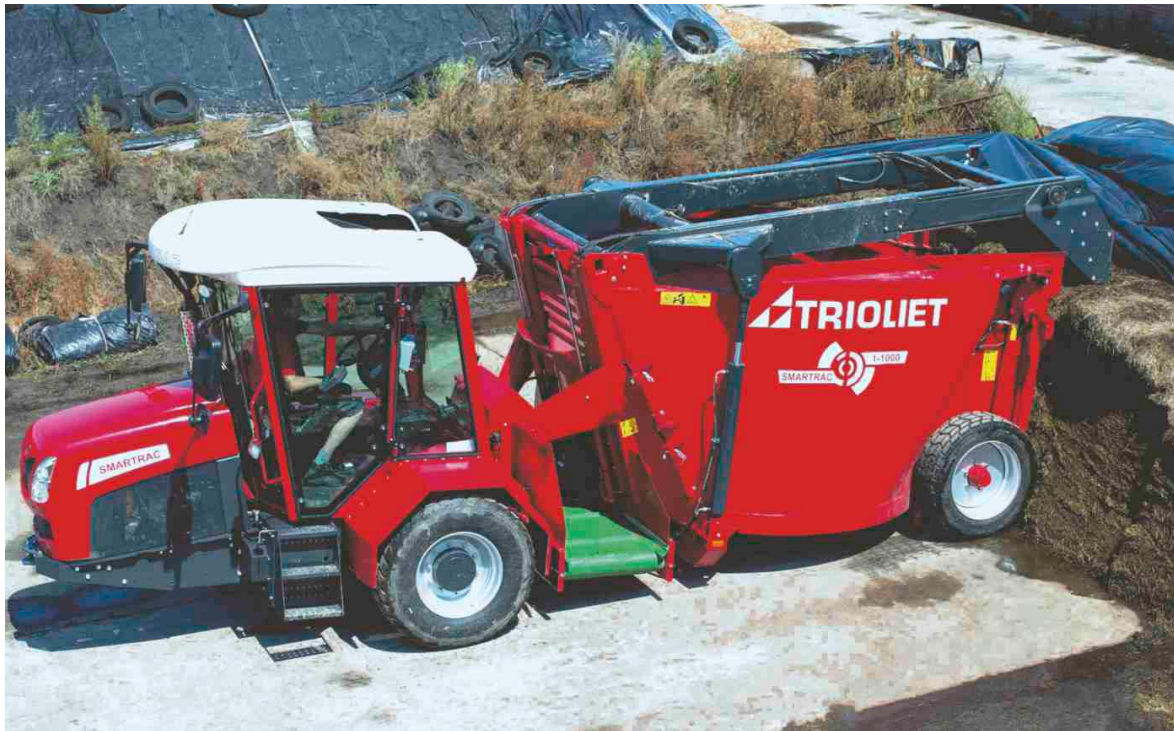
Slika 4.10. Trioliet Smartrac prilikom izuzimanja silaže i punjenja spremnika

Talijanski proizvođač Sgariboldi je plasirao na tržište samokretni stroj za izuzimanje, miješanje i raspodjelu silaže Grizzly, model 6100. Samokretni strojevi ovog modela su dostupni s kapacitetom spremnika od 10 m 3 do 18 m 3 , a postoje opcije s jednom ili dvije pužnice za miješanje. Stroj pokreće 4-cilindrični motor postavljen u središnjem položaju radi vidljivosti, snage 129 kW. Ovakav tip stroja je pogodan za mala i srednja gospodarstva te idealne dimenzije dopuštaju lagodnu upravljivost i u uskim područjima. Opremljeni su najsuvremenijom tehnologijom koja je smještena u kabini radi dostupnosti rukovatelju stroja.