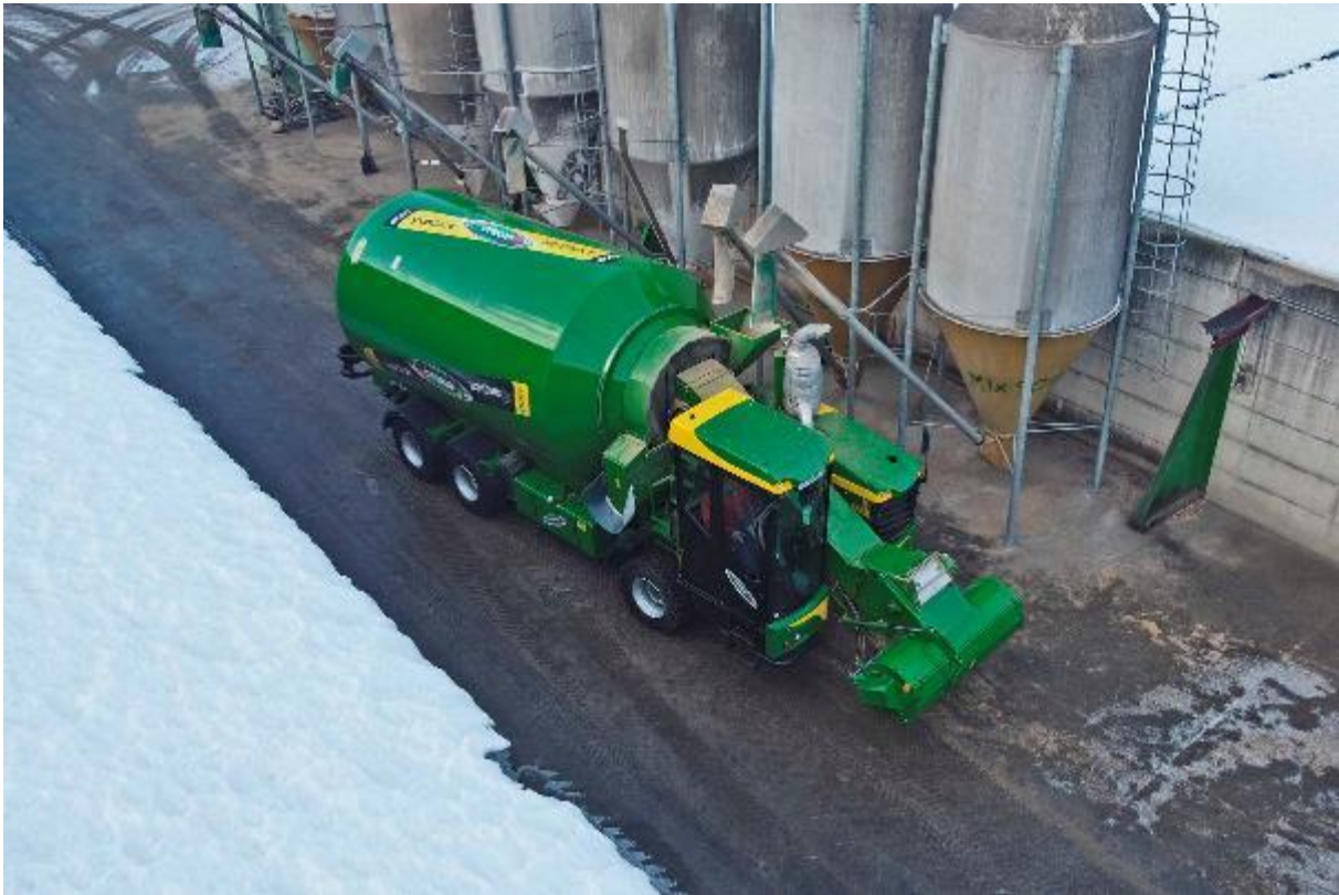
Slika 4.19. Samokretni stroj Bravo Rotomix RTX 7.500

tržištu najveći samokretni stroj zapremine spremnika 40 m 3 koji se preporuča za velike proizvođače mlijeka te zahtijeva veći prostor zbog manevriranja strojem.