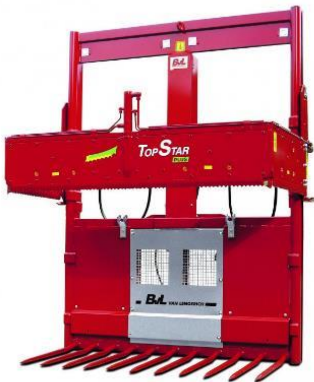
Slika 3.1. Traktorski priključni stroj za izuzimanje silaže

Postoje različite vrste strojeva za izuzimanje silaže iz silosa, neki od njih su priključni uređaji pogonjeni pomoću traktora ili samokretni strojevi poput različitih vrsta utovarivača. U početku su se najčešće koristili priključci za trozglobnu poteznicu traktora te se s njima vršilo izuzimanje i prijenos silaže. Na slici broj 3.1. je prikazan izuzimač silaže koji se može koristiti na prednjoj ili stražnjoj trozglobnoj poteznici. Dubine izuzimanja silaže ovise o vrsti i veličini izuzimača, a najčešće su od 70-90 cm.