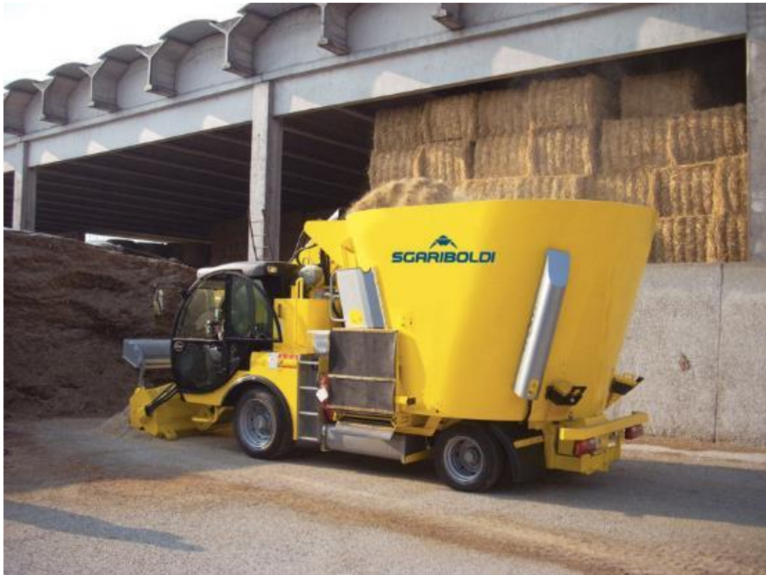
Slika 4.11. Samokretni stroj za izuzimanje, miješanje i raspodjelu silaže Sgariboldi Grizzly za vrijeme izuzimanja hrane

Jedan od najvećih svjetskih proizvođača samokretnih strojeva za izuzimanje, miješanje i raspodjelu silaže je tvrtka Siloking koja potječe iz Njemačke sa sjedištem u Bavarskoj pokrajini. Navedena tvrtka u ponudi ima jedan od najvećih takvih strojeva zapremine spremnika 32 m 3 . Oslonjen je na tri osovine od kojih su prednja i stražnja aktivne. Stroj je većih dimenzija od ostalih konkurenata te je namjenjen za veća gospodarstva i velike farme, odnosno za hranidbu 1000 i više mliječnih krava. Izuzimanje se vrši pomoću glodalice visokih performansi na maksimalnoj visini od 5,5 metara. Široki transportni kanal osigurava transport hrane izravno u spremnik za miješanje. Miješanje se provodi s 3 pužnice koje su postavljene okomito. Pražnjenje se može vršiti s obje bočne strane te s prednje ili stražnje strane spremnika. Učinkovita tehnologija pražnjenja nudi ispuštanje hrane u staju u roku od 90 sekundi čime se štedi vrijeme. Maksimalna transportna brzina ovog stroja iznosi 40 km/h. Pogonjen je 6-cilindričnim Volvo motorom snage 210 kW. Izbor ovog stroja nudi veliku uštedu na vremenu radi svojih performansi rada, ali i smanjenje troškova održavanja stroja jer je proizvođač povećao standardni interval održavanja s 500 radnih sati na 1000.