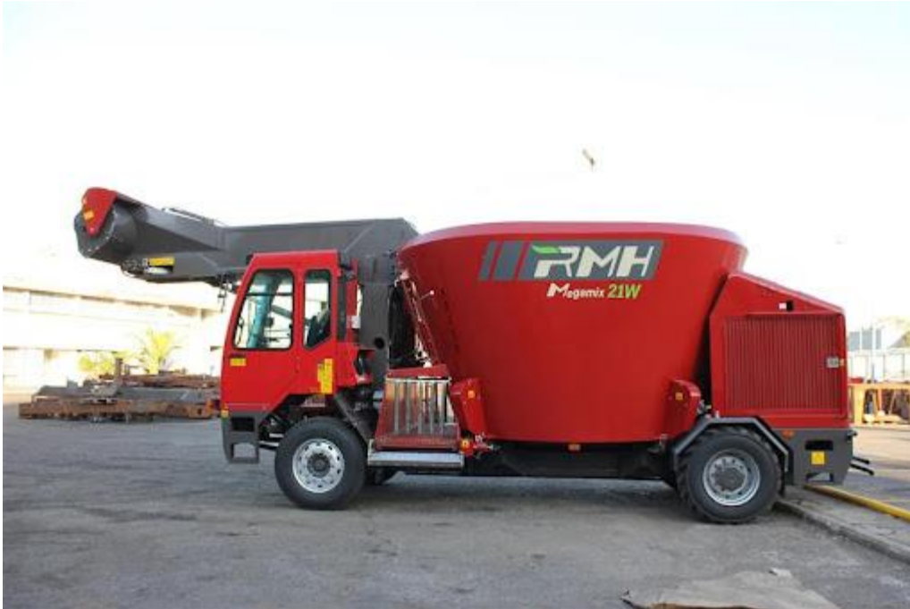
Slika 4.16. Samokretni stroj RMH Megamix 21 W

Glavna upravljačka palica, smještena s desne strane sjedala, namijenjena je radu glodalice, ali postoji i veliki zaslon za prikaz masa pojedinih komponenti obroka, plus zaslon spojen na stražnju kameru. Kako je motor postavljen straga, razina buke u kabini je niska. Opremljen je motorom njemačkog proizvođača Deutz snage 153 kW, a zapremina spremnika ovog modela iznosi 21 m 3 .