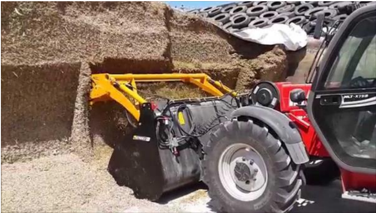
Slika 3.4. Teleskopski utovarivač s priključkom za izuzimanje silaže

Najveću efikasnost u izuzimanju silaže od klasičnih strojeva imaju samokretni utovarivači, teleskopski ili zglobni. Pogonjeni su vlastitim motorom te su jako brzi u radu. Zglobni utovarivači imaju prednost radi manevarskog prostora te mogu prolaziti kroz manje objekte i raznositi silažu. Ovakvi strojevi imaju hidrauličnu ruku na kojoj su prikopčana kliješta za izuzimanje silaže dok su teleskopski utovarivači većinom namjenjeni za veće objekte. Imaju pogon na sva četiri kotača te su primjenjivi na različitim terenima i uvjetima za rad. Cjenovno su dosta skuplji od samih priključaka koji su navedeni u gornjem dijelu teksta, ali su na dugoročno vrijeme dosta isplativiji te efikasniji.