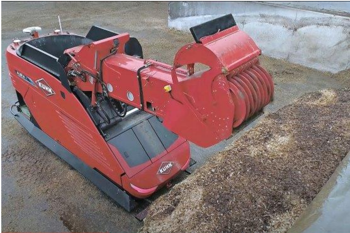
Slika 4.26. Robot za izuzimanje, miješanje i raspodjelu silaže Kuhn Aura

Nakon mnogo godina istraživanja, francuska tvrtka Kuhn je ponudila uvid u projekt svog robota za hranjenje pod nazivom Aura. Aura je autonomni robot koji ima spremnik za miješanje zapremine 3 m 3 s dvije okomite pužnice. Automatski se puni prednjom rukom na kojoj se nalazi glodalica za izuzimanje silaže. Glodalica se može pomicati s lijeva na desno te tako omogućava veću količinu izuzimanja iz stacioniranog položaja. Prema navodu iz tvrtke Kuhn robot može raditi posao 24 sata dnevno te tako može nahraniti 300 krava. Dizelski motor snage 57 KS omogućuje kretanje stroja na četiri rotirajuća kotača koji osiguravaju mali radijus okretanja te mogućnost vožnje naprijed-natrag i dijagonalno manevriranje na malim površinama. Ovaj robot je tek u probnoj fazi proizvodnje, a stvarno lansiranje na tržište se očekuje u 2023. godini ( www.dairyglobal.net ).