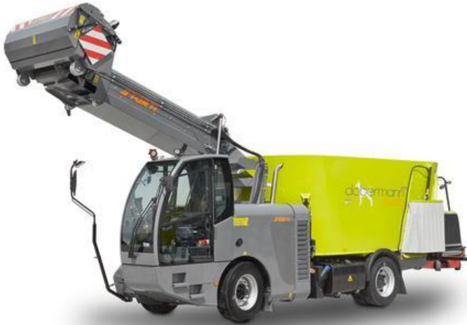
Slika 4.4. Samokretni stroj za izuzimanje, miješanje i raspodjelu silaže Storti Dobermann