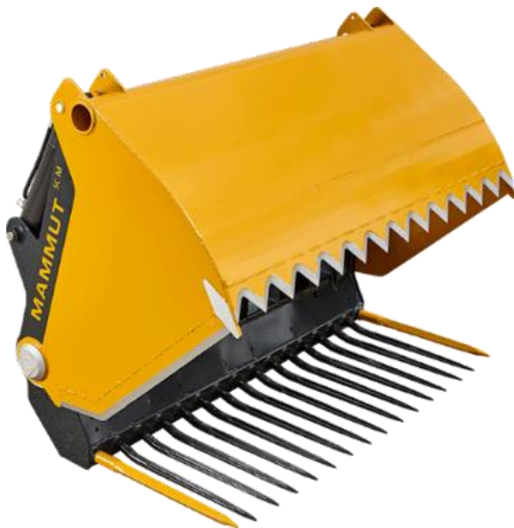
Slika 3.3. Klijesta za izuzimanje silaže

U novije vrijeme se dosta koriste klijesta za izuzimanje silaže na prednjem traktorskom utovarivaču. Izuzimanje je efikasnije i brže od priključka na trozglobnoj poteznici. Radni zahvat klijesta ovisi o jačini traktora, a mogu biti različitih izvedbi. Postoje klijesta s punom donjom stranicom ili s rešetkastim dnom te s mogućnošću izrade ravnog ili nazubljenog noža za odsijecanje silaže. Cijenovno su pristupačni i lako dostupni na tržištu.