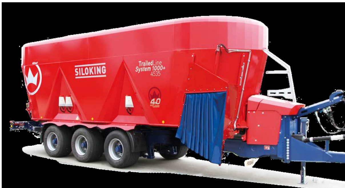
Slika 3.10. Troosovinska mikser prikolica Siloking TrailedLine System 1000+ 4535