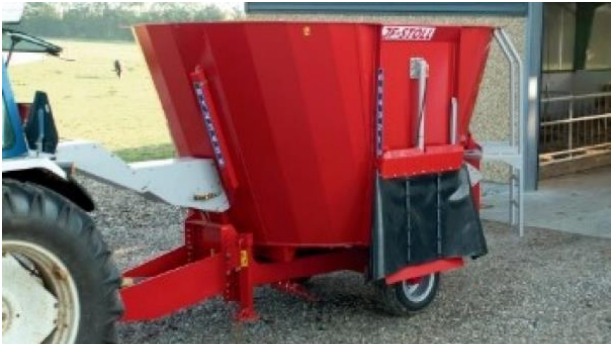
Slika 3.6. Mikser prikolica JF-STOLL VM10-1

Mikser prikolica JF-STOLL VM10-1 je izrađena po najnovijoj tehnologiji kako bi se prilagodila svim korisnicima. TMR tehnologija miješanja hrane osigurava dobivanje potpunog izmješanog obroka (idealna mješavina sjenaže, silaže i koncentrata) koji energetski zadovoljava sve preživače. Prikolica je zapremnine 10 m 3 s mogućnošću nadogradnje. Jedan obrok je dovoljan za ishranu 55-65 muznih krava. Mikser prikolica je opremljena digitalnom vagom s glavnim terminalom za praćenje utovara/istovara te bežičnom jedinicom za drugi stroj za praćenje unosa pojedinih komponenata obroka.