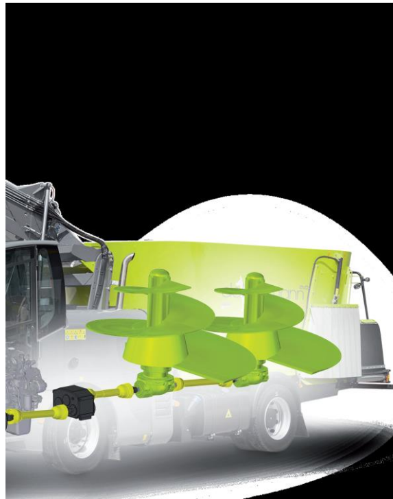
Slika 4.6. Shematski prikaz prijenosa Storti Dobermann

Storti Dobermann dolazi u izvedbi s jednom ili dvije pužnice, ovisno o kapacitetu spremnika koji može biti od 13 m 3 do 33 m 3 . Brzina kretanja ovih strojeva je lako prilagodljiva zbog opremljenosti sporim reduktorom, a maksimalna transportna brzina iznosi 40 km/h. Pražnjenje spremnika se odvija pomoću transporterera koji može vršiti pražnjenje s lijeve i desne strane, a smješten je na stražnjem dijelu stroja. Ovisno o veličini spremnika, tvrtka u ponudi ima modele s 4-cilindričnim i 6-cilindričnim motorom.