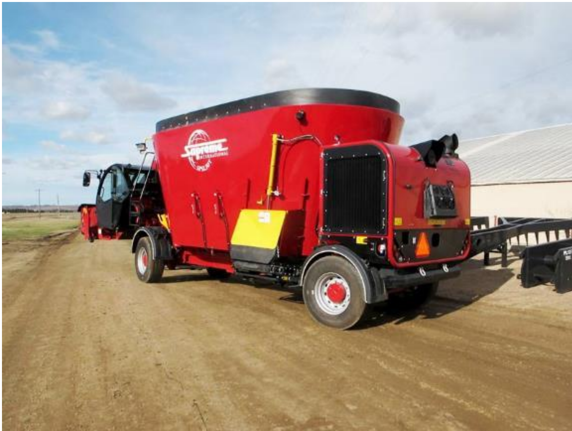
Slika 4.17. Samokretni stroj SPSL30T proizvođača Supreme

Talijanski proizvođač „Pagliari“ u ponudi ima samokretne strojeve s dvije i tri osovine, kapaciteta spremnika od 10 m 3 do 30 m 3 . Karakteristično za ovaj stroj je da ima u ponudi glodalicu zahvata 2,20 metara, što je u odnosu na ostale proizvođače najveći zahvat. Na strojevima manjih kapaciteta glodalica je zahvata 1,80 ili 2,00 metara. Spremnik za miješanje hrane je izgrađen od nehrđajućeg čelika, kao i glodalica, što omogućava duži vijek trajanja. Pogon na sve kotače i zračni ovjes podvozja omogućava pristup teže savladivim terenima u raznim vremenskim uvjetima. Miješanje se provodi s dvije okomite pužnice na kojima su postavljeni noževi koji su lako zamjenjivi. Pražnjenje se vrši s bočnih strana te je smješteno odmah iza kabine stroja. Kabina je klimatizirana te opremljena zračnim sjedalom.