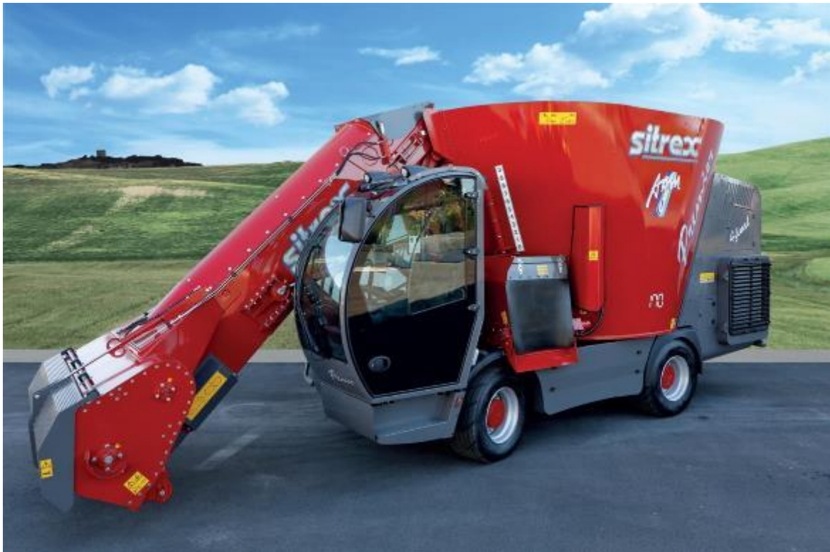
Slika 4.3. Samokretni stroj za izuzimanje, miješanje i raspodjelu silaže Sitrex Premium

Još jedna od talijanskih firmi, Storti, nakon dugog niza godina proučavanja je izbacila na tržište samokretni stroj za izuzimanje, miješanje i raspodjelu silaže modela Dobermann. Prema njihovim navodima ovaj model nudi najveću udobnost i jednostavnost korištenja stroja. Upravljačka palica s komandama je integrirana u naslon za ruku, a ostale komande su također lako dostupne, a kupac može odabrati sjedalo po želji.