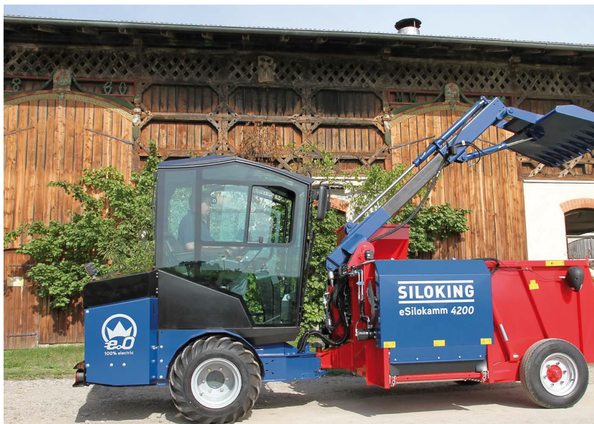
Slika 4.25. Električni samokretni stroj Siloking E-Silokamm 4200