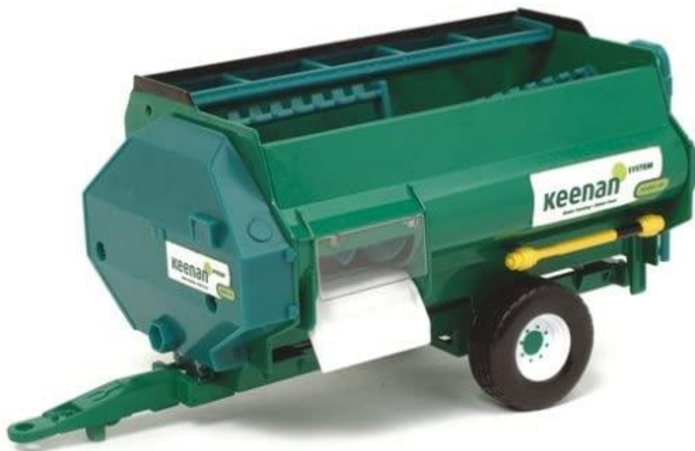
Slika 3.5. Mikser prikolica KEENAN

Današnje mikser prikolice su izrađene od visoko kvalitetnog nehrđajućeg čelika, te ovisno od opreme i zapremine imaju ugrađene bočne otvore s obadvije strane te bežičnu vagu za lakše rukovanje i raspodjelu hrane s digitalnim prikazom u kabini traktora. Otvori prikolice se otvaraju i zatvaraju hidrauličnim sistemom komandama iz kabine traktora. Unutar prikolice se nalazi jedna ili više pužnica za miješanje silaže.