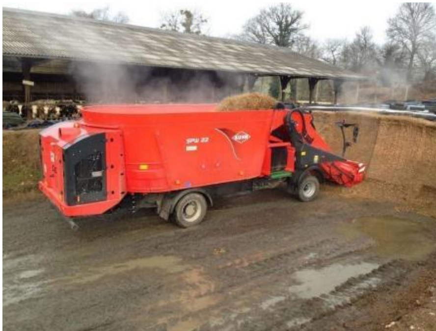
Slika 4.7. Samokretni stroj za izuzimanje, miješanje i raspodjelu silaže Kuhn SPW 22 pri izuzimanju silaže