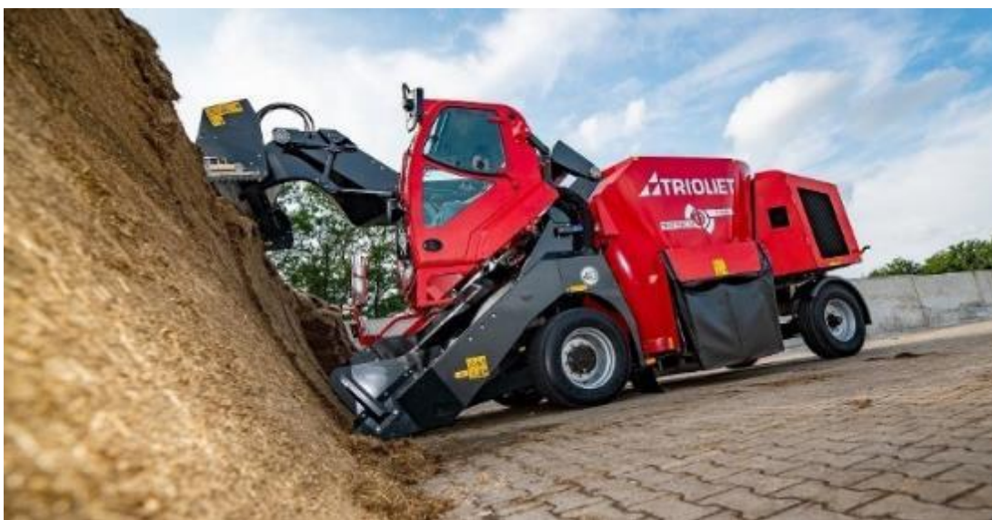
Slika 4.9. Samokretni stroj za izuzimanje, miješanje i raspodjelu silaže Trioliet Triotrac

Nizozemska tvrtka Trioliet ima u ponudi nudi već duže vrijeme samokretne strojeve za izuzimanje, miješanje i raspodjelu silaže. Novi model ovog proizvođača “Triotrac” dolazi u izradi s teleskopskom glodalicom koja omogućava izuzimanje silaže do 6 metara visine, a zahvat glodalice iznosi 1,85 metara. Zbog teleskopske glodalice i bolje preglednosti vozača, kabina je podesiva po visini, za razliku od drugih proizvođača kod kojih je fiksna. Unutar kabine ima prikaz kamere za vožnju unatrag. Triotrac-ov sustav za izuzimanje može se koristiti za izuzimanje skladištene silaže kao i za valjkaste ili četvrtaste bale. Spremnik za miješanje ovog proizvođača je zapremine 10 m 3 do 24 m 3 te se u njemu nalaze dvije vertikalne pužnice pogonjene hidrauličim motorom i promjenjive brzine. Pražnjenje je moguće obaviti na prednjem ili stražnjem dijelu spremnika na bočnoj strani.