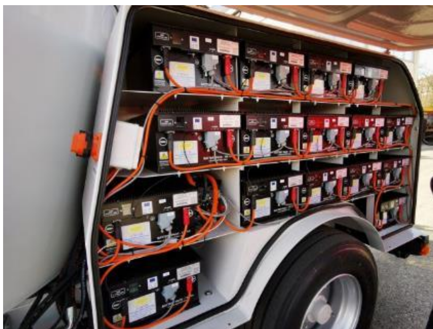
Slika 4.24. Prikaz električnih baterija proizvođača Supertino

Potpuno električni model „E-silokamm 4200“ dolazi od njemačkog proizvođača „Siloking“. Svi pogoni i hidrauličke jedinice su pogonjene električki pomoću standardne baterije 48V, 465Ah. Baterija omogućuje rad u trajanju od 2 sata nakon svakog ciklusa punjenja, a puniti se može električnom energijom iz javne mreže ili energijom dobivenom od obnovljivih izvora koja može biti dostupna po niskim cijenama.