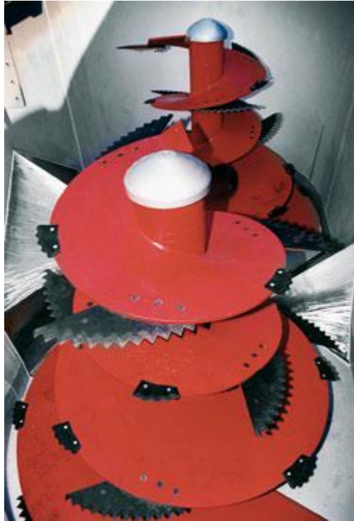
Slika 3.7. Prikaz pužnica unutar sanduka mikser prikolice

Slika broj 3.7. prikazuje pužnice unutar sanduka mikser prikolice talijanskog proizvođača Pagliari. Broj pužnica ovisi o veličini prikolice te tako isto i broj noževa na pužnici koji može varirati od 7-14 ovisno o izboru korisnika. Pužnice se također izrađuju od nehrđajućeg čelika, a okreću se u kontra smjeru te tako omogućuju kvalitetno miješanje i sjeckanje silaže. Noževi na pužnici mogu biti ravni ili nazubljeni te se lako mogu mijenjati.