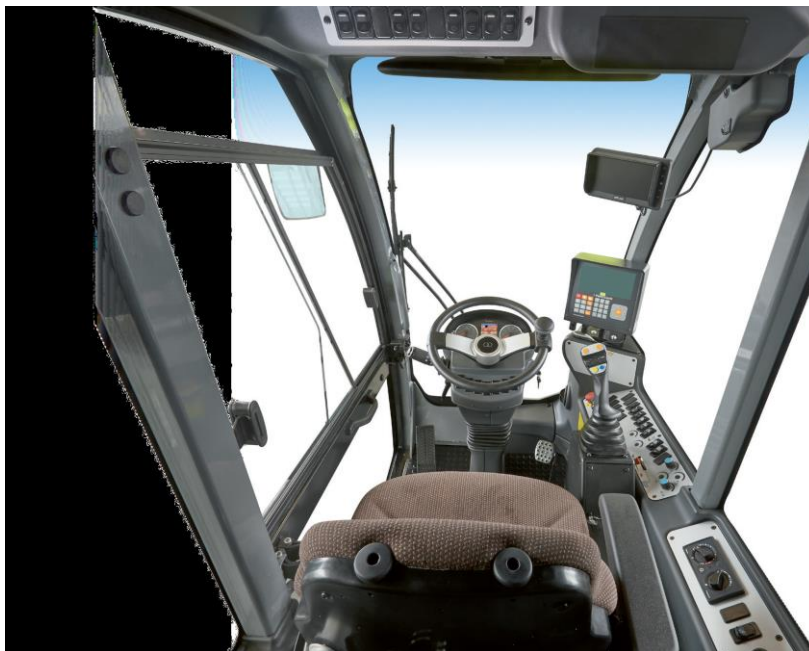
Slika 4.5. Unutrašnjost kabine samokretnog stroja Storti Dobermann

Maksimalna visina izuzimanja ovog stroja iznosi 5,70 metara dok je zahvat glodalice 1,80 metara. Glavna karakteristika ovog modela je specifičan proces miješanja. Pogon pužnica u spremniku se odvija mehanički sa suhom spojkom uz odabir dviju brzina vrtnje,