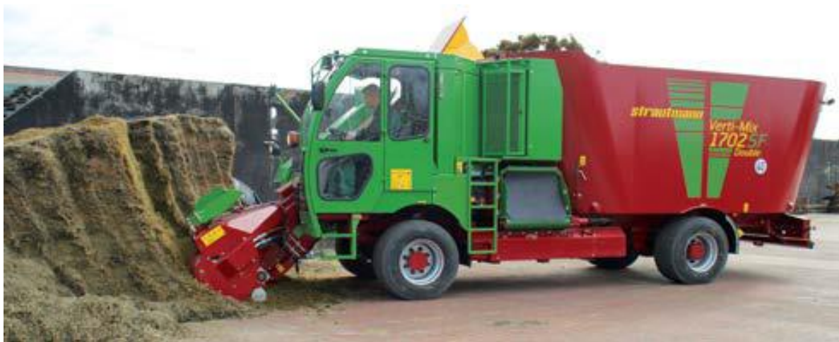
Slika 4.20. Samokretni stroj Strautmann Verti-Mix 1702 SF pri izuzimanju silaže