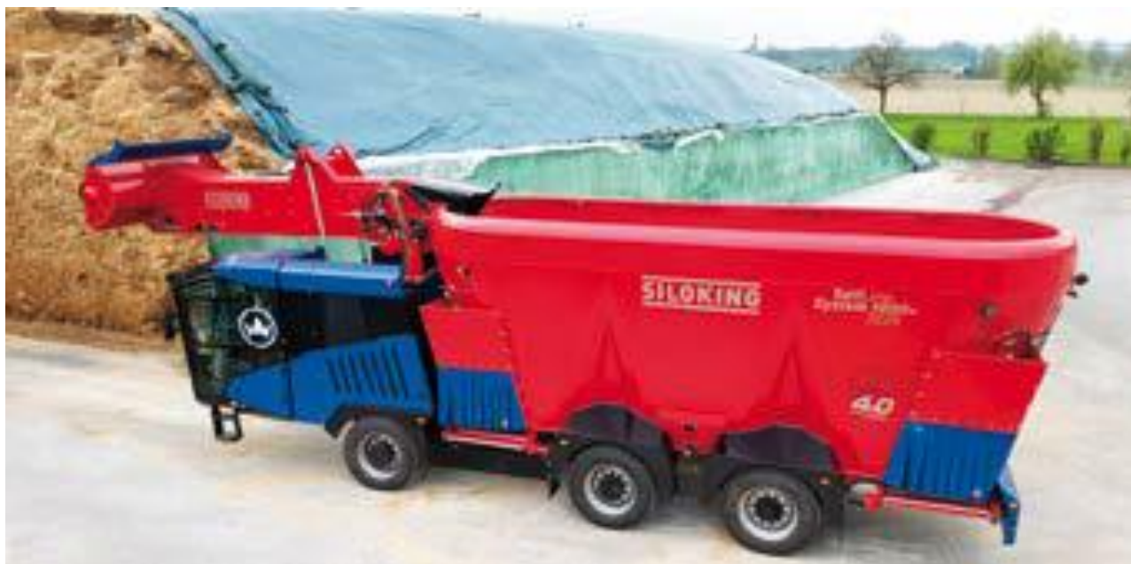
Slika 4.12. Samokretni stroj za izuzimanje, miješanje i raspodjelu silaže Siloking SelfLine System 1000+ 3225

U ispitnom centru njemačkog poljoprivrednog udruženja (Deutsche Landwirtschafts Gesellschaft - DLG) provedeno je ispitivanje dvaju modela samokretnih strojeva proizvođača Siloking: Compact 1612-13 i Premium 2215-19, a rezultati ispitivanja su prikazani u tablicama 4.3, 4.4. i 4.5.