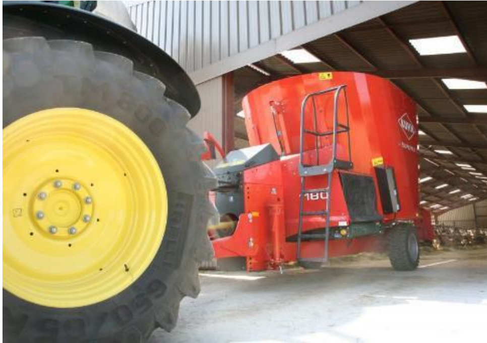
Slika 3.9. Mikser prikolica Kuhn

Jedna od najvećih mikser prikolica na svjetskom tržištu je SILOKING zapremnine 45 m 3 . Razvijena je za potrebe velikih farmi odnosno 1000 muznih krava ili više. Masa prikolice je raspoređena na 3 osovine te tako smanjuje opterećenje tla na poljoprivrednom imanju pri dolasku do objekta, a osim toga pruža i veliku udobnost pri vožnji po cestama. Tri vertikalne pužnice omogućavaju brzo i homogeno miješanje hrane što dodatno štedi vrijeme i utrošak goriva. Mikser prikolica je opremljena bočnim izlazima na lijevu i desnu stranu kako bi mogla vršiti raspodjelu hrane u objektu. Bežična vaga prikazuje težinsko stanje na okviru prikolice kako bi u svakom trenutku bilo vidljivo.