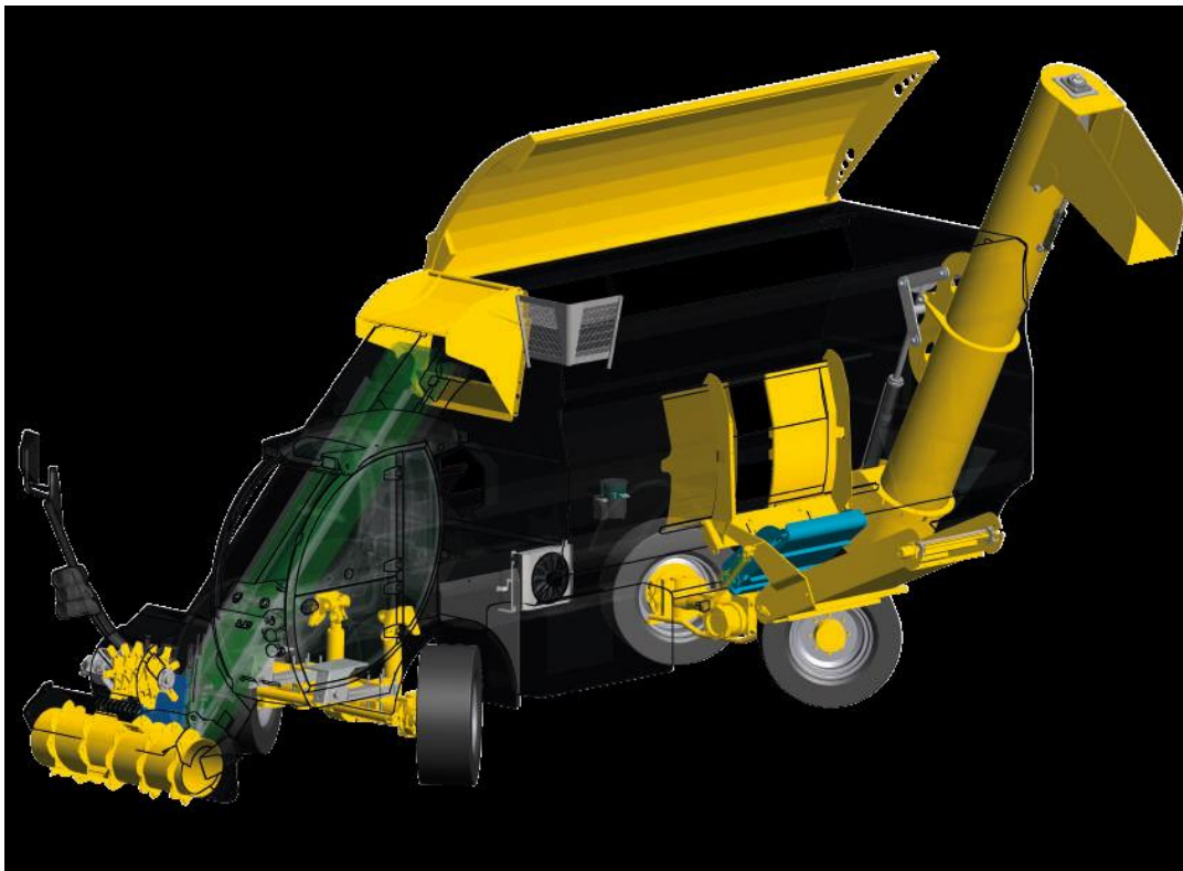
Slika 4.1. Shematski prikaz samokretnog stroja za izuzimanje, miješanje i raspodjelu silaže