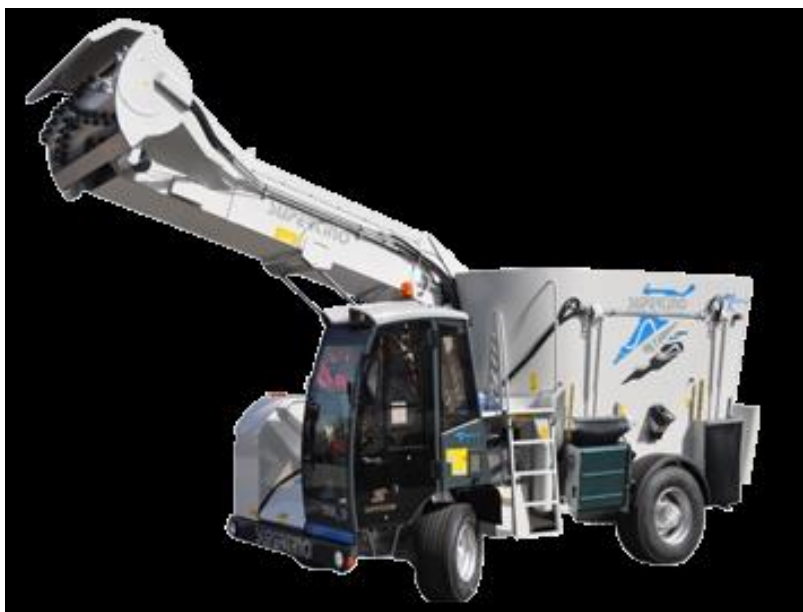
Slika 4.23. Električni samokretni stroj Supertino Electra 2