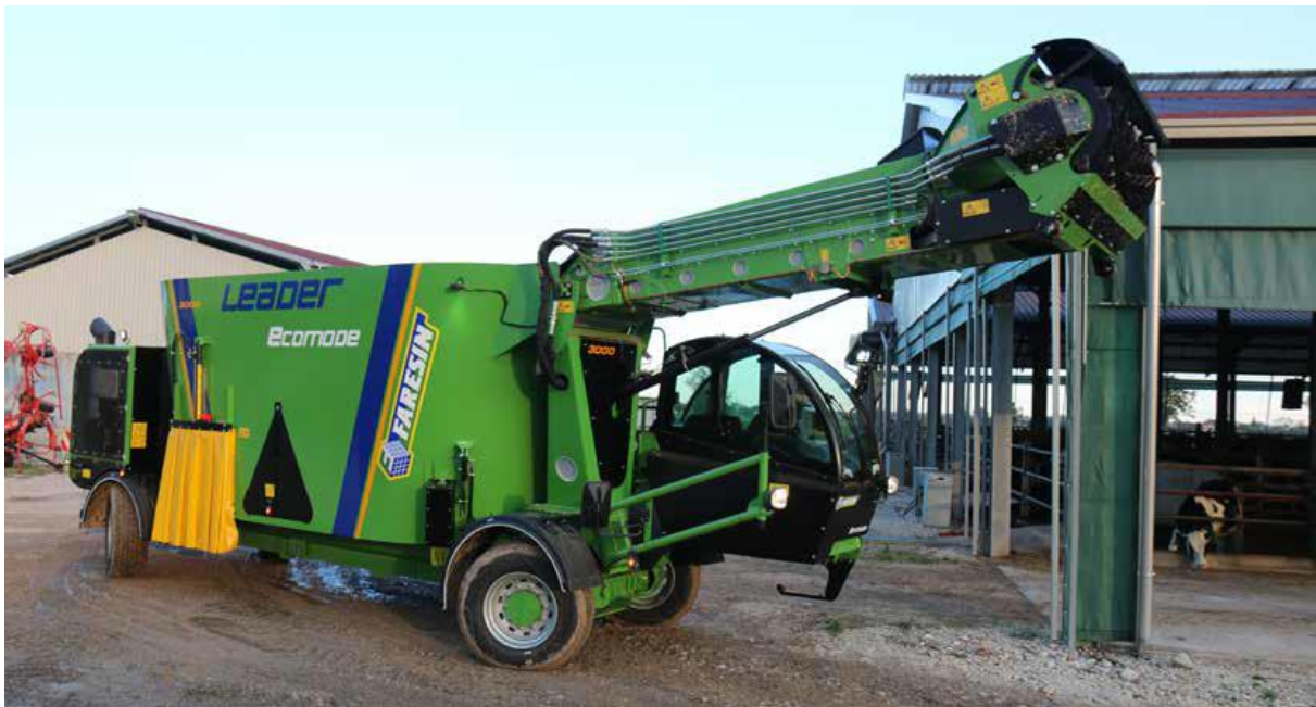
Slika 4.14. Samokretni stroj LEADER Ecomode proizvođača Faresin

Proizvođač poljoprivrednih strojeva Faresin aktivno djeluje od 1973. godine u Italiji sa sjedištem u pokrajini Vicenza. Tvrtku je osnovao današnji predsjednik tvrtke Sante Faresin te danas posluje s podružnicama u još par europskih zemalja. Samokretni stroj za izuzimanje, miješanje i raspodjelu silaže ove tvrtke je Leader Ecomode.