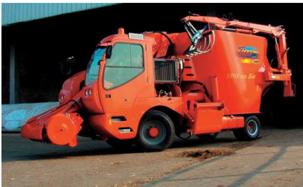
Slika 4.13. Samokretni stroj TIGER VM proizvođača SEKO

Svi modeli ovog proizvođača su opremljeni snažnim i ekološko prihvatljivim motorima proizvođača "Perkins" snage 129 kW. Karakteristično za ove modele je da imaju ugrađen prigušivač buke kako bi rad bio ugodniji kako za muzne krave tako i za rukovatelja. Dolaze u izvedbi s automatskim podmazivanjem svih ležajeva na stroju pomoću uljne crpke kapaciteta 5 litara. Spremnik goriva od 220 litara omogućava dugotrajan rad.