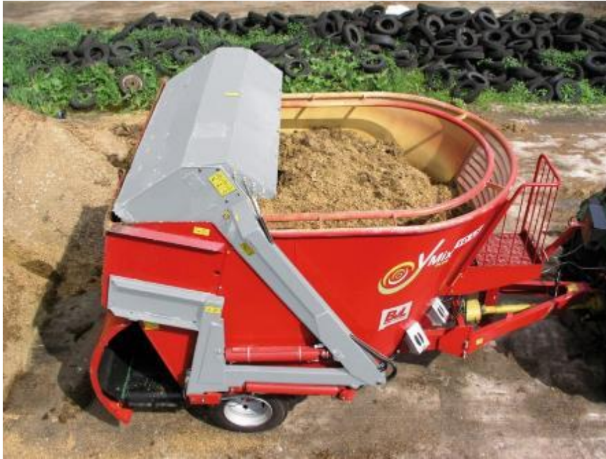
Slika 3.8. Samoutovarna mikser prikolica BVL V mix 8

Jedan od najpoznatijih proizvođača mikser prikolica je francuska tvrtka KUHN koja na tržištu ima najveću ponudu mikser prikolica od 5 m 3 do 45 m 3 te su razvili najsuvremeniji sustav miješanja silaže “Euromix”. Mikser prikolice mogu imati vertikalne ili horizontalne pužnice i različiti broj osovina. Kuhn je razvio model “Euromix” koristeći dugogodišnje iskustvo u dizajnu, razvoju i primjeni mikser prikolica radi ostvarenja sljedećih ciljeva: