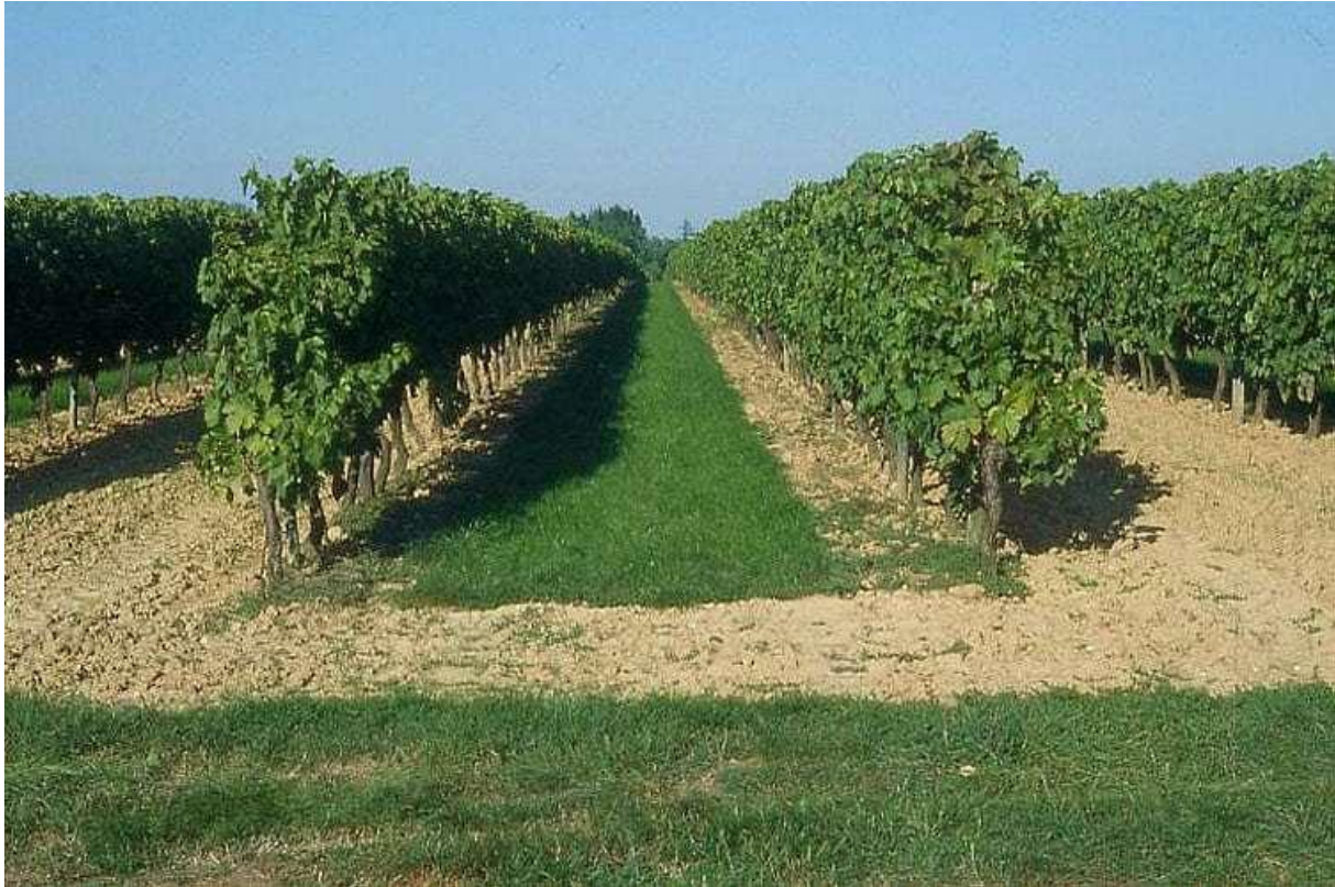
Slika 2.1.2. Zatravljanje vinograda