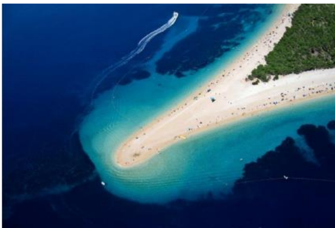
Slika 2.4.2.2.2. Morska erozija