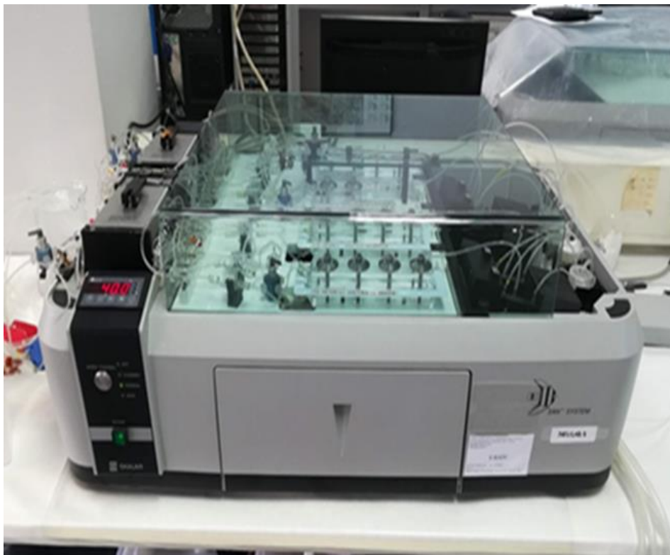
Slika 3.4.1. Analizator kontinuiranog protoka.

Kako bi se ustanovila kakvoća određivani su razni parametri kao što je pH koje se određivalo pomoću pH metra prema normi HRN EN ISO 10523:2012. Uz pH određivala se električna vodljivost (E.C.) na EC metru MPC 227 tvrtke Mettler Toledo prema normi HRN EN 27888:2008. Koncentracije nitrita ( \text{NO}_2^- ), nitrata ( \text{NO}_3^- ), amonijaka ( \text{NH}_4^+ ), klorida ( \text{Cl}^- ), fosfata ( \text{PO}_4^{3-} ), sulfata ( \text{SO}_4^{2-} ) određivale su se automatskim analizatorom kontinuiranog protoka (San ++ ContinuousFlow Auto-Analyzer, Skalar, Slika 3.4.1.) prema normama za određivanje nitrita (HRN EN ISO 13395:1998), nitrata (HRN EN ISO 13395:1998), amonijaka (HRN EN ISO 11732:2008) i klorida (SKALAR METHODS No. 514 (ISO 15682:2000)). Određivanje koncentracija hidrogenkarbonata ( \text{HCO}_3^- ), kalcija ( \text{Ca}^{2+} ), kalija ( \text{K}^+ ), magnezija ( \text{Mg}^{2+} ), natrija ( \text{Na}^+ ) se određivalo pomoću atomskog apsorpcijskog spektrometra (Atomic Absorption Spectrometer 3110, Perkin–Elmer). Određivanje koncentracije otopljenog organskog ugljika (engl. Dissolved Organic Carbon - DOC) odrađivalo se prema normi HRN EN 1484:2002.