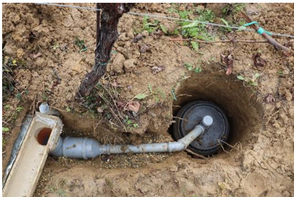
Slika 3.2.3. Instaliranje spremnika i cijevi na određenoj padini zbog osiguravanja otjecanja vode.

Osim kanalica i ostale cijevi i spremnik su morali biti postavljeni na određeni pad kako bi voda mogla otjecati. Uz to su kanalice fiksirane pomoću betona koji se izljevao u iskopane rupe (Slika 3.2.3).