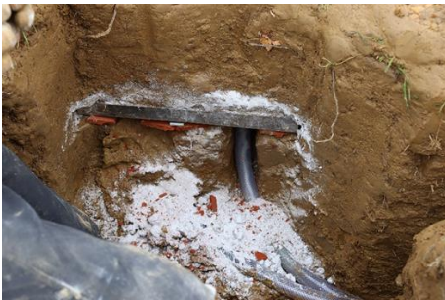
Slika 3.2.1. Umetanje lizimetara u tlo.