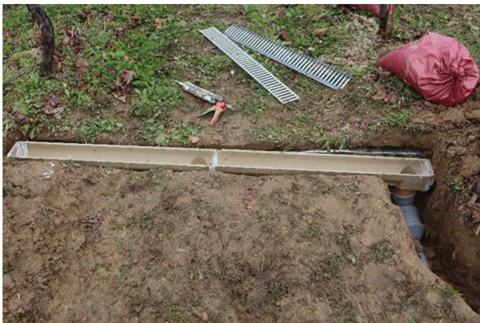
Slika 3.2.2. Postavljanje kanalice na određenom padu kako voda ne bi otjecala.