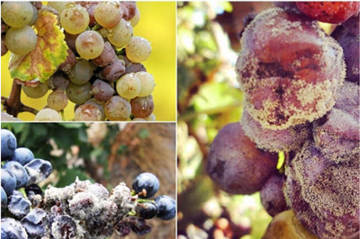
Slika 2.1.1.2. Siva plijesan vinove loze.