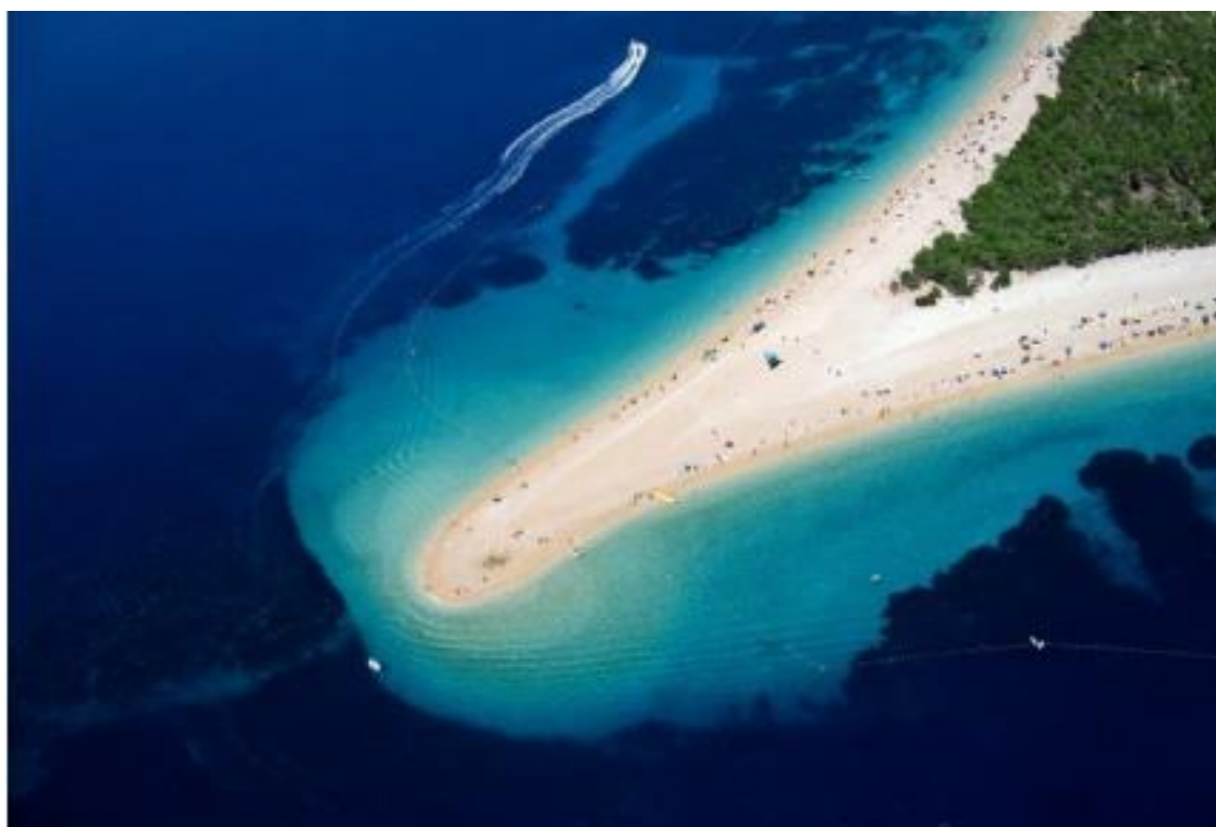
Slika 2.4.2.2.2. Morska erozija