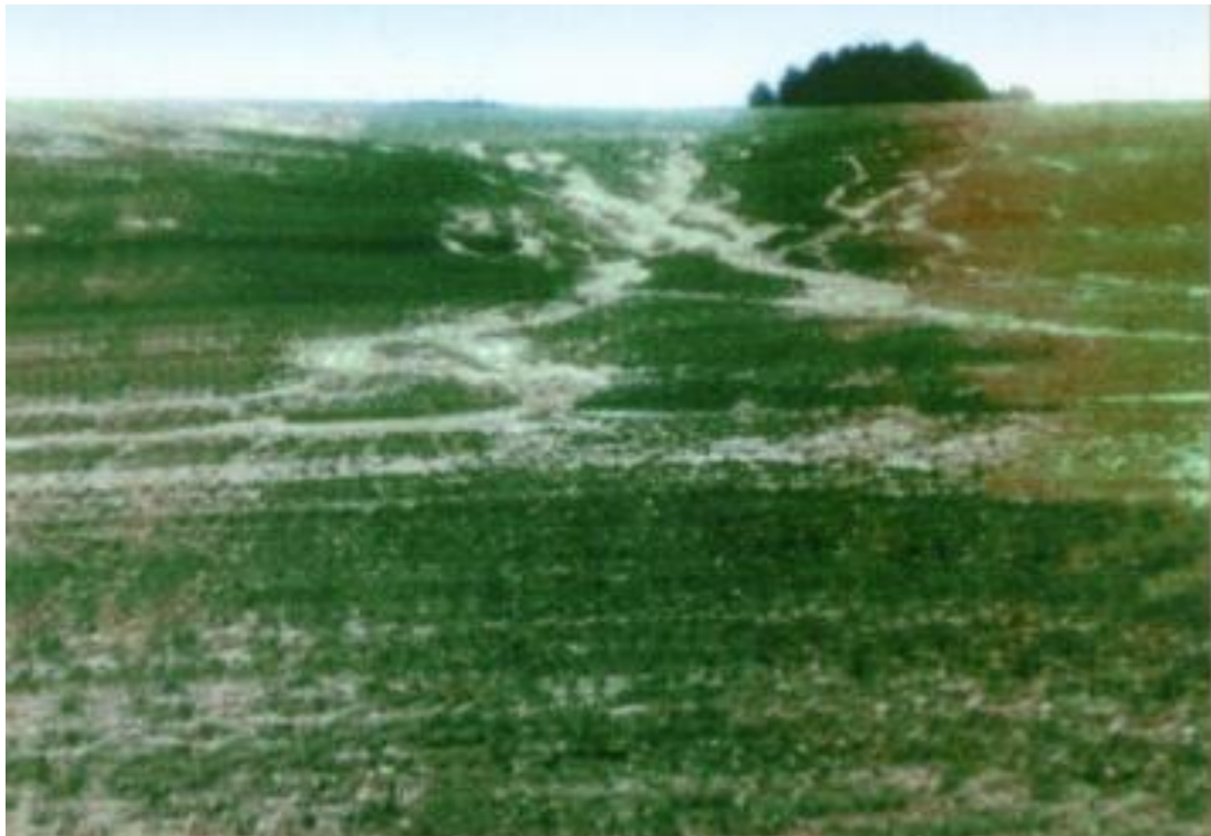
Slika 2.4.3.3.4. Plošna erozija