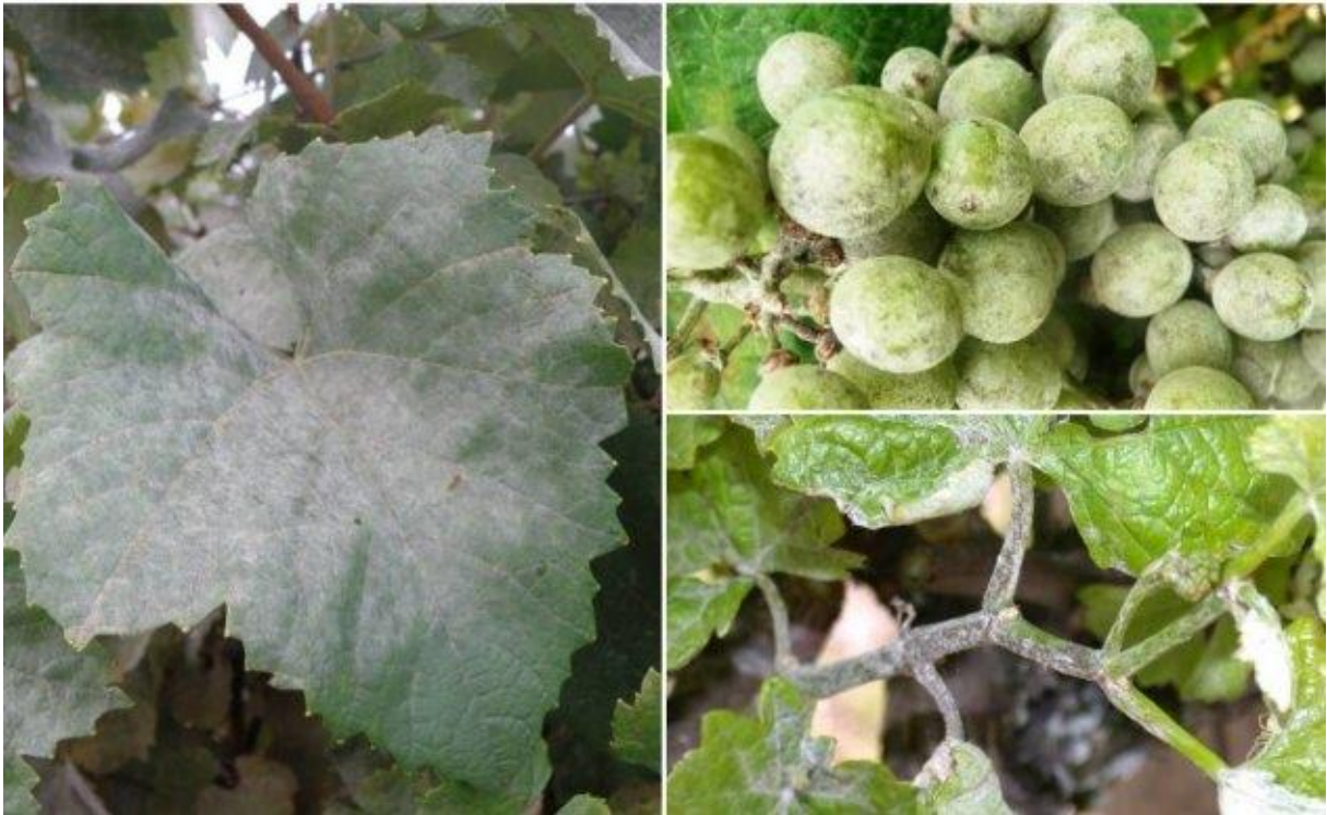
Slika 2.1.1.1. Pepelnica vinove loze.

o pepelnici su raspucale bobice grožđa sve do sjemenki, a do toga dolazi jer gljivice uništavaju pokožicu bobice i tiskaju unutarnji dio bobice.