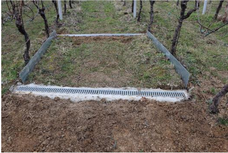
Slika 3.2.4. Sustav za površinsko otjecanje vode.