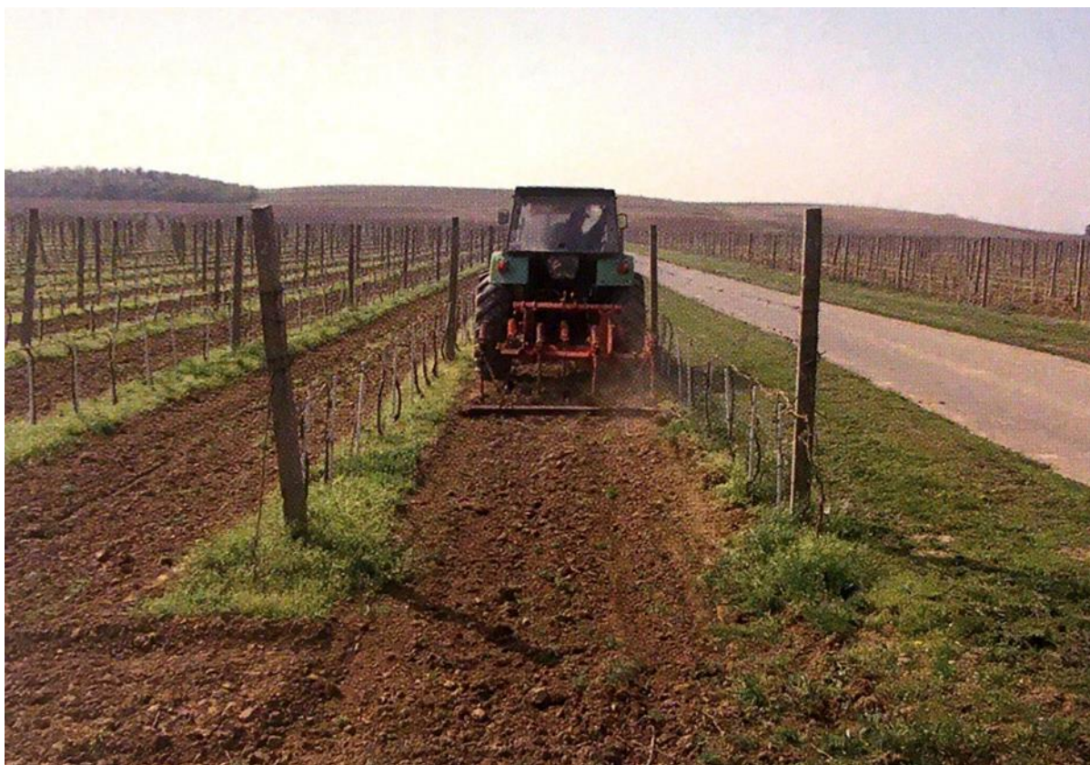
Slika 2.1.1. Proljetna obrada tla u vinogradu kultiviranjem.