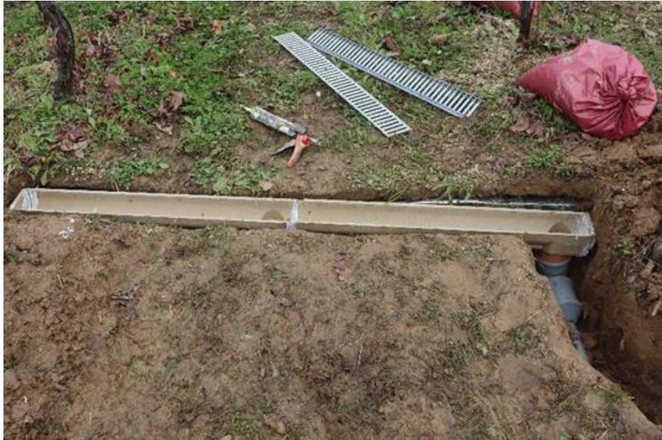
Slika 3.2.2. Postavljanje kanalice na određenom padu kako voda ne bi otjecala.

Osim kanalica i ostale cijevi i spremnik su morali biti postavljeni na određeni pad kako bi voda mogla otjecati. Uz to su kanalice fiksirane pomoću betona koji se izljevao u iskopane rupe (Slika 3.2.3).