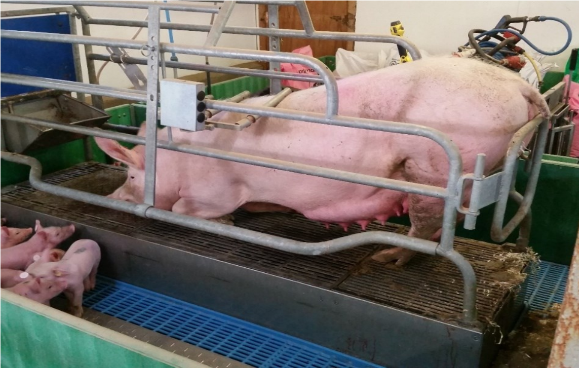
Slika 5.1. Prasilište sa visokom dobrobiti za prasid