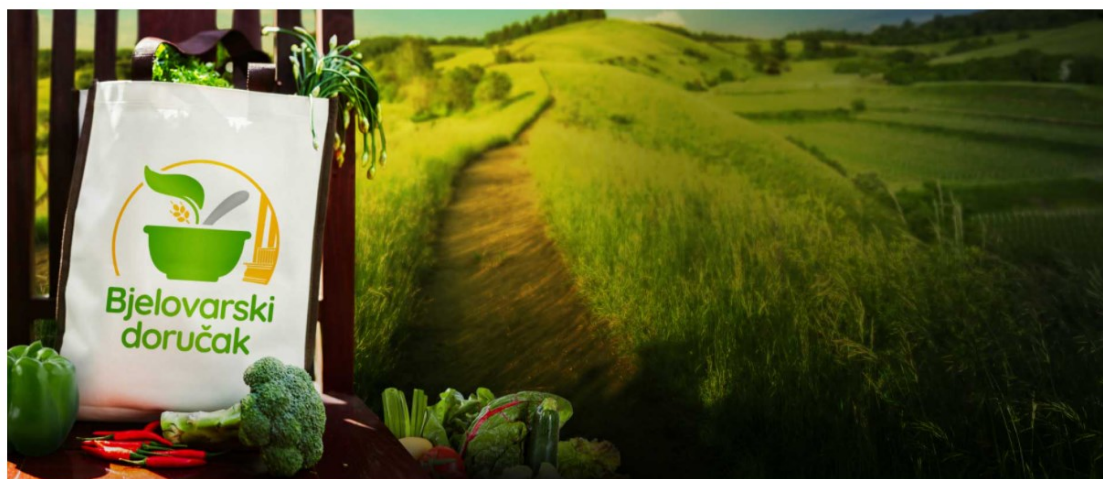
Slika 5.2.. Bjelovarski doručak