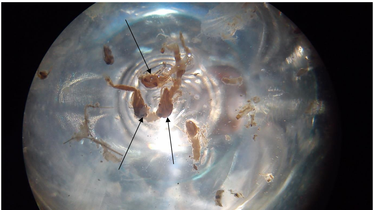
Slika 9. Mikroskopirane kukuljice kukaca iz reda Diptera