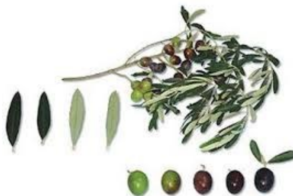
Slika 2.1.3. Buža

Ukoliko se ova sorta bere u početku žućenja ploda, daje ulje izvanredne kvalitete, izraženog svježeg mirisa, ugodne gorčine i izražene pikantnosti. Ukoliko se bere kad završava tamnjenje ili kad se mijenja boja ploda, tada daje slatko ulje, zaokruženog, voćnog mirisa po plodu masline, bez jače izražene arome.