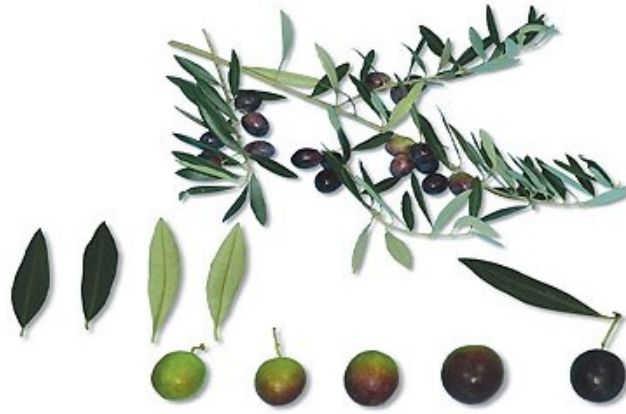
Slika 2.1.2. Istarska crnica