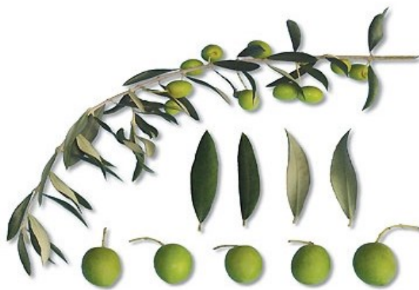
Slika 2.1.1. Istarska bjelica

Ova autohtona istarska sorta daje prepoznatljivo ulje svježeg mirisa na zeleni plod masline. Ulje je izvrsno i prepoznaje se po pikantnosti i gorčini.