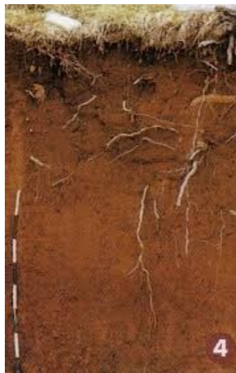
Slika 2.3.1. Crvenica

Sadržaj humusa je osrednji, pod prirodnom vegetacijom 3-5%, a na oranicama manje od 3%, zbog nepovoljnih uvjeta za stvaranje biomase, a povoljnih uvjeta za mineralizaciju odumrle organske tvari i humusa. Opskrbljenost fosforom je siromašna, dok je kalij unutar granica osrednje opskrbljenosti. Biološki je aktivno tlo (Škorić, 1990).