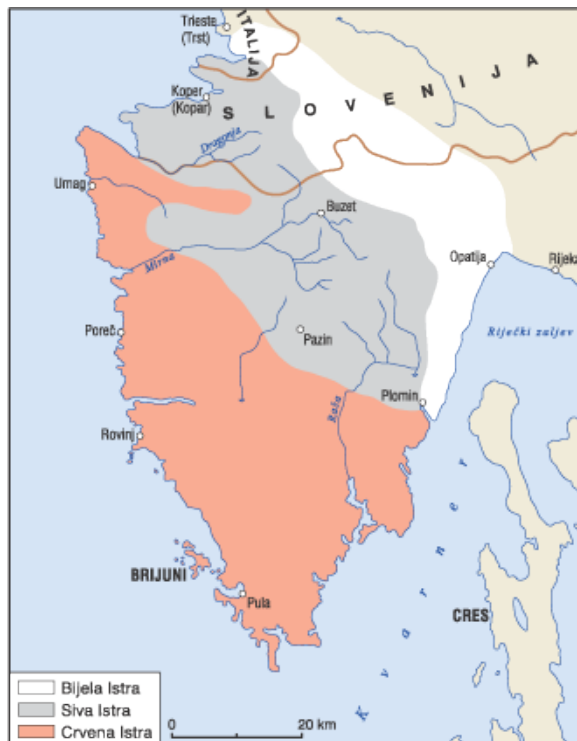
Slika 2.2.1. Geomorfološka podjela Istre

Geomorfološki gledano Istru se obično dijeli na tri dijela (slika 2.2.1.). Crvena Istra (zapadna obala)- gdje prevladava vapnenačko dolomitna podloga i crvenica, Siva Istra (središnja Istra) – gdje prevladava matični supstrat fliš, a od tala prevladavaju sirozem i rendzina, te Bijela Istra (padine Učke i istočni dio poluotoka) – gdje prevladavaju plitka, stjenovita i kamenita tla.