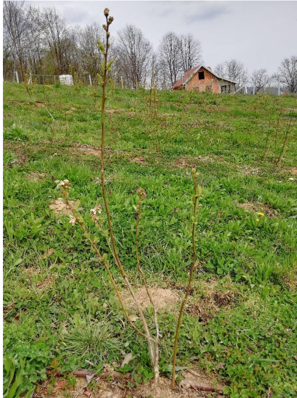
Slika 7. Sorta Spartan