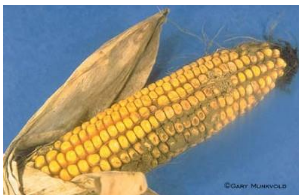
Slika 2.1.1. Aspergillus plijesni na klipovima kukuruza

Riječ „Aflatoksin“ se sastoji od triju riječi: „A“ – rod Aspergillus , „fla“ – flavus i „toksin“ – otrov. Aflatoksini stvaraju velike gubitke u proizvodnji i skladištenju kukuruza jer se kontaminiranim kukuruzom u koncentracijama iznad dopuštenih ne smiju hraniti životinje. Krmivima, pa tako i kukuruzom, koji sadrže manje od dopuštenih koncentracija aflatoksina smiju se hraniti životinje, ali i uz dodavanje tvari koje u konačnici onemogućuju ili smanjuju na zakonski prihvatljivu koncentraciju aflatoksina u mlijeku krava. Brojni su problemi u ublažavanju pojave aflatoksina u krmi i izbacivanju iz probavnog sustava mliječne krave. Primjera radi, jedna od teškoća u otklanjanju aflatoksina je njegova točkasta i neravnomjerna raspodjela u zrnju kukuruza (Slika 2.1.1.) koja otežava njegovo otkrivanje u kukuruzu pa se u praksi često događa da „nema“ aflatoksina u kukuruzu, ali ga ima u mlijeku. Naime, u mlijeku se aflatoksin ravnomjerno izlučuje pa ga je lako otkriti.