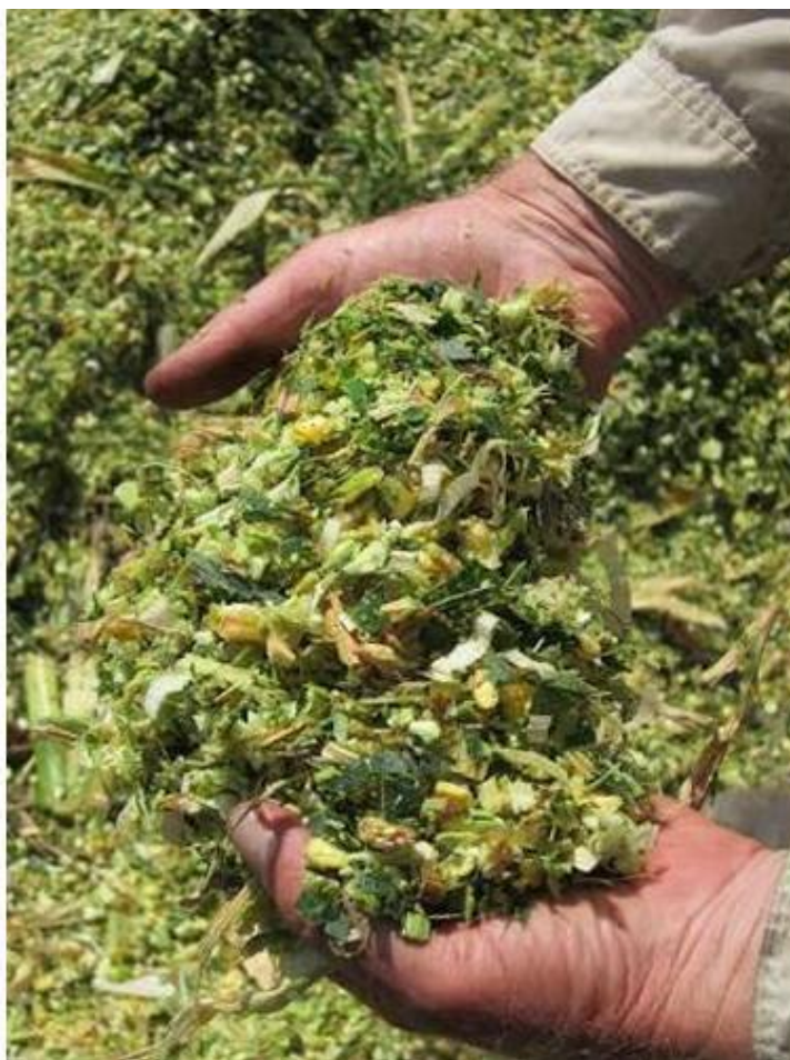
Slika 3.1.2.1. Primjerena sječka zelene mase cijele biljke kukuruza