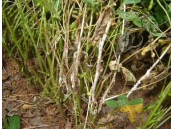
Slika 3.3 Bijela trulež korijena i stabljike