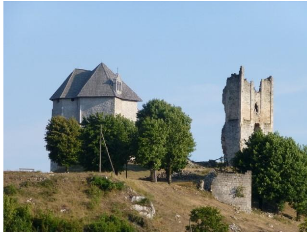
Slika 12. Srednjovjekovni plemićki grad Sokolac

ga nekoliko puta pokušali dešifrirati. Teorije kažu kako su urezi, nalik na germanske rune, zapravo primitivan mjesečev kalendar star čak 11.500 godina, dok urezani križevi sugeriraju kasnije mezolitsko svetište iz 15. stoljeća. Iza ulaza u spilju nalazi se prostrana dvorana sa prvim sifonskim jezerom koje se u proljeće, zbog obilnih oborina, prelije i izvire van spilje u obliku slapića. U spilji su nađeni i keramički predmeti, kosti životinja, te je pretpostavka da se radi o jednom od najstarijih tragova naselja. U Sinčić spilji je svoje utočište našla endemska vrsta iz skupine rakušaca, tzv. Redenšekov rakušac (1959), koji je u kategoriji kritično ugrožene svojte ( http://www.visitbrinje.hr/prirodna-bastina/ ).