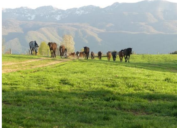
Slika 2. Ranch Vel'ki Mlin

Memorijalni centar „Nikola Tesla“ u Smiljanu otvoren je 10. srpnja 2006. godine povodom obilježavanja 150 godina rođenja Nikole Tesle. Uz interpretaciju Teslina života prezentira se i zavičaj u kojem je Nikola dobio nadahnuće za prve izumiteljske pokušaje. Centar je osmišljen tako da objedinjuje kulturu, znanost i turizam te okuplja razne tipove korisnika: djeca predškolskog uzrasta, školska djeca, studenti, umirovljenici, turisti, lokalno stanovništvo, Teslini fanovi, medijski umjetnici itd. Koncept Memorijalnog centra čine od prije postojećih; Rodna kuća, gdje je u prizemlju prikazan životni put i genijalnost velikog izumitelja, a u potkrovlju se nalaze replike Teslinih izuma; zatim uz kuću pripadajući gospodarski objekt i Crkva sv. Apostola Petra i Pavla te groblje, kameni spomenici i klupe arhitekta Zdenka Kolacija do novoizgrađenih sadržaja – trijem, pješačke staze, spomenik kipara Mile Blaževića, auditorij, multimedijalni centar i drugo ( http://muzejlike.hr/memorijalni-centar-nikola-tesla-smiljan/ ).