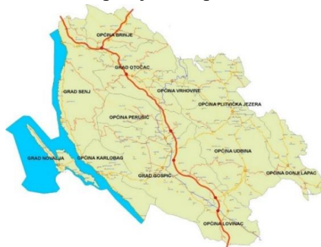
Slika 1. Ličko-senjska županija

Važnost Ličko-senjske županije u hrvatskom prostoru i izvan njega prvenstveno je određena funkcijom geoprometnog križišta, zatim pripadnošću njezina kontinentalnog područja geostrateškoj i ekološkoj jezgri Gorske Hrvatske (Ličko-senjska županija, 2010.). Među vodećim je županijama po broju zaštićenih prirodnih objekata i lokaliteta, a po njihovu udjelu u ukupnoj površini apsolutno vodeća županija u Republici Hrvatskoj.