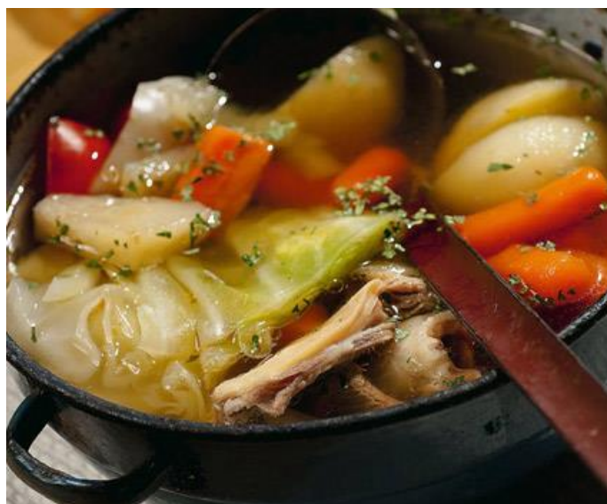
Slika 14. Lički lonac

Obrok započinje sirevima škripavcem i basom te dimljenom slaninom, pršutom ili šunkom, a završava uz uštipke ili domaću pogaču. Za glavno jelo može se birati između janjeće juhe sa suhim mesom, suhe braveće (ovčje) plečke u kiselome kupusu (Slika 14) ili kiseloj repi i kupusa s rebarcima i kobasicama. Može se probati rezance s gljivama, a također janjetinu, jaretinu i odojka s ražnja ili ispod peke, zatim jela od divljači, pohane žablje krakove ili pastrvu iz Gacke na različite načine ( http://lika-gastro.com/page/mozaik-kontinentalnoga-i-mediteranskoga ). U kontinentalnom se kraju također spremaju različite mesne preradevine, hladetine ili, kako kažu Ličani, dželadija ili žuica, čvarci ili žmare ( http://lika-gastro.com/page/top-10-jela-koja-trebate-probati-u-lici ).