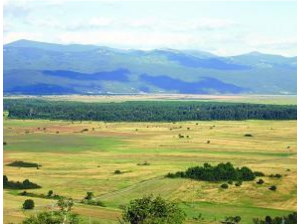
Slika 7. Laudanov gaj