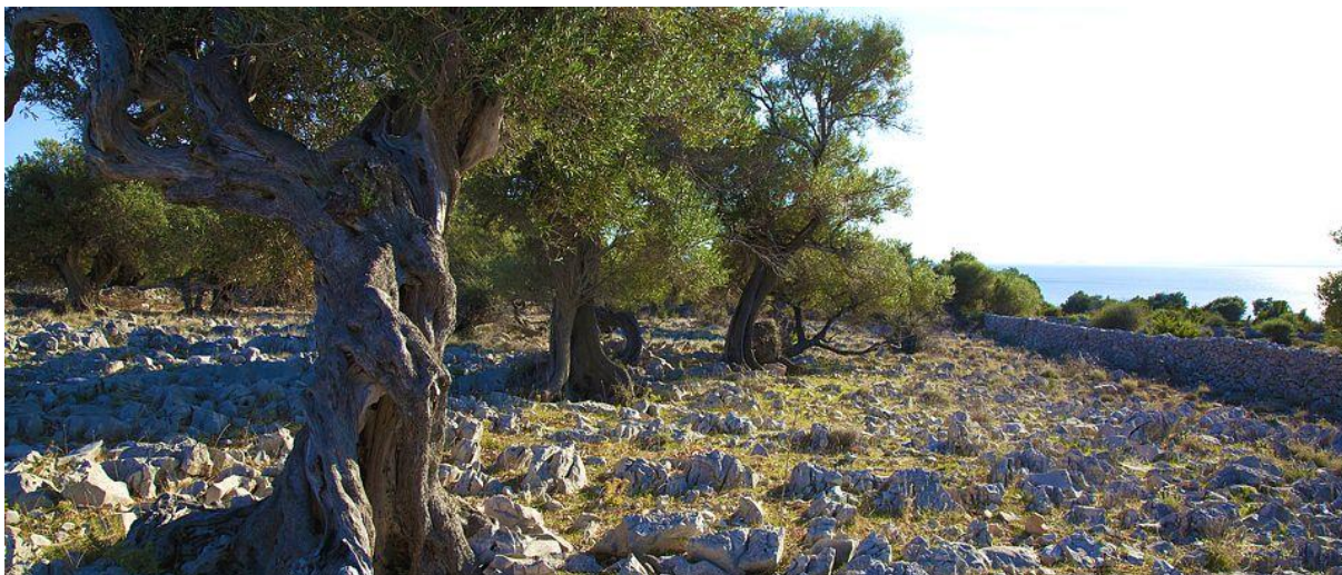
Slika 6. Lunjski maslinici