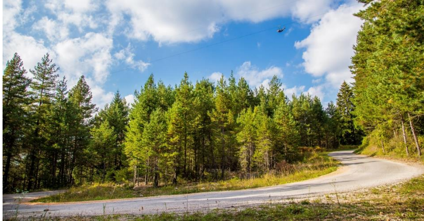
Slika 11. Zip line „Mali medo“

prilagođena i djeci od 5 godina i “ozbiljnim” penjačima, tako da svatko može naći nešto za sebe. Također u sklopu centra Bijeli vrh je u ponudi i Disc Golf, sport koji objedinjuje dva poznata sporta, golf i disk – frizbi. Disc Golf je namijenjen svima, rekreativcima i profesionalcima. Uz navedeno, u sklopu SRC Bijeli Vrh može se iznajmiti bicikl i istraživati oko 150 km označenih staza po poljima netaknute prirode Like i kroz gustu šumu Male Kapele ( http://tzo-vrhovine.hr/atrakcije/ ).