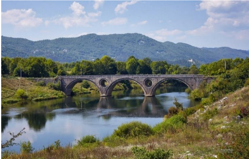
Slika 13. Kosinjski most