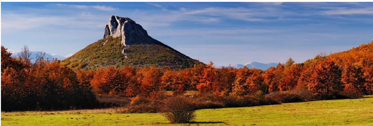
Slika10. Lovinac, Sveto Brdo

Općina Lovinac obuhvaća područje od 342 km. Smještena na južnom rubu Ličkog polja, na krajnjem jugoistočnom dijelu gorske Hrvatske, u trokutu Gospić – Udbina – Gračac. Prostor Općine je prirodno omeđen izdancima Ličkog sredogorja na sjeveroistoku i jugoistoku s planinskim masivom Resnika. Izrazitu geografsku među prema submediteranskom prostoru s jugozapadne strane, čini Velebit. Povoljan geografski položaj omogućio je kontinuiranu naseljenosti ovog kraja od pretpovijesti do danas. Na području Općine Lovinac u prapovijesno doba obitavali su pripadnici drevnog naroda Japodi, a o čemu svjedoče ostaci tzv.: Japodskih gradina i keramikom pokriveno tlo u Vraničkoj špilji, a ruševina utvrde Štulića kulina izgrađena 1744. svjedoči o vremenima ratnih osvajanja Turaka na ovim prostorima,