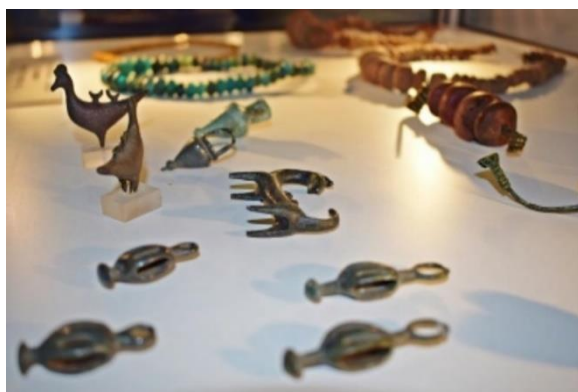
Slika 4. Japodska kultura

Stalni postav muzeja sastoji se od šest cjelina u kojima su izloženi predmeti šest muzejskih zbirki. Obilazak muzeja počinje arheološkom zbirkom koja svjedoči o prvim poznatim stanovnicima ovog kraja - lasinjskoj i japodskoj kulturi (Slika 4), a posjetitelja vodi sve do srednjeg vijeka i nastanka obrambenog otočnog grada - Otočca. O novijoj povijesti svjedoče predmeti povijesne zbirke izloženi u drugoj cjelini stalnog postava u kojoj je izloženo naoružanje te su prikazani kronologija Domovinskog rata i ratna razaranja na području grada Otočca. Treća i četvrta cjelina posvećene su likovnom stvaralaštvu. Peta cjelina uvodi posjetitelja u život kakav je za područje Otočca i Gacke bio karakterističan sve do sredine 20. st. te u okviru etnografske zbirke prikazuje kako je nekoć izgledala seoska svakodnevnica u kući i izvan nje. Posjet Muzeju Gacke završava na katu zgrade izložbom iz ciklusa posvećenog otočkoj industrijskoj baštini ( http://www.tz-otocac.hr/hr/gacka/muzej-gacke ).