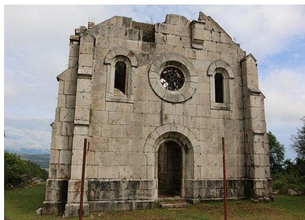
Slika 8. Crkva sv. Rođenja BDM u Buniću

Park šuma (Slika 7) se nalazi u sjeverozapadnom dijelu Krbavskog polja kod sela Šalamunić. U parku se nalazi oko 600 hrastovih stabala, starih oko 250 godina. Ova šuma predstavlja povijesnu vrijednost i primjer je uspješnog pošumljavanja sa svrhom zaustavljanja živog pijeska. Za njen nastanak je zaslužan vojskovođa Ernest Gideon Laudon, po kojem je šuma i dobila ime. 1960. godine je proglašena park šumom ( https://lika-active.com/page/otkrijte-udbina ). Živi pijesci spominju se još od Krbavske bitke, koja se odigrala upravo na prostoru Laudonova gaja. U puku živi predaja kako je u toku bitke s Turcima vjetar digao pijesak i nosio ga ravno u oči hrvatskoj vojsci, zbog čega je bitka i izgubljena. Istina je sasvim drugačija, bitka se odigrala 9. rujna 1493. godine kada nema zračnih strujanja niti nošenja pijeska vjetrom. Za vrijeme Vojne krajine u Buniću je 1756. godine, Ratno ministarstvo iz Beča dalo izgraditi crkvu sv. Rođenja Blažene Djevice Marije (Slika 8) od bijelog klesanog kamena u spomen Laudonu (Kranjčević, 2003.).