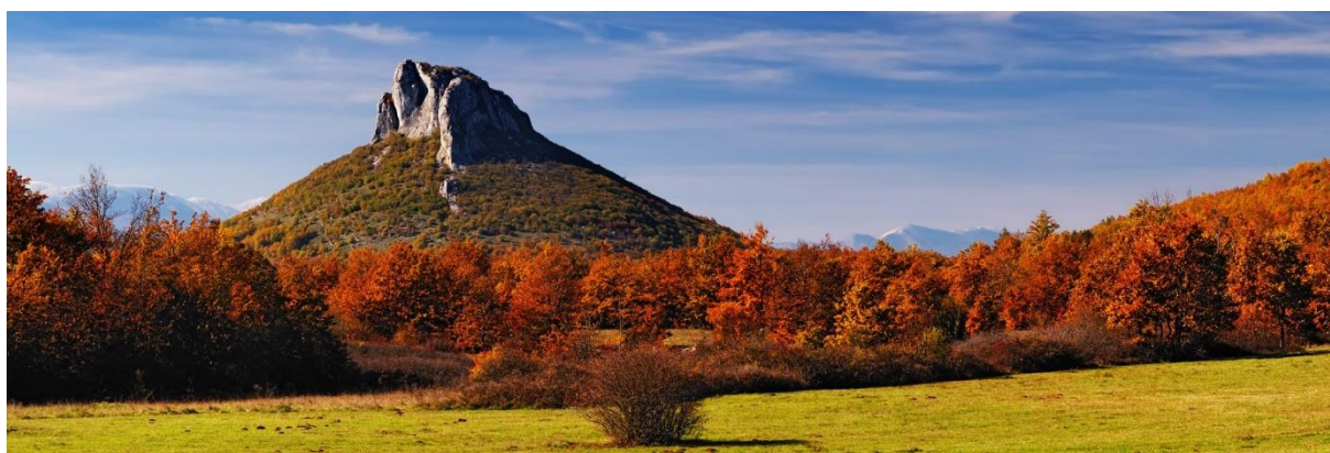
Slika10. Lovinac, Sveto Brdo

Općina Lovinac obuhvaća područje od 342 km. Smještena na južnom rubu Ličkog polja, na krajnjem jugoistočnom dijelu gorske Hrvatske, u trokutu Gospić – Udbina – Gračac. Prostor Općine je prirodno omeđen izdancima Ličkog sredogorja na sjeveroistoku i jugoistoku s planinskim masivom Resnika. Izrazitu geografsku među prema submediteranskom prostoru s jugozapadne strane, čini Velebit. Povoljan geografski položaj omogućio je kontinuiranu naseljenosti ovog kraja od pretpovijesti do danas. Na području Općine Lovinac u prapovijesno doba obitavali su pripadnici drevnog naroda Japodi, a o čemu svjedoče ostaci tzv.: Japodskih gradina i keramikom pokriveno tlo u Vraničkoj špilji, a ruševina utvrde Štulića kulina izgrađena 1744. svjedoči o vremenima ratnih osvajanja Turaka na ovim prostorima,