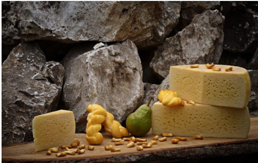
Slika 15. Paški sir

Stanovništvo otoka Paga tijekom stoljeća pripremalo je jela koja su mogla trajati dulje vrijeme, a jelovnik otočana uvjetovao je njihov način života koji je bio vezan uz pašnjake, polja i more. Najčešće se jelo usoljeno meso, usoljena riba, sir, skuta (Slika 15).