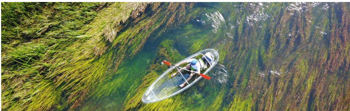
Slika 3. Kajakarenje na rijeci Gackoj

Posjetiteljima se međuostalim preporuča posjetiti: crkvu Presvetog trojstva, kapelu Blažene Djevice Marije u Poljicima iz 1723., etnografsku zbirku tradicionalnih vrijednosti na području Gacke: zbirka Grčević- Ličko Lešće, Gačanski park hrvatske memorije- kolonadu zavičajne povijesti od 9. do 21. st., Fortiku i otočku kiparsku Kalvariju. Od aktivnog odmora na području Grada Otočca posjetiteljima su u ponudi biciklističke staze, markirane planinarske staze, sportski aedrom: Otočac, sportski ribolov, kajakarenje (Slika 3), gledanje ptica na rijeci Gackoj i dr. ( http://visit-lika.com/ ).