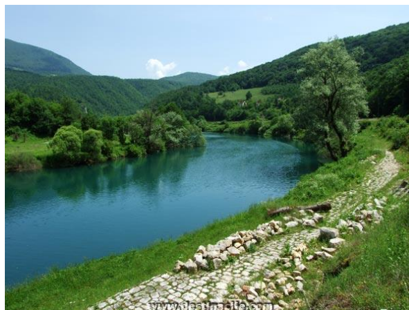
Slika 9. Rijeka Una

Općina Donji Lapac se nalazi na istočnom dijelu Ličko-senjske županije, u kraju poznatom po imenu Ličko Pounje, ispod planine Plješevice. Zauzima površinu od 354,2 km 2 te obuhvaća osamnaest naselja. Na križanju je magistralne prometnice Knin-Bihać i regionalnih prometnica D. Lapac-Udbina i D. Lapac-Bjelopolje. Općina Donji Lapac se nalazi na nadmorskoj visini od oko 600 m. Sa zapada je okružuju istaknuta uzvišenja Plješevice: Trovrh (1.620 m), Ozeblin (1.657 m) koji je ujedno i najviši vrh Plješevice, a sa sjeverne i istočne strane graniči s Bosnom i Hercegovinom gdje granica uglavnom prati kanjon rijeke Une ( http://www.unaspringoflife.com/pdf/StrategijaHr.pdf ). Povijest Donjeg Lapca seže još u antička vremena, u željezno i rimsko doba, o čemu svjedoče pronađeni ostatci predmeta, no sam grad osnovan je krajem 18. stoljeća, 1791. godine. U 19. stoljeću Donji Lapac se razvijao kao krajiški centar, dobro prometno povezan s okolnim i udaljenijim mjestima, međutim brojni ratovi na ovome području uvelike su utjecali na razvoj, ekonomiju i demografsku sliku grada. Prostor je gotovo netaknut, izrazito bogat florom i faunom, čistim zrakom i jednom od najljepših rijeka osigurava polazne mogućnosti za razvoj izvornog turističkog proizvoda i turističke ponude koja se u današnjim uvjetima prepoznaje kao lovni, ribolovni, planinarski, cikloturizam, odnosno izletnički turizam. ( http://www.donjilapac.hr ).