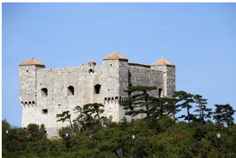
Slika 5. Tvrđava Nehaj