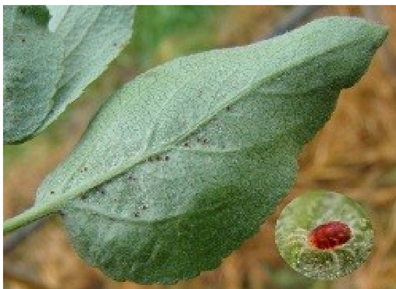
Slika 2.3. Štete na naličju lista uzrokovane crvenim voćnim paukom

Na napadnutom lišću se najprije vide žućkaste točkice koje ubrzo poprimaju ljubičasto-crvenkastu ili ljubičasto-smeđu boju, a najčešće su koncentrirane uz žile. Točkice se nakon određenog vremena spajaju i list se suši (slika 2.3.). Sisanjem pauci uzrokuju raspadanje zrnaca klorofila i koagulaciju protoplazme u oštećenim stanicama, zbog čega dolazi do pojave ovih točkica, a kasnije i do nekroze. Posljedica oštećenja listova je smanjena fotosinteza što konačno dovodi do snižavanja količine i kvalitete prinosa (Li i sur., 2004.). Najveće štete nastaju kod rane pojave odmah poslije cvatnje voćaka. Simptomi se rijetko pojavljuju prije cvatnje, iako mogu biti vidljivi čitavu godinu, pogotovo krajem ljeta. Štete od crvenog pauka su opasne poglavito u sušno doba godine jer se napad teže suzbija (Ciglar, 1998.). Tijekom ljetnog razdoblja dolazi do posmeđenja, sušenja i otpadanja lišća. Posljedice napada očituju se i u razvoju plodova i slabijem razvoju pupova pa su štete uočljive i sljedeće godine (Maceljski, 1989.). Provedena su mnoga istraživanja u kojima je utvrđeno stimulirajuće djelovanje mnogih preparata na crvenog voćnog pauka, kao što su kaptan, dodin, tiram, močivi sumpor, cineb (Collyer, 1953., Van de Vrie, 1962., Baggiolini i sur., 1969., Vrabl, 1974., Ciglar, 1981). Destimulirajuće djelovanje imaju: dinokap, hinometionat, binapakril i diklofluanid, dok mankozeb i propineb imaju neutralno djelovanje (Ciglar, 1998.).