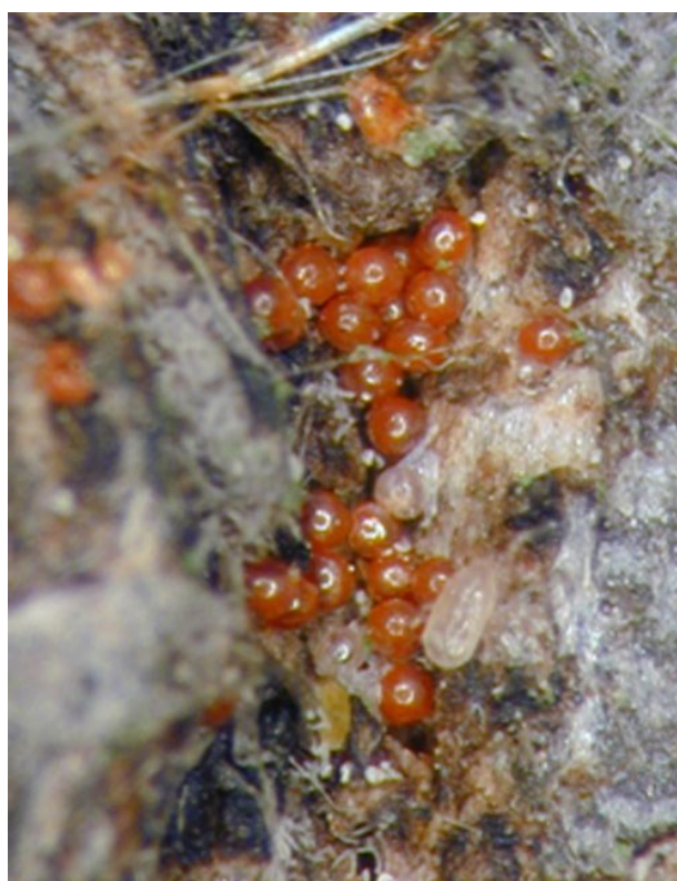
Slika 2.2. Jaja crvenog voćnog pauka

Maceljskom (1989.) optimalna relativna vlaga zraka od 60 do 75 i više posto. S obzirom na to da su pauki uglavnom koncentrirani na naličju lista, kiša ne ometa njihov razvoj, ali prema Maceljskom (1989.) vjetar jači od 1,5 m/sekundi može prenositi pauke i na taj način proširiti napad. Također, dokazano je i da se više pauka nalazi na jače osvijetljenim biljkama, što ukazuje na to da svjetlo ima pozitivan učinak. Zimska jaja ženke odlažu već od druge polovice kolovoza a njihov razvoj traje 170-230 dana. Rabbinge (1976.) navodi da je za izlaz ličinki iz zimskih jaja potrebna njihova izloženost temperaturama nižim od 10 °C barem 100 dana.