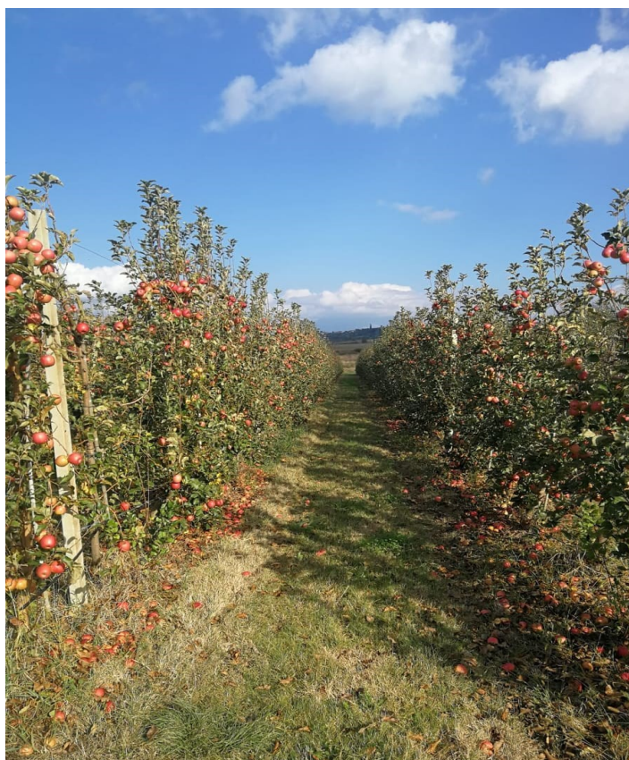
Slika 4.2. Nasad jabuka na Baštici

(slika 4.2.). Osim mehaničkim putem, korovi se suzbijaju i herbicidima. Prostor unutar reda mehanički se obrađuje. Gustoća sklopa iznosi 1,2 x 3,8 m. Na ovom nasadu od ranih ljetnih sorti zastupljene su Red Elstar, Gala, Golden Delicious, Granny Smith i Crisp Pink kao jesenske i zimske sorte jabuke. Ovim istraživanjem obuhvaćeno je šest sorata jabuke: Crisp Pink, Jonagold, Granny Smith, Gala, Summer Red i Red Elstar. Proizvodnja se provodi prema načelima integrirane proizvodnje, te je prije donošenja odluke o provođenju mjera zaštite obvezna procjena brojnosti štetnih organizama.