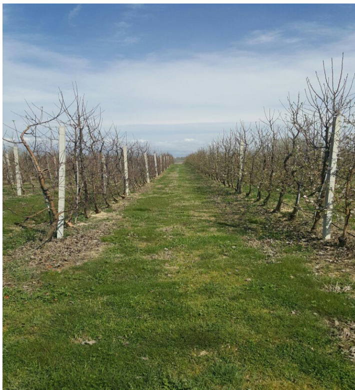
Slika 4.3. Nasad jabuka na Baštici za vrijeme zimskog mirovanja

mirovanja vegetacije. Jačina napada u idućoj vegetacijskoj sezoni može se prognozirati na osnovu broja odloženih jaja, te se na taj način pravovremeno može organizirati i zaštita. Za vrijeme zimskog mirovanja, u nasadu u kojem je provedeno istraživanje, jabuke su tretirane sredstvima na bazi repičinog ulja, koje se koristi i kod zaštite od nekih drugih štetnika. Zaštita, za vrijeme vegetacije, provođena je akaricidima na bazi abamektina. Grančice, dužine 20 cm uzete su po jedna sa svakog od reprezentativnih stabala u voćnjaku. Uzorak za pregled je iznosio 10 grančica po 20 cm, odnosno 2 m. Prema Ciglaru (1998.), kritičan broj jaja crvenog voćnog pauka metodom zimskog pregleda iznosi od 800 do 1000 na 2 metra dužinska. Pregled je obavljen u 3 ponavljanja po sorti. Prikupljeni uzorci su dopremljeni u laboratorij Odjela za ekologiju, agronomiju i akvakulturu u Zadru, gdje su pregledani pomoću binokularne lupe.