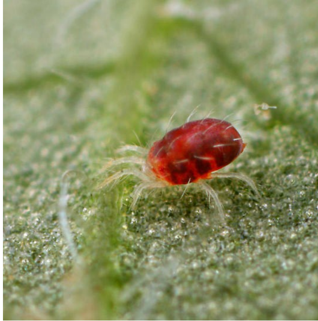
Slika 2.1. Crveni voćni pauk ( Panonychus ulmi Koch)