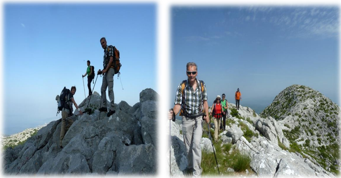
Slika 4.3.8. Planinarenje i izleti po planini Mosor

Tu su također, 2 betonska stola s klupama za odmor. Nekoliko metara od križa je metalna kutija sa žigom s vanjske strane kutije, dok je unutar kutije upisna knjiga. Sam vrh omogućava širok vidik na obje njegove strane i sve vrhove na hrptu Mosora. Od Vickovog Stupa do V. kabla 1 h hoda. Od V. Kabla slijedi spust stazom zvanom „Ljuto kame“, preko skloništa Kontejner do planinarskog doma Umberto Girometta. Ovaj naziv doista je opravdan, sve do raskrižja putova: gdje se staza lijevo odvaja za Donji Dolac, ravno za Kozik. Od ovog križanja napušta se krška divljina „Ljuto kame“ i nastavlja se pitomom, vrlo ugodnom stazom za hodanje sve do doma.