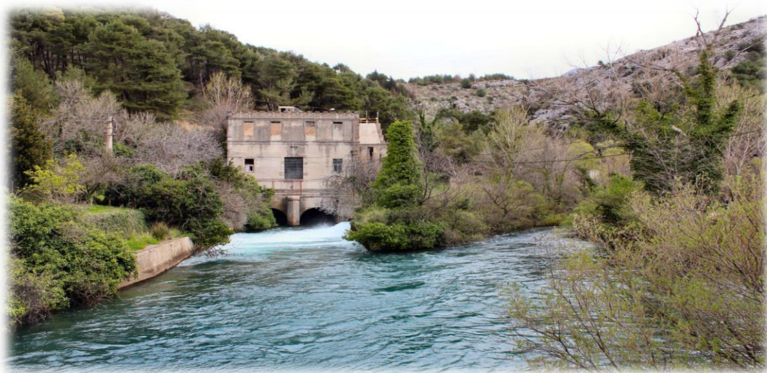
Slika 4.2.1. Rijeka Jadro izvor

Izvor rijeke Jadra koristio se još u antici za opskrbu vodom, putem akvadukta, rimske Salone i Dioklecijanove palače. Zbog njena značaja i događaja iz starohrvatske povijesti, naziva ju se i hrvatskim Jordanom. Na njoj se nalazi Gospin Otok na kojem je hrvatski povjesničar i arheolog don Frane Bulić (1846.-1934.) otkrio brojne nalaze iz starohrvatskog razdoblja, uključujući ulomke s epitafom na sarkofagu kraljice Jelene (976.), značajne za utvrđivanje kronologije srednjovjekovne hrvatske povijesti i rodoslovlje dinastije Trpimirovića ističe (Pavich, A. 2006). Odlukom Skupštine općine Split od 22.3.1984. godine gornji tok rijeke Jadro zaštićen je u kategoriji posebni ihtiološki rezervat. Površina rezervata je oko 7,8 ha, a obuhvaća vodotok i obalu rijeke Jadro od izvora do Uvodića mosta.