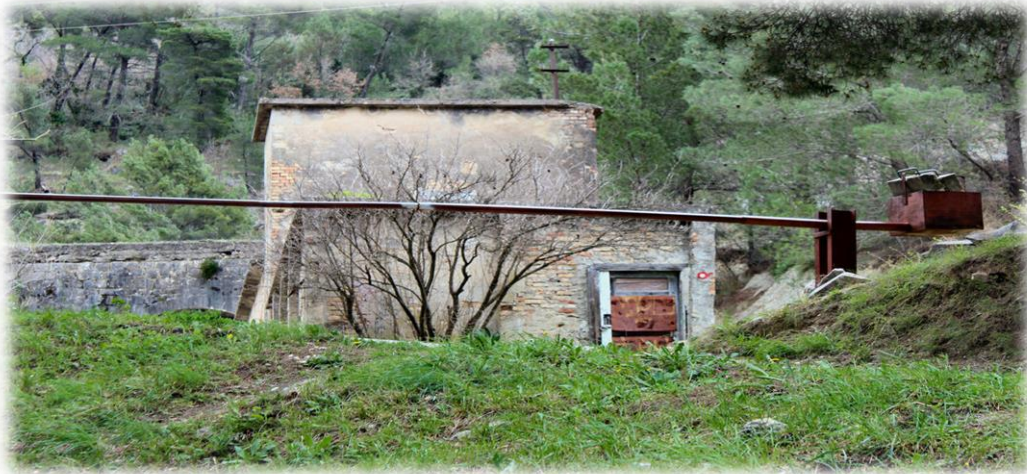
Slika 4.3.1. Planinarska markacija kod izvora Jadra, na početku staze za Debelo brdo