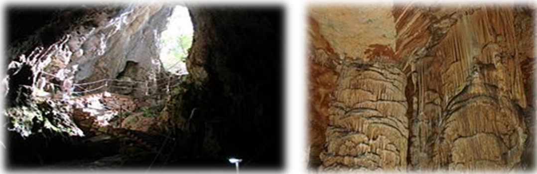
Slika 4.1. Špilja Vranjača

Špilja Vranjača ; špilja smještena u podnožju središnjeg dijela planine Mosor, s njene sjeverne strane, kod sela Kotlenice, na području Dugopolja, kraj Splita. Pristup špilji je moguć iz smjera Dugopolja, a do špilje vodi 300 metara duga makadamska cesta koja se u Kotlenicama, u zaseoku Punde, odvaja od glavne ceste kroz Kotlenice. Ulazna dvorana špilje je bila poznata mještanima Dugopolja još u 19. stoljeću. Drugu dvoranu je 1903. otkrio Stipe Punda, vlasnik zemljišta na kojem se špilja nalazi. Profesor Umberto Girometta zaslužan je za propagiranje ljepota špilje, zbog kojih je otvorena za posjetitelje 1929. godine. Špilja s sastoji od dvije dvorane. Ulazna dvorana nema siga, a iz nje se kroz mali prirodni hodnik ulazi u drugu dvoranu, prepunu sigastih ukrasa raznih oblika i boja. Druga dvorana obiluje stalaktitima i stalagmitima. Ukupna dužina špiljskih kanala iznosi oko 360 metara objašnjava (Pešić N. 2006. ). Temperatura unutar špilje identična je u svako doba godine i iznosi 15°C. Špilja ima uređene stepenice, konope postavljene duž stepenica i staze za posjetitelje, postavljenu rasvjetu, vrata i nadzornu službu.