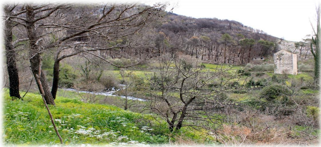
Slika 4.2.3. Kula u Dvorima

ranosrednjovjekovnog nakita. Kula u Dvorima sagrađena u vrijeme turske vlasti na ovome području u 17. stoljeću sagradio solinski spahija Ahmed-aga Omerbašić.