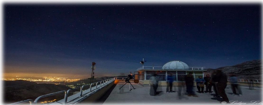
Slika 4.2.4. Pogled na Split sa zvezdanog sela Mosor

Na planini Mosor nalazi se Zvezdano selo Mosor 15 , s nekoliko teleskopa. Zvezdano selo Mosor smješteno je na brdu Makirina, na 700 metara nadmorske visine, od grada Splita udaljeno 22 kilometra. Dobri klimatski uvjeti, čist zrak i lijep pogled daju prednost u boravku i smještaju iako je objekt prvenstveno namijenjen za edukaciju mladeži iz astronomije, ekologije, povijesti, geografije, meteorologije, umjetnosti i raznih područja tehničke kulture.