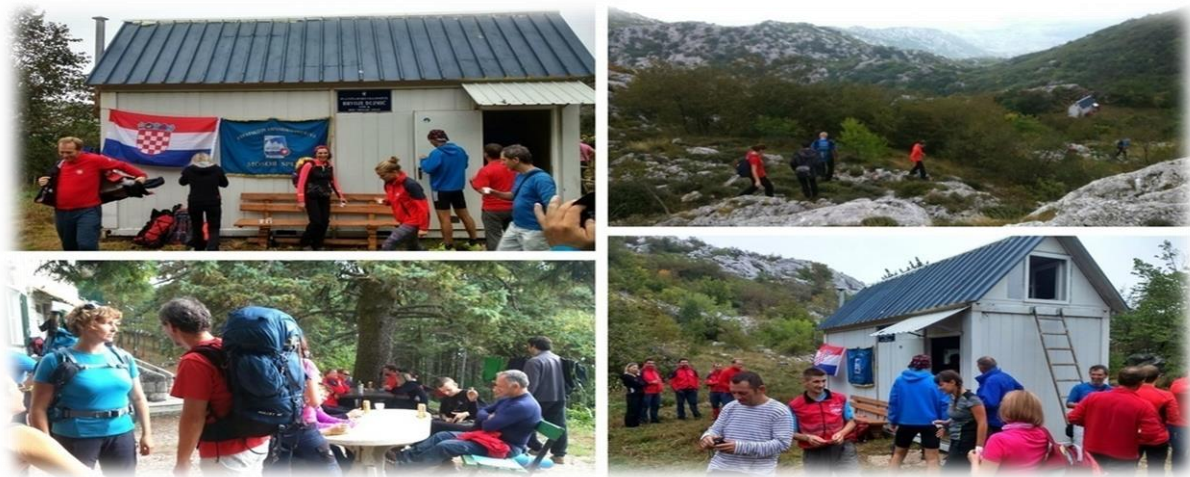
Slika 4.3.4. Planinarsko sklonište "Hrvoje Dujmić" Mosor

Planinarsko sklonište Hrvoje Dujmić nalazi se na teško pristupačnom visinskom području Jabukovca, na sjevernoj strani Mosora, ispod vrha Veliki Kabal. Sklonište je zapravo metalni kontejner, uređen za planinarske potrebe. Nalazi se na rubu slikovite travnate zaravni, uz put koji se iz Kotlenica mimo špilje Vranjače uspinje prema Velikom Kablu. Na području Jabukovca ima mnogo zanimljivih speleoloških objekata. Sklonište je nazvano po iznenadno preminulom splitskom planinaru i gorskom spašavatelju. Otvoreno je stalno. Broj kapaciteta je 10 kreveta.