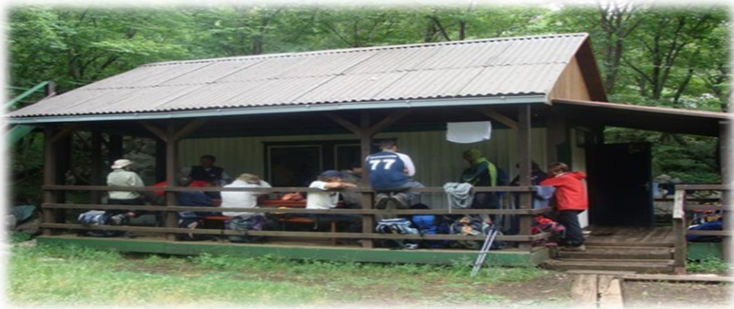
Slika 4.3.6. Planinarsko sklonište Kontejner Mosor

radnim danom zatvoren, planinarsko sklonište Kontejner postalo je važna točka, osobito za one planinare koji žele proći uzduž cijelog Mosora. Osnovu skloništa čini montažni kontejner na koji su poslije dograđeni krov i veranda. Otvoreno je stalno. Ima kapacitet noćenja za 10 osoba.