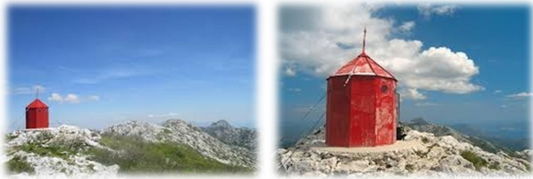
Slika 4.3.3. Planinarsko sklonište Vickov stup Mosor