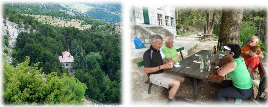
Slika 4.3.5. Planinarski dom "UmbertoGirometta" Mosor

Otvoren je vikendom, a pruža hranu i piće. Broj kapaciteta noćenja je 82 kreveta. Mosor Film Festival se održava u samom srcu dalmatinske najposjećenije planine, na prostranoj livadi Ljuvač tik pod planinarskim domom „UmbertoGirometta“(Pešić N. 2006.). Ova zelena oaza je idealno mjesto za odmor duše i tijela čak i tijekom vrućih ljetnih mjeseci. Smještena je na nadmorskoj visini od 850 m i okružena gustom šumom crnog dalmatinskog bora, dok preko livade teče potočić Ljuvač koji se vodom napaja iz istoimenog izvora, pružajući dašak osvježenja brojnim posjetiteljima. Savršen kontrast okolnom ljutom kršu Mosora.