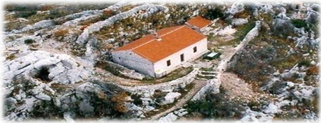
Slika 4.3.2. Planinarska kuća Lugarnica Mosor

Planinarska kuća Lugarnica nalazi se u teško pristupačnom kršu na zapadnom dijelu Mosora, na Užinskoj kosi. Sagrađena je 1903. i služila je kao šumarska lugarnica. Stara lugarnica je 1994. stradala od udara groma, ali je nakon toga obnovljena (Poljak, Ž. 2008.). Kuća sada ima kuhinju sa štednjakom na drva i blagovaonicu, dnevni boravak, sobu sa skupnim ležajem na dvije etaže, pitku vodu i struju (agregat). Planinarska kuća je otvorena svakog vikenda, osim tijekom ljetnih mjeseci. Broj noćenja kapaciteta je 20 kreveta.