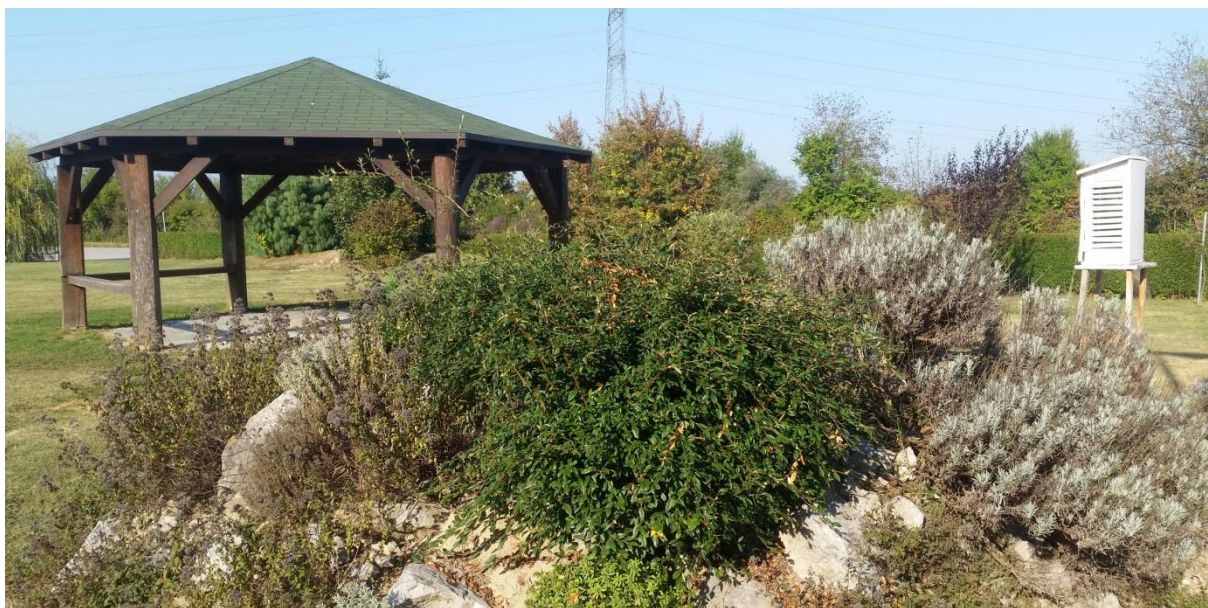
Slika 14. Meteorološka kućica i sjenica