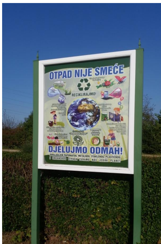
Slika 15. Znak s informacijama o recikliranju