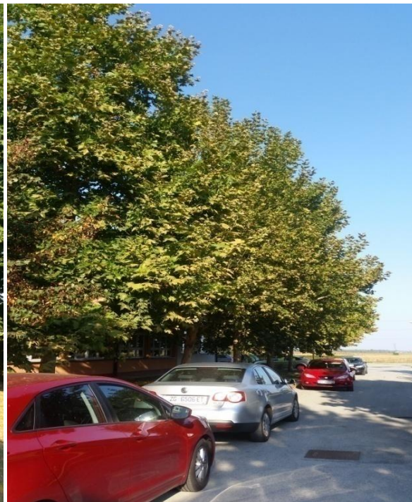
Slika 11. Platanus occidentalis L. i Tilia cordata Mill.