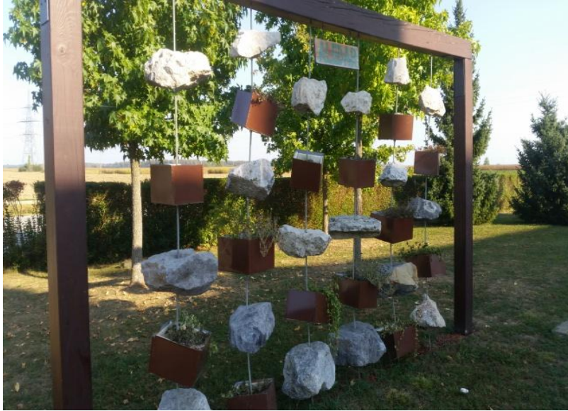
Slika 12. Viseći vrt

Školski vrt ima nekoliko zanimljivih detalja, a to su: viseći vrt (Slika 11), posude za cvijeće izrađene od automobilskih guma (Slika 12.), meteorološka kućica i sjenica (Slika 13.), znak s informacijama o recikliranju (Slika 14).