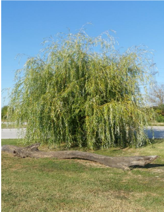
Slika 8. Salix babylonica L.