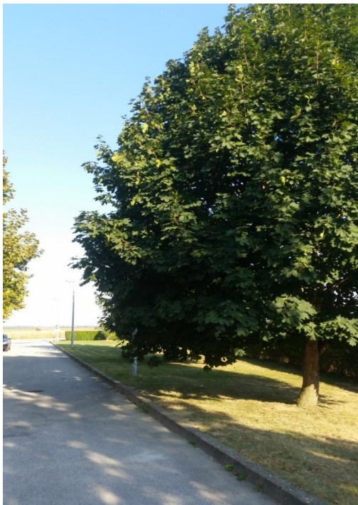
Slika 10. Acer platanoides