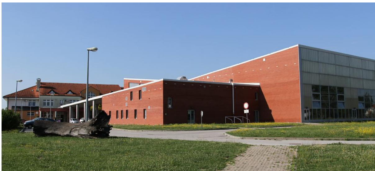
Slika 1. OŠ Rugvica