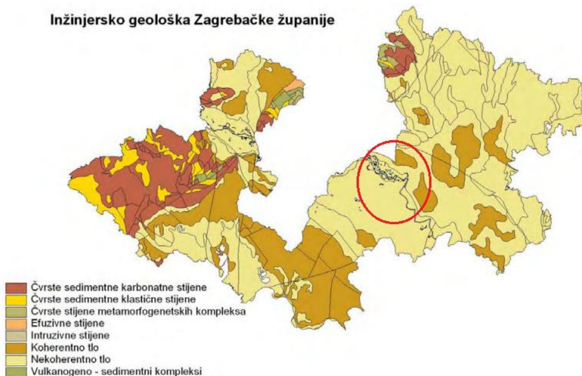
Slika 7. Inženjersko-geološka karta Zagrebačke županije