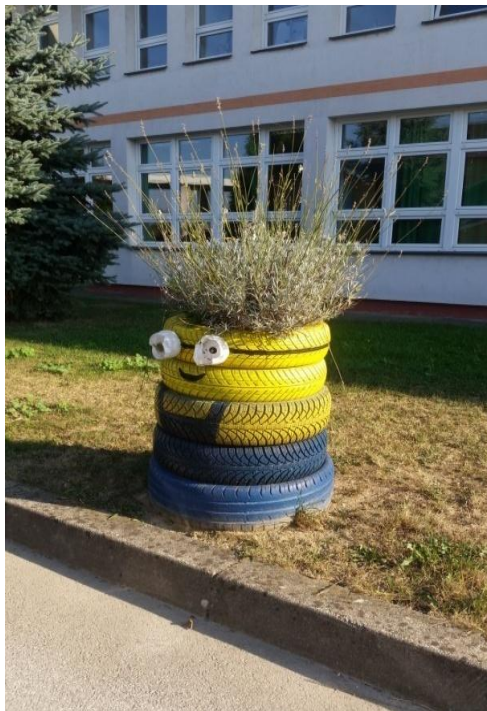
Slika 13. Posude za cvijeće od gume