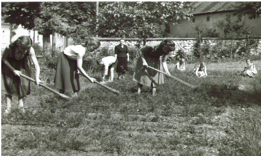
Slika 2. Školski vrt Ivanec, kraj 40-ih godina 20. stoljeća.

Na Slici 2. vidljiv je školski vrt kojeg obrađuju učenice pod mentorstvom učiteljice.