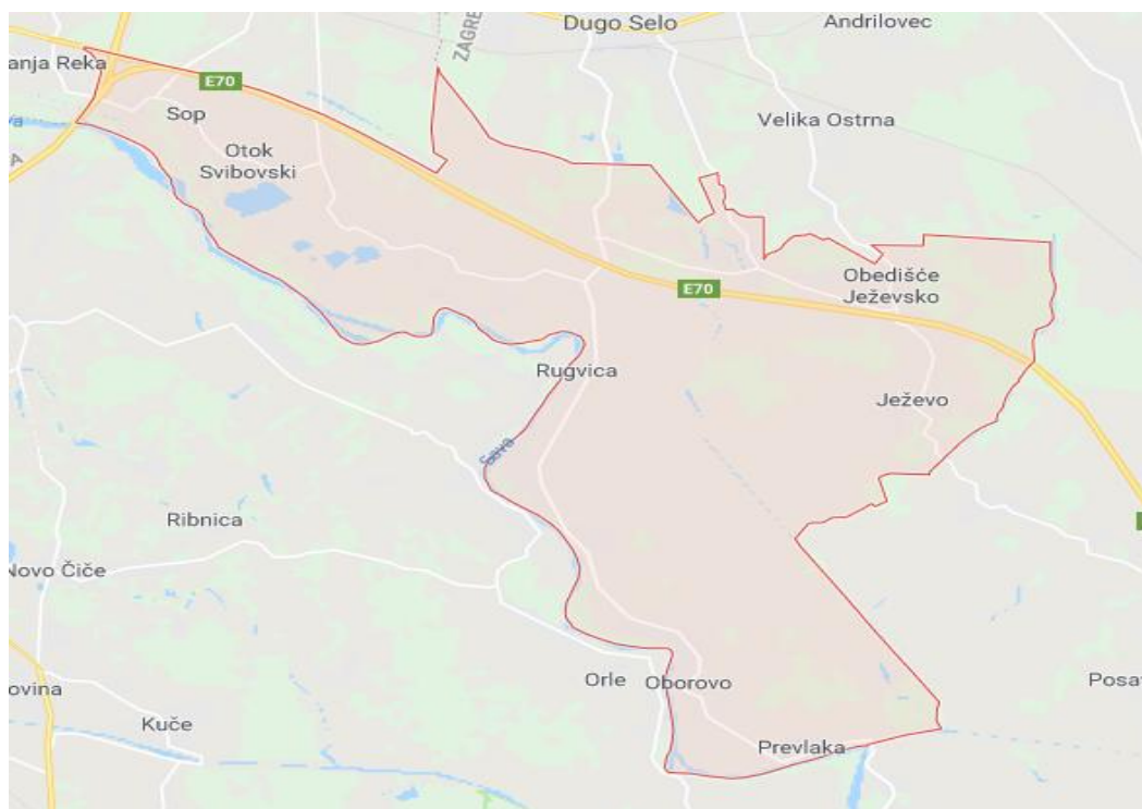
Slika 5. Općina Rugvica

Općina Rugvica je nastala 1993. godine, odvajanjem od općine Dugo Selo (< http://www.rugvica.hr/ >). Čine je 23 naselja koja graniče sa Zagrebom na sjeveru, Dugim Selom na istoku, Ivanić Gradom na jugu i na zapadu s općinom Orle i Velikom Goricom (Kirin 2016.).