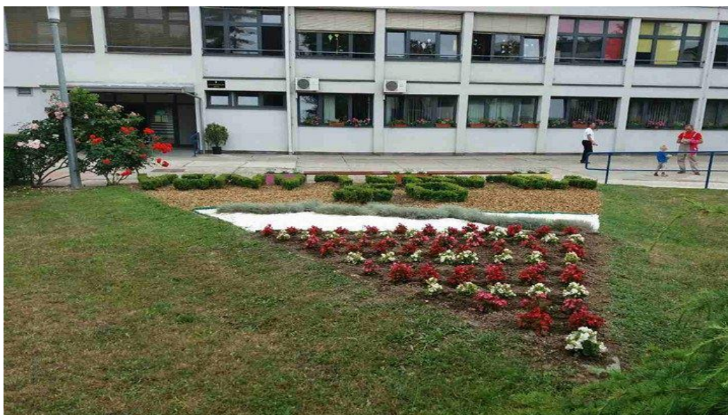
Slika 3. Najljepši školski vrt 2017.; OŠ Milana Langa Bregana

Godine 2017. OŠ Milana Langa iz Bregane je odnijela titulu najljepšeg školskog vrta, a detalj vrta je vidljiv na Slici 3.