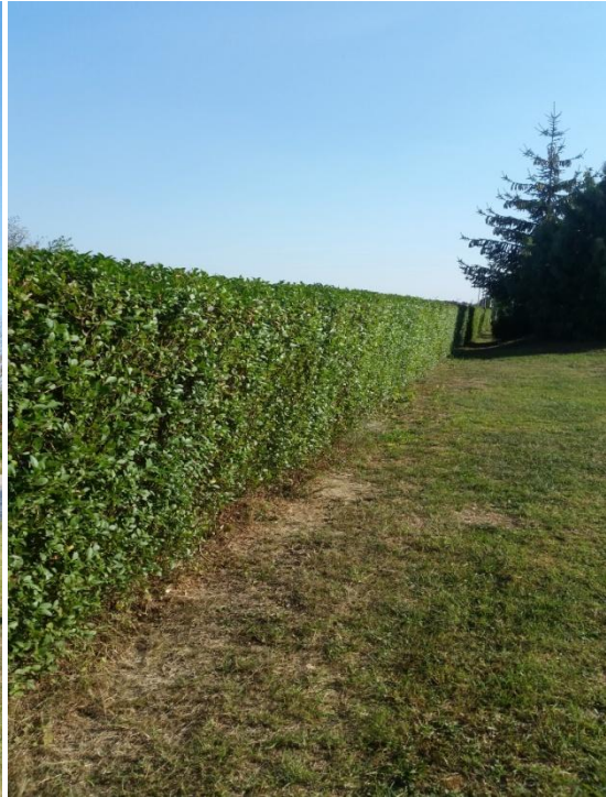
Slika 9. Ligustrum vulgare L.