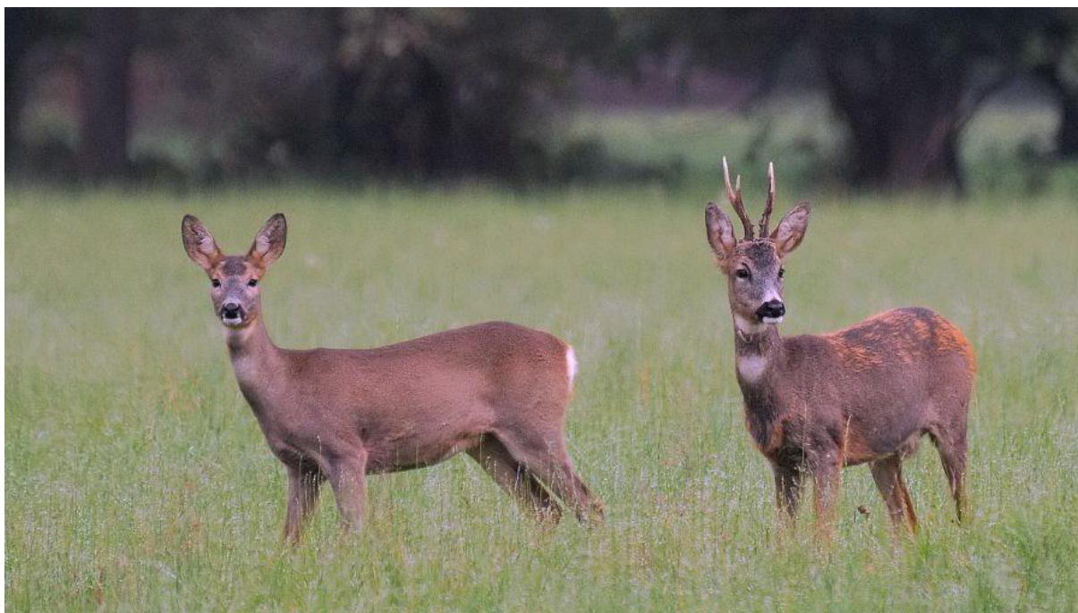
Slika 4.4.1. Ženka i mužjak srne obične