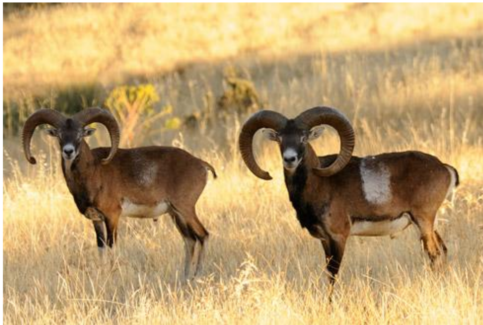
Slika 4.6.1. Mužjaci muflona

Budući da lovački trofej predstavlja najskuplji, ali i najatraktivniji derivat divlje životinje, razumljivo je kako su u većini europskih lovišta u kojima se gospodari muflonom provedena detaljna istraživanja o morfologiji rogova kako bi se selekcionirala što kvalitetnija trofejna grla (Krapinec i sur. 2006.), što daje mogućnost veće ponude trofejnih grla na lovno-turističkom tržištu.