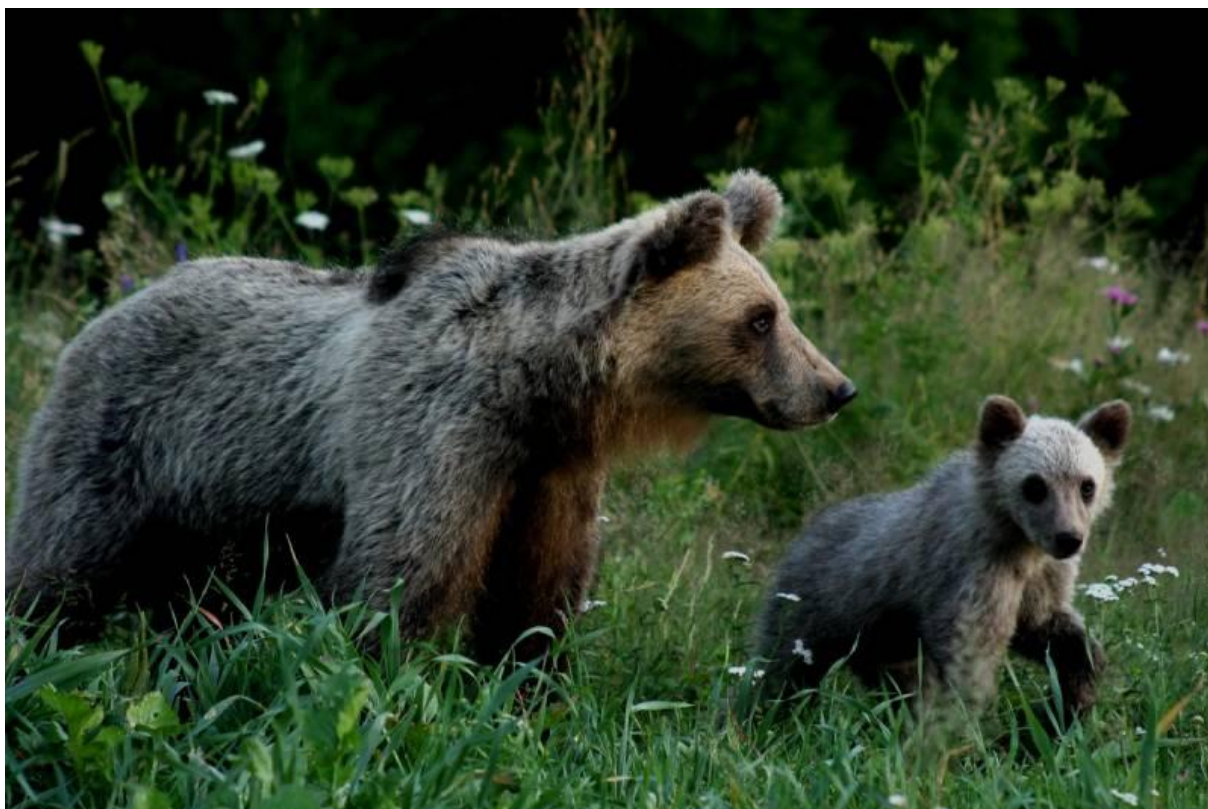
Slika 4.8.2. Ženka i mladunče smeđeg medvjeda

Izvor: http://www.lovac.info/lov-divljac-hrvatska/divljac-lov-zivotinja-divljaci/3884-smedi-medvjed-ursus-arctos-engl-brown-bear.html Pristupljeno 23.08.2018.