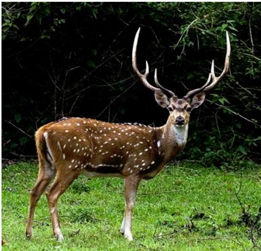
Slika 4.3.1. Mužjak jelena aksisa

Posljednji jelen iz porodice pravih jelena ( Plesiometacarpalia ) koji obitavaju na području Hrvatske je jelen aksis. Prvo pojavljivanje bilježi 1911. godine na Brijunima gdje je introducirano iz Njemačke (Šprem i sur. 2008.). Sa Brijuna se usporedo s velikom akcijom introdukcije ove tropske divljači u više kontinentalnih lovišta Hrvatske (Macelj, Posavlje, Zelendvor, Božjakovina, Zlatar, Sljeme) tijekom ožujka 1953. godine u organizaciji Šumskog gospodarstva "Viševica" Rijeka izvršio unos jelena aksisa na dvije lokacije otoka Cres. U mjesto Tramontana na sjeveru otoka (4 jelena i 8 košuta) i Punta Križa na zapadu (4 jelena i 7 košuta). Zatim na otok Plavnik (4 jelena i 6 košuta) i u Bribirsku šumu iznad Crikvenice (2 jelena i 7 košuta). Ukupno 14 jelena i 28 košuta (Frković 2014.).