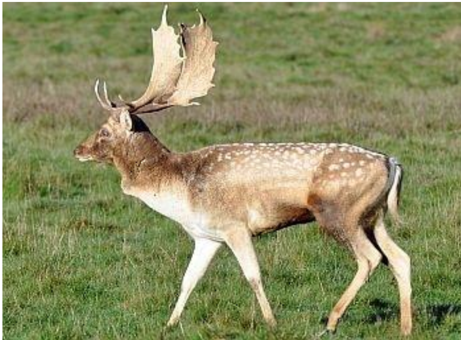
Slika 4.2.1. Mužjak jelena lopatara

Današnja populacija obitava na Brijunima gdje je unešen 1911. (Reindl i sur. 2011.). Prisutan je na području Kunjevaca, Đakova, Hrvatske Dubice, Iloka, Kutjeva i Krndije, a otočke populacije obitavaju na Rabu, Lošinju i Cresu gdje su 2 jelena i 4 košute introducirani 1966. (Frković 2014.).