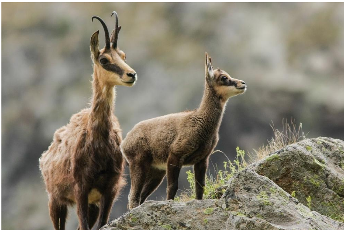
Slika 4.5.1. Ženka i jare divokoze

Izvor: http://www.lovac.info/media/k2/items/cache/27b4dac4cac8bcf3255136d4db9d8a57_XL.jpg Pristupljeno 20.08.2018.