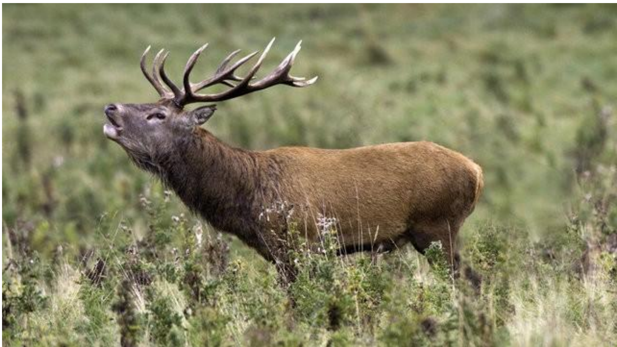
Slika 4.1.1. Mužjak jelena običnog.

Rasprostranjen je po većim šumskim kompleksima uz vodotoke Save, Drave i Dunava odnosno po regijama Slavonije, Baranje i Podravine. Na tim područjima obitavaju jeleni veće biomase i jačih trofejnih vrijednosti. Za jelene koji naseljavaju Gorski kotar, Učku, Ćićariju, Risnjak, Kalnik i Žumberak se ustalio naziv „kraški jelen“.