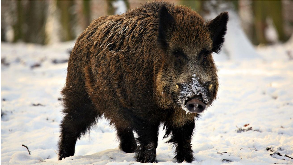
Slika 4.7.1. Mužjak svinje divlje