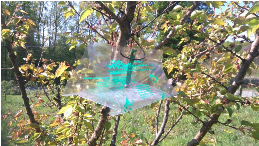
Slika 6. Csalomon feromonska lovka

Istraživanje je provedeno na pokušalištu Jazbina Agronomskog fakulteta Sveučilišta u Zagrebu tijekom 2017. godine. Praćenje leta leptira breskvinog i šljivinog savijača provedeno je u nasadu šljive i marelice. U praćenju su korištene feromonske lovke mađarske tvrtke Csalomon (Slika 6). Feromonske lovke su postavljene 3. travnja. Feromonska lovka za šljivinog savijača postavljena je u voćnjak šljive, a za breskvinog savijača na marelicu u blizini šljive. Dvije vrste feromona su korištene iz razloga što feromon za breskvinog savijača privlači i šljivinog savijača. Korištena su dva feromona iz razloga da se uspoređi atraktivnost feromona za breskvinog savijača na šljivinog savijača. Od postavljanja feromonskih lovki do kraja pregleda lovki 9. kolovoza 2017. obavljeno je 18 očitavanja. Feromonske lovke su se mijenjale svakih 30 dana, a ljepljivi podlošci svakih 7 do 10 dana (Slika 7).