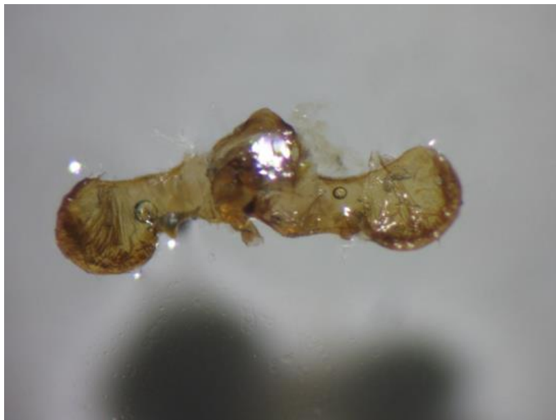
Slika 9. Spolni organ šljivinog savijača