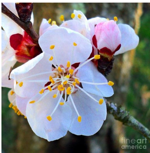
Slika 2. Cvijet marelice