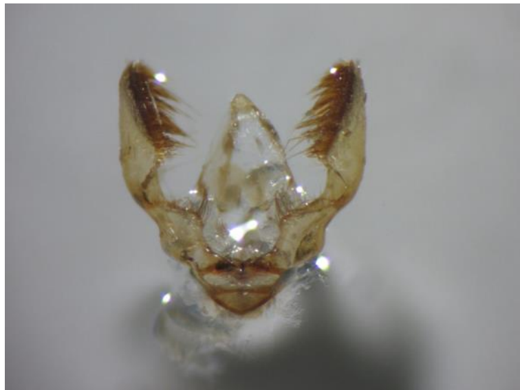
Slika 8. Spolni organ breskvinog savijača

Testisi (Slika 8) su izduženi sa mnogobrojnim dlakama. Testisi šljivinog savijača (Slika 9) su oblika „lopate“ sa karakterističnim roščićem na bazi.