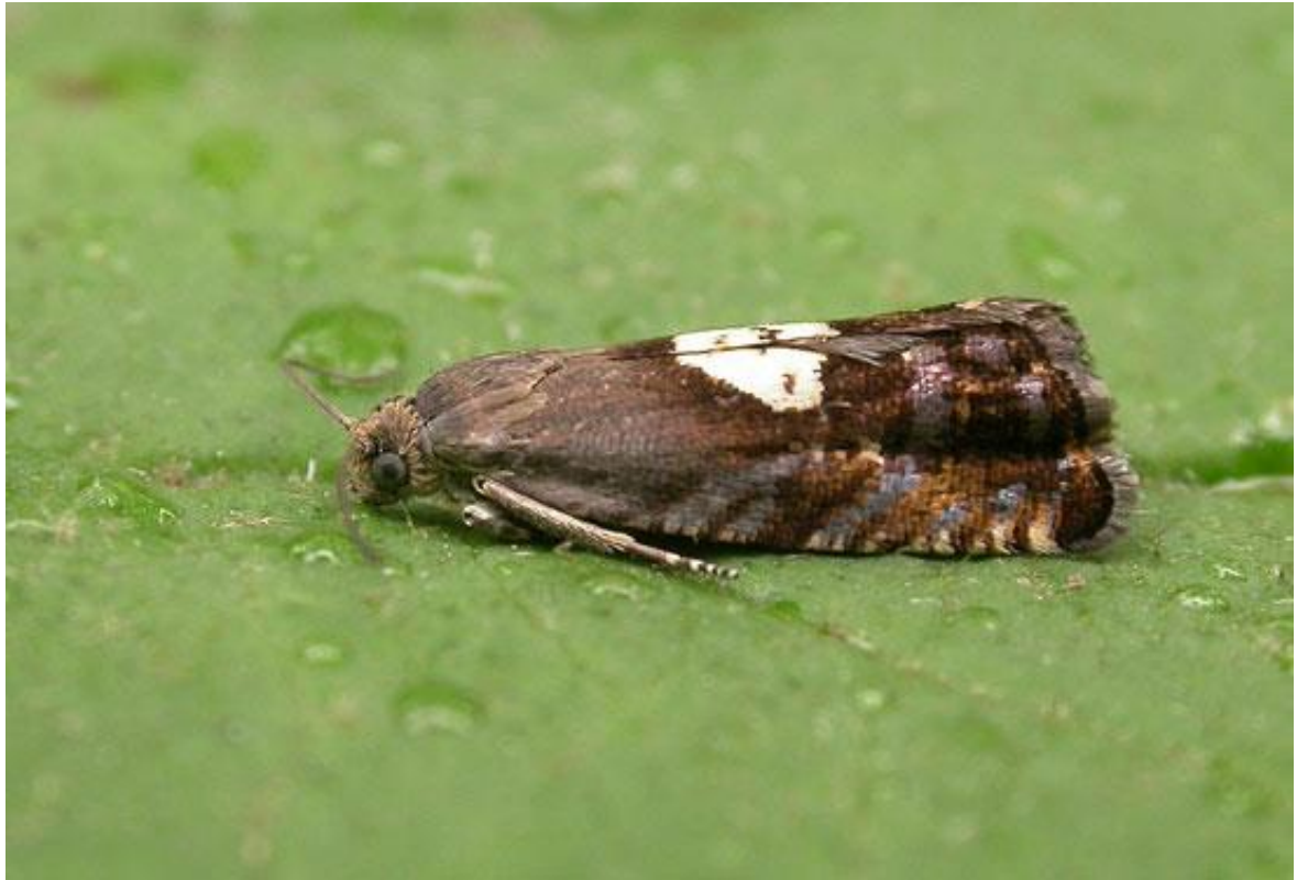
Slika 10. Pammene populana

Na feromonskim lovkama koje su karakteristične za šljivinog savijača, lovili su se i leptiri Pammene spp. Ulov ove vrste pokazuje da feromon za šljivinog savijača nije potpuno selektivan što i proizvođač feromona navodi, posebice ako se voćnjak nalazi blizu šume.