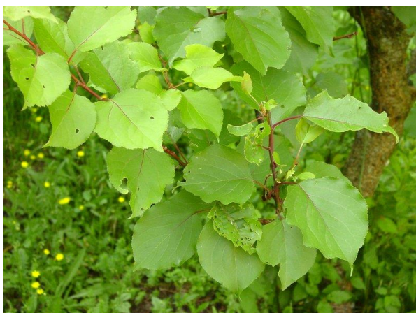
Slika 1. List marelice