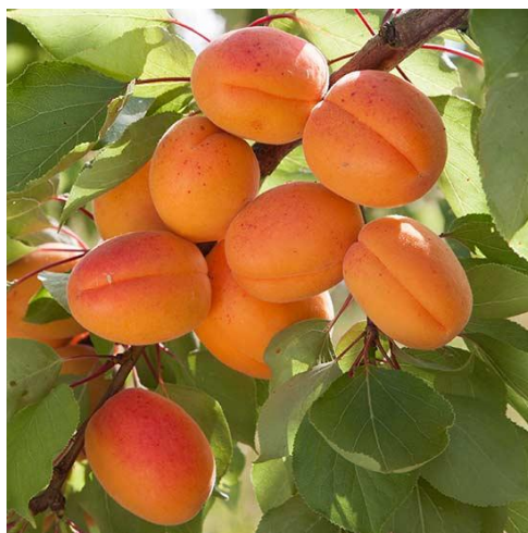
Slika 3. Plod marelice