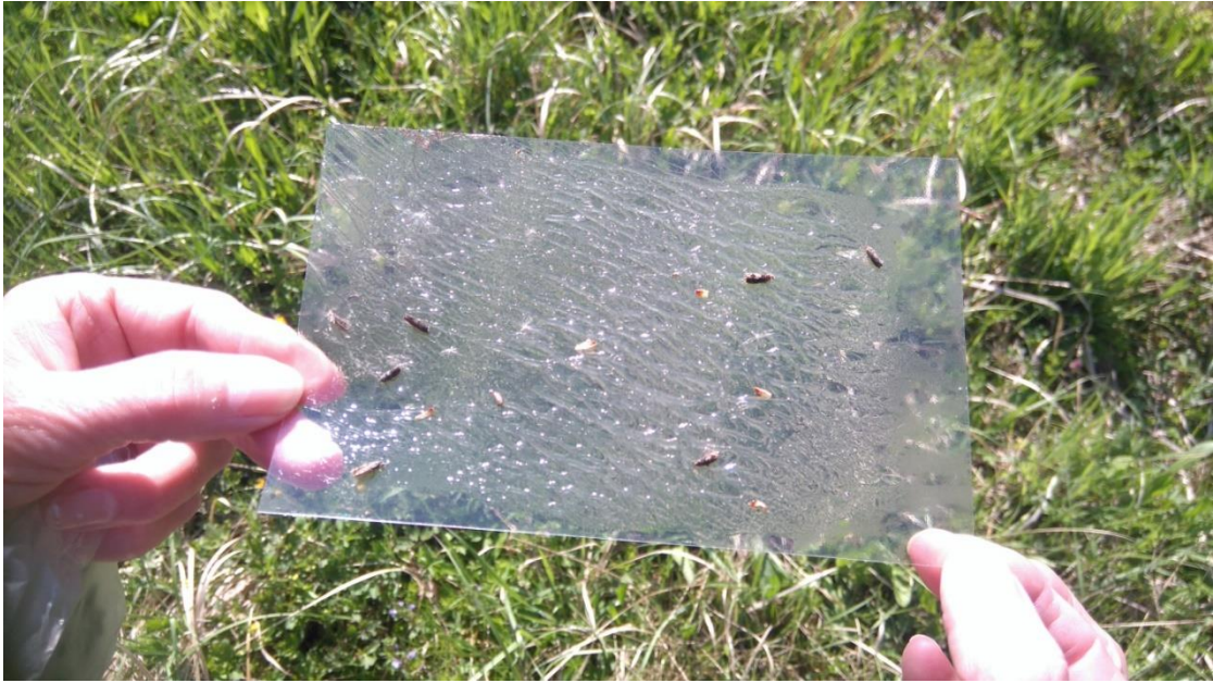
Slika 7. Ulov leptira na feromonskoj lovci