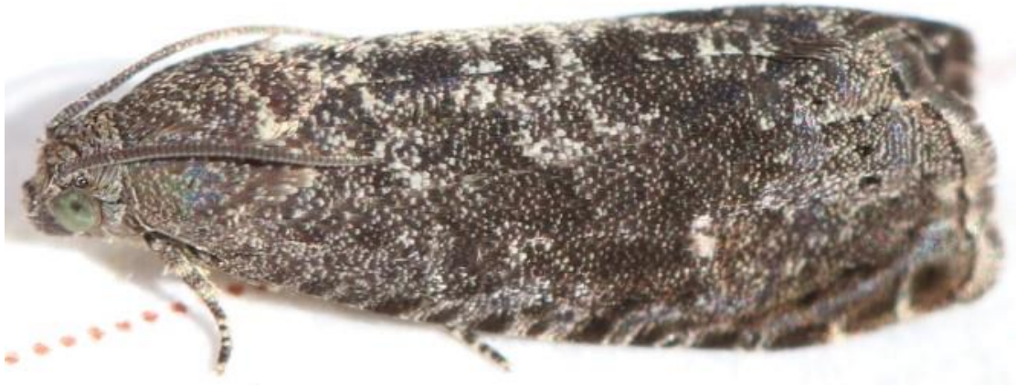
Slika 4. Breskvin savijač

Breskvin savijač ( Grapholita molesta Busck, 1916.) je tehnološki štetnik što podrazumijeva da najveće štete pričinjava plodu. Osim ploda, napada izbojke.