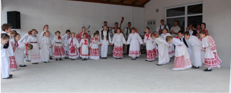
Slika 1. Kulturno-umjetničko društvo, “Frankopan”

U Dubravi djeluje samo jedno kulturno-umjetničko društvo, “Frankopan”. Okuplja mlade i njeguje tradiciju plesova i pjesama svojeg zavičaja, ali i cijele sjeverozapadne i istočne Hrvatske.