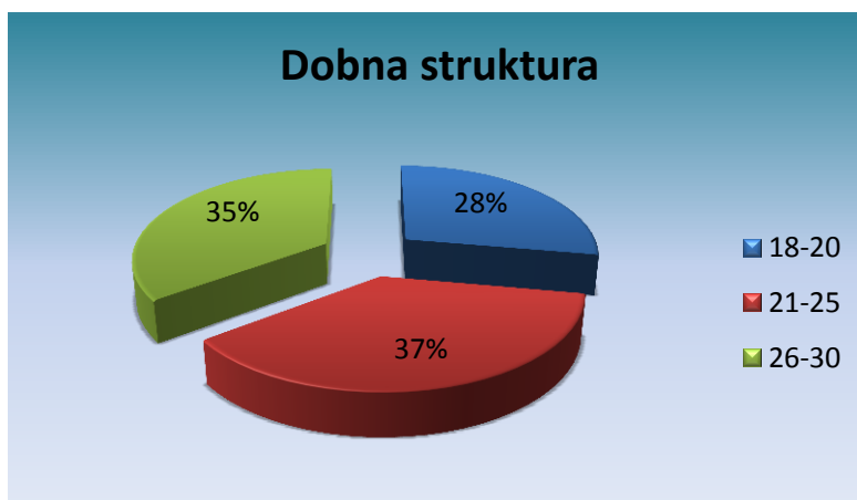
Grafikon 1. Dobna struktura ispitanika

U provedenom istraživanju na uzorku od 54 osobe zastupljene su sve dobne skupine mladih od 18 do 30 godina. Prema dobnoj strukturi najviše je ispitanika koji imaju između 21 i 25 godina (37 %).