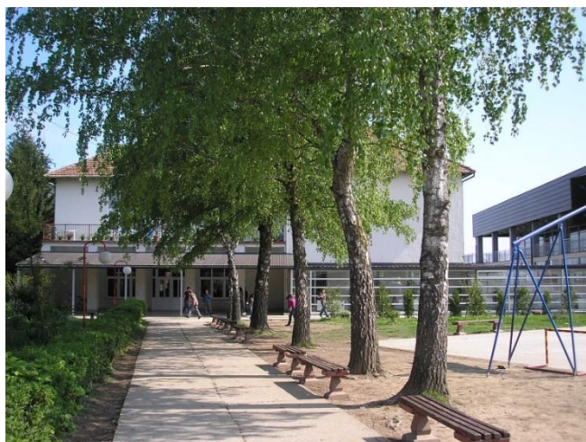
Slika 2. Osnovna škola Dubrava

Na području općine nalaze se dječji vrtić u Dubravi te osnovna škola sa područnim školama u Kapeli, Bolču i Farkaševcu. Područna škola u Kapeli ima organiziranu nastavu do četvrtog razreda osnovne škole nakon čega se djeca šalju u Dubravu u školu, a područna škola u Bolču nakon četvrtog razreda djecu šalje u Farkaševac gdje je organizirana nastava do osmog razreda osnovne škole.