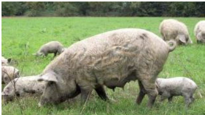
Slika 2.1. Krmača turopoljske svinje

Turopoljska svinja pripada skupini srednje velikih pasmina. Njen trup je srednje dužine, plići i uži. Koža je bijele boje, a prekrivena je bijelo-sivo-žutom, kovrčavom dlakom sa 5 do 7 crnih piknji, veličine dlana. Slika 2.1. prikazuje vanjski izgled krmača turopoljske svinje. U prošlosti su postojala dva tipa turopoljske svinje, tip sa kovrčavom dlakom i tip sa glatkom dlakom. Glava turopoljske svinje srednje je duga sa blago uleknutim profilom na kojoj su smještene srednje duge i poluklopave uši. Rilo je srednje dugo te jako, ružičaste boje sa nekoliko modrih piknji. Ima slabo mišićav i kratak vrat, dok je mišićje zatiljka dobro razvijeno. Leđa su ravna i slabo mišićava, te široka i duga. Sapi i butovi su također slabo mišićavi, a trbušna linija je ravna. Rep je dugačak, a na njegovom kraju nalazi se čuperak. Njene noge su čvrste, umjereno duge te tanke, a papci su žućkasti do tamno pigmentirani. Turopoljska svinja ima 10 do 12 sisa. Težina odraslih krmača iznosi oko 240 kg, dok nerastovi teže oko 250 kg (Barać i sur. 2011.).