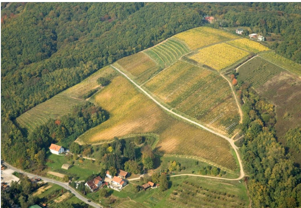
Slika 2. Pokušalište Jazbina

Pokusni vinograd nalazi se u Jazbini, gdje je jedno od pokušališta Agronomskog fakulteta u Zagrebu. Pokušalište Jazbina namijenjeno je nastavnom i znanstvenom istraživačkom radu iz područja vinogradarstva i vinarstva. Smješteno je u kontinentalnoj Hrvatskoj, u podregiji Prigorje-Bilogora, na južnim padinama Medvednice, točnije na brijegu Biskupov čret. Pod utjecajem je umjerene kontinentalne klime koju karakteriziraju oštre zime te topla i vlažna ljeta.