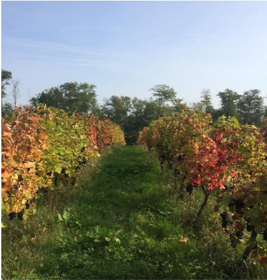
Slika 5. Mikorizirani redovi u pokusnom vinogradu

najbolje od njih uvrstilo u komercijalnu proizvodnju i široku upotrebu. Naveden preparat je apliciran direktno u zonu korijena pomoću ručnog zemljišnog injektora.