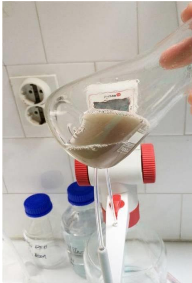
Slika 7. Direktna titracija

Postupak je takav da se 10 ml uzorka otpipetira u laboratorijsku čašu te se dodaju 2 – 3 kapi indikatora bromtimol plavog. Titracija se provodi sa 0.1 M NaOH do pojave maslinasto zelene boje.