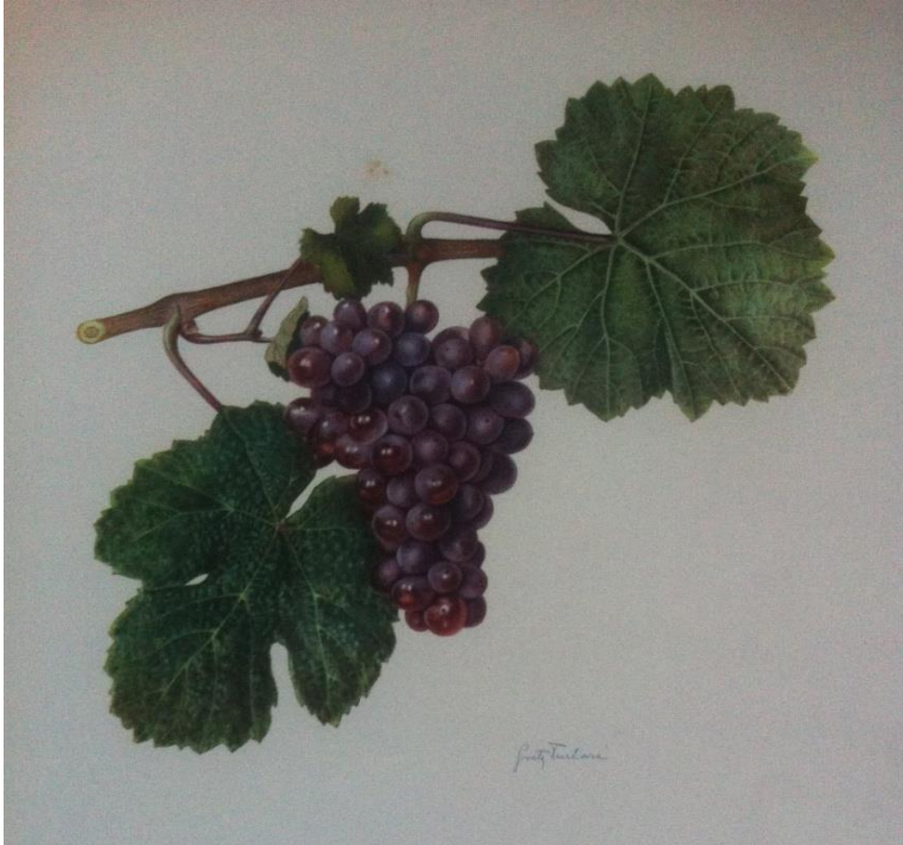
Slika 4. Traminac crveni

Kontinentalna je sorta, raširena uglavnom u područjima sa hladnijom klimom: Francuska, sjeverna Italija, Njemačka, Austrija... Uspijeva i u područjima umjerene klime, npr. u nekim dijelovima Kalifornije, Mađarskoj, Rumunjskoj, Bugarskoj, Srbiji, Makedoniji... U Hrvatskoj je preporučena sorta u svim vinogorjima regije Kontinentalna Hrvatska.