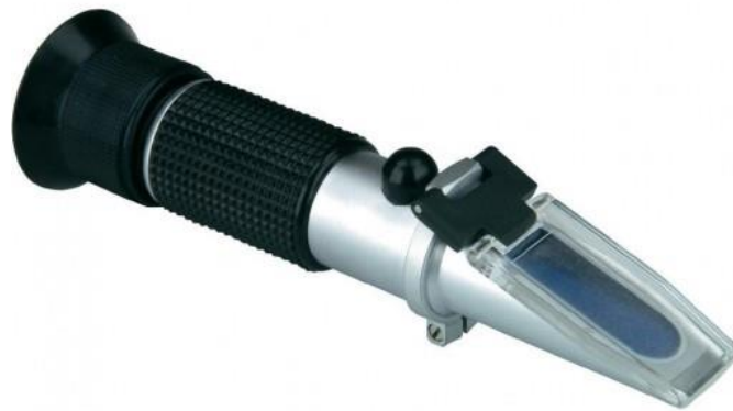
Slika 6. Refraktometar

Sadržaj šećera u moštu se može odrediti kemijskim i/ili fizikalnim metodama. Kemijske su metode kompleksnije i preciznije, a baziraju se na kemijskim reakcijama šećera s odgovarajućim reagensima. Najpoznatija kemijska metoda određivanja sadržaja šećera je Rebelein metoda. S druge strane, fizikalne metode su brže i jednostavnije. Manja im je točnost nego kemijskim metodama, no u praksi daju zadovoljavajuće rezultate pa se često koriste. Za određivanje sadržaja šećera fizikalnim metodama, koriste se uređaji areometar ili moštna vaga te optički uređaj – refraktometar.