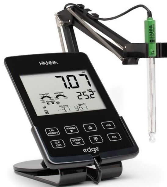
Slika 8. pH-metar

pH vrijednost mošta i vina se kreće između 2.8 – 4.0. pH vrijednost utječe na niz biokemijskih i fizikalno-kemijskih procesa tijekom dozrijevanja i starenja vina. Vina koja imaju nižu pH vrijednost su pogodnija za čuvanje budući da se u njima teže razmnožavaju nepoželjni mikroorganizmi. pH vrijednost mošta i vina određuje se uređajem koji se naziva pH-metar.