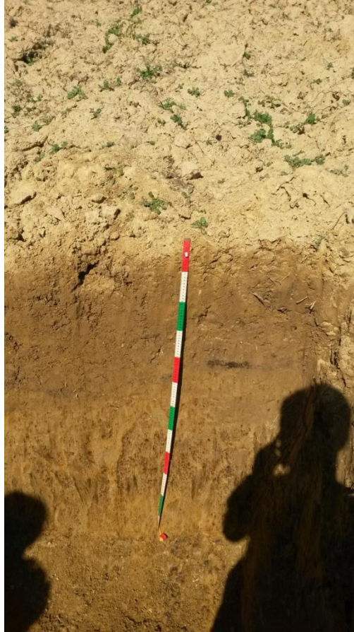
Slika 3. Pedološki profil tla u Jazbini

nepovoljnih fizikalnih i kemijskih svojstava. U manjoj mjeri prisutna je ilovača, dok pijeska i skeleta gotovo da nema. Reakcija tla je vrlo kisela što dokazuje niska pH vrijednost koja se kreće od 3.8 do 4.1 (Škorić, 1957). Tlo je siromašno humusom, opskrbljenost dušikom je umjerena, dok su kalij i fosfor u deficitu.