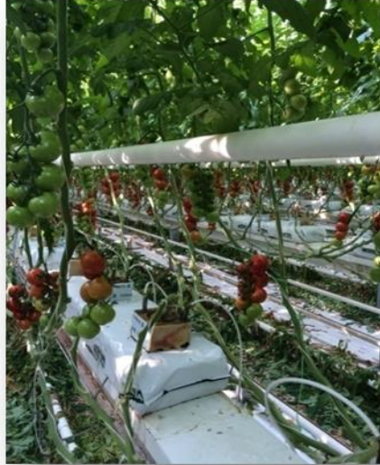
Slika 2. Stimulativna cijev za grijanje ( Ivanković, 2015. )