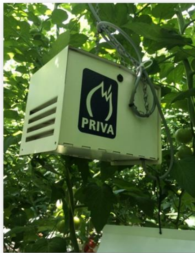
Slika 5. Instrument za mjerenje temperature (termometar) i relativne vlažnosti zraka (higrometar) (Ivanković, 2015.)

Obogaćivanje atmosfere zaštićenog prostora ugljičnim dioksidom je uobičajena mjera u svrhu povećanja prinosa. Sustav za distribuciju ugljičnog dioksida treba biti dobro projektiran kako bi se izbjegle uobičajena horizontalna (od ruba prema sredini zaštićenog prostora) i vertikalna (od poda (biljke) prema krovu zaštićenog prostora) variranja koncentracije (Bakker i sur., 1995).