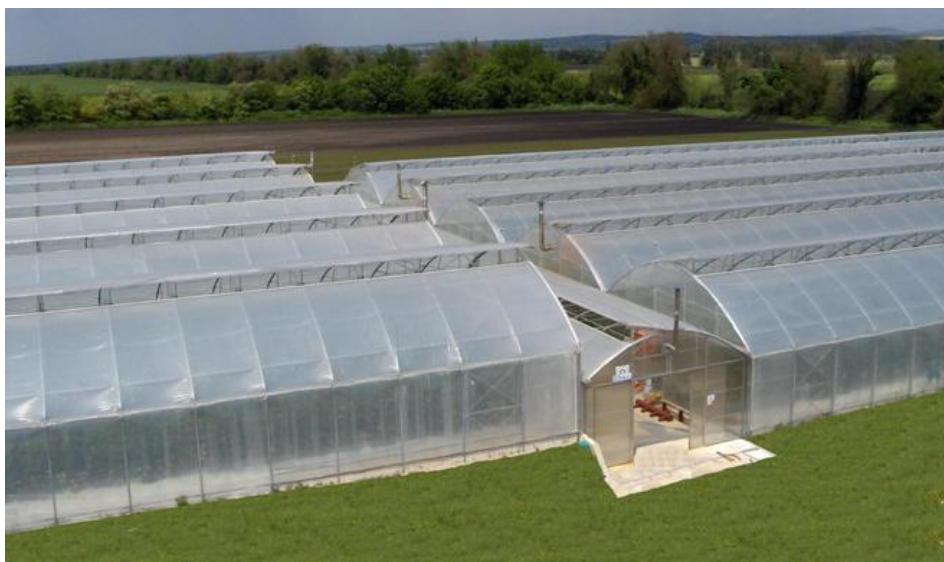
Slika 1. Izgled suvremenog plastenika