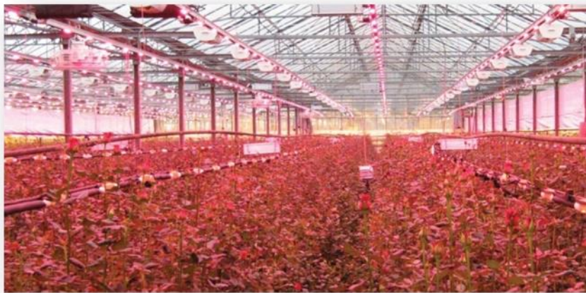
Slika 4. LED (Light Emitting Diode – svjetleća dioda) rasvjeta u stakleniku

Kako bi se povećala produktivnost plastenika, u uvjetima slabog osvjetljenja treba koristiti dopunsko osvjetljenje jednakih valnih duljina kao Sunčevo zračenje. U posljednje vrijeme kao najpovoljnije rješenje koristi se LED (Light Emitting Diode – svjetleća dioda) rasvjeta iz razloga što je jednostavna za korištenje, ima dugi životni vijek, učinkovita je i mogu se koristiti samo potrebni spektri. Za biljke to su upravo crveni i plavi spektar (slika 4). Crveni spektar je najpovoljniji za obavljanje procesa fotosinteze ( http://www.ledgpi.com ).