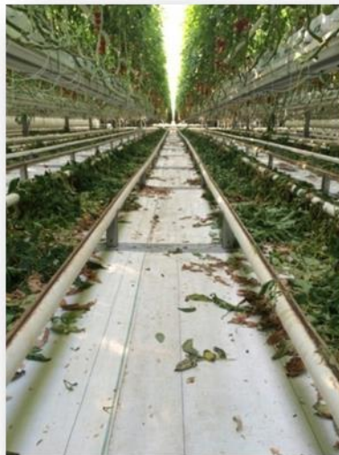
Slika 3. Podna cijev za grijanje ( Ivanković, 2015. )

Pored zagrijavanja zaštićenih prostora, sustav za reguliranje potrebne klime je ventilacija, sustav sjenila, kao i hlađenje prolaskom vode kroz sačasti izmjenjivač topline (adijabatsko hlađenje). Najekonomičniji način ventilacije plastenika je postavljanjem krovne ili bočne ventilacije čija regulacija može biti ručna, automatska i poluautomatska (Parađiković i Kraljičak, 2008). Ventilacija (provjetravanje) je uobičajena metoda snižavanja temperature zraka. Uzduž bočnih stranica i krovnih površina plastenika postoje otvori čijim otvaranjem unutarnji topliji zrak izlazi van, a na njegovo mjesto dolazi vanjski hladniji zrak.