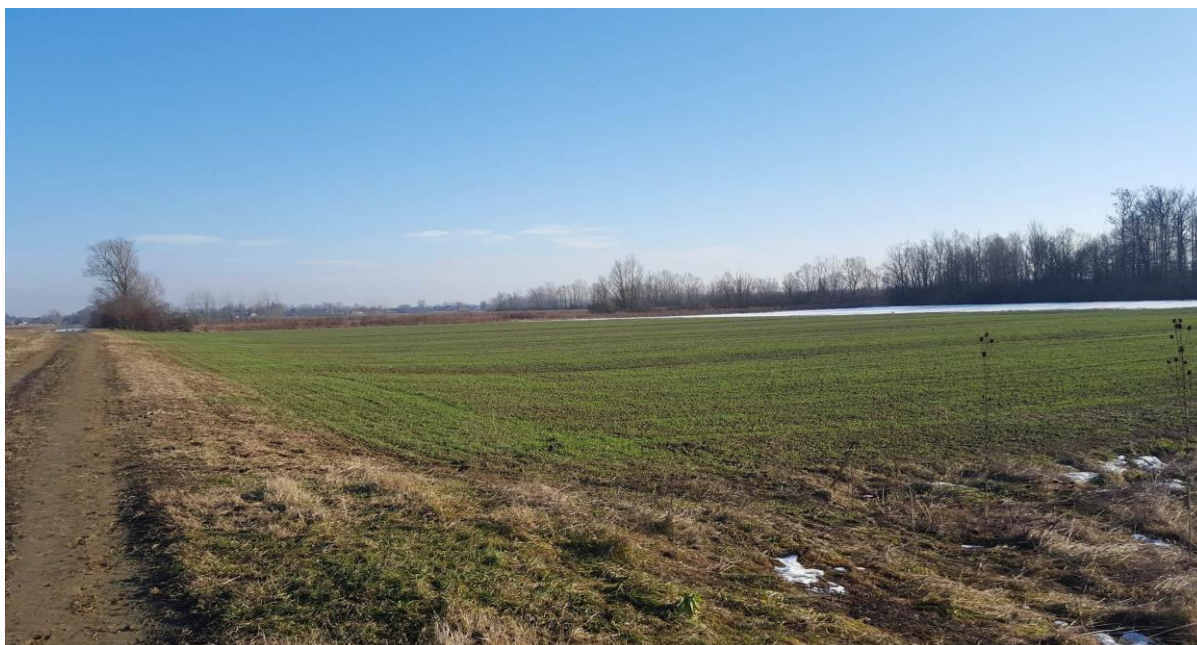
Slika 8. Lokacija u Posavskim Bregima ( Horvat, 2015. )

Istraživanje je provedeno u tvrtki EUROLAP HORVAT d.o.o. iz Zagreba koja se bavi uzgojem ovaca i povrća na površini od 4,5 hektara. U periodu od listopada 2014. godine do veljače 2016. godine tvrtka je radila na pripremi projekta „Izgradnja i opremanje plastenika za hidroponski uzgoj rajčice“. U sklopu istraživanja praćena je priprema i provedba projekta koja se sastojala od izbora lokacije za plastenik (slika 8), vještačenja zemljišta, pripreme geodetskih podloga za glavni geodetski projekt, arhitektonskih rješenja na temelju kojih se izradio arhitektonski projekt, građevinski projekt statičkog proračuna, građevinski projekt vodoopskrbe i odvodnje, elektrotehnički projekt, strojarski projekt i tehnološki projekt. Za sve projekte su prikupljeni posebni uvjeti gradnje i opremanja kako bi se omogućilo dobivanje svih potvrda glavnog projekta od strane državnih i privatnih dionika projekta. Uz potvrde i glavni projekt na zahtjev upravnog odjela za prostorno uređenje, gradnju i zaštitu okoliša trebalo je izraditi elaborat alternativnih sustava opskrbe energijom, geotehnički elaborat i elaborat zaštite od požara te nadopuniti projektну dokumentaciju sa izjavom projektanta o usklađenosti glavnog projekta sa prostornim planom, izvješćem o kontroli glavnog projekta i nostrifikacijom projektne dokumentacije.