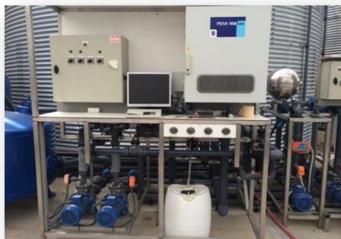
Slika 7. Upravljačka jedinica (Ivanković, 2015.)