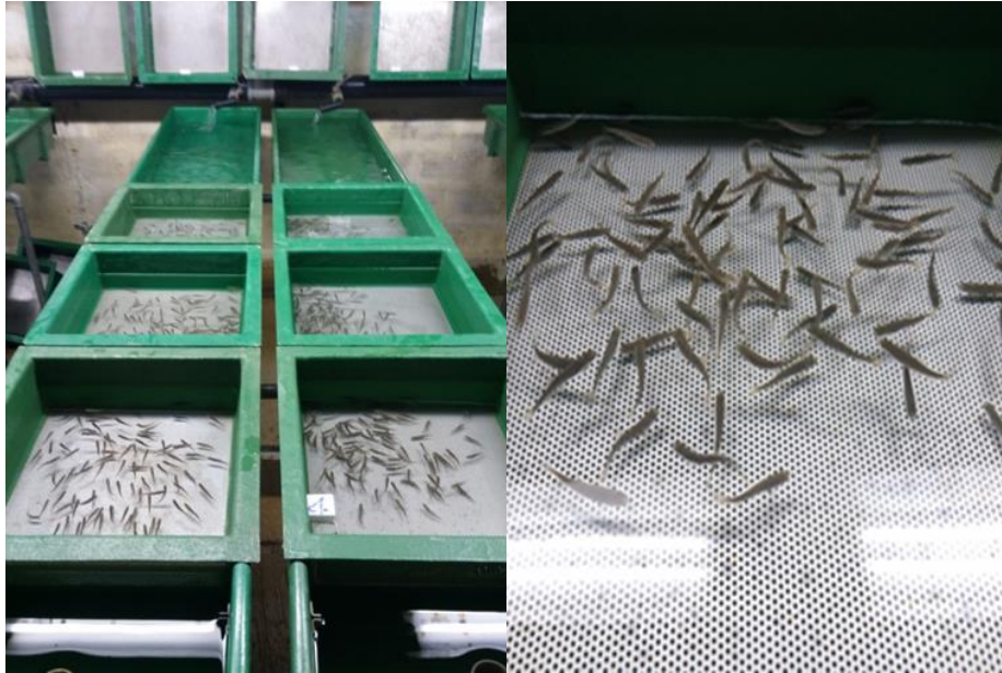
Slika 5: Mladunci stari približno mjesec dana

16.5. provedeno je pojedinačno vaganje po 20 komada nasumično odabranih mladunaca (Slika 6) iz svakog bazena (1A 1B 1B 2A 2B 2C), odnosno po 60 jedinki iz prve skupine (1ABC) kada su mladunci bili odvojeni 36 dana nakon početka aktivne faze i 60 jedinki iz druge skupine (2ABC) kada su mladunci bili odvojeni 32 dana nakon početka aktivne faze.