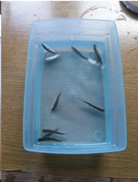
Slika 7: Mladunci pod narkotikom