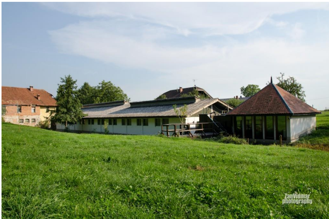
Slika 2: Ribogojnica Pšata

Pokus je provođen u slovenskoj Ribogojnici Pšata (Slika 2), koja je smještena na izvoru potoka Pšata kod Cerklja na Gorenjskem, a nalazi se u sklopu poduzeća Vodomec d.o.o. Dozvoljeno izdvajanje vode iz potoka Pšata je 70 l/s. Namjena ribogojnice je mrijest i uzgoj mlađi i mladunaca kalifornijske pastrve. Ribogoiilište ima odvojene bazene s maticama, prostor za mrijest, Cuger inkubatore, opremljena je sa 120 rotacijskih bazena, 2 betonska i 13 plastičnih bazena. Mrijestilište posluje s kapacitetom od 5 do 6 milijuna jaja godišnje. Ribogojnica Pšata, prva je u Sloveniji 2008. god. stekla status bez bolesti navedene od strane Europske unije. Također se uvozi ikra u razdoblju kada ikre nema dovoljno, ili kod nepovoljnih uvjeta za mrijest. Ribogoiilište je u suradnji s Biotehničkim fakultetom, te se ovdje vrše razni pokusi bitni za ribarstvo, kao i mogućnost odrađivanja prakse i praktičnih radova za studente.