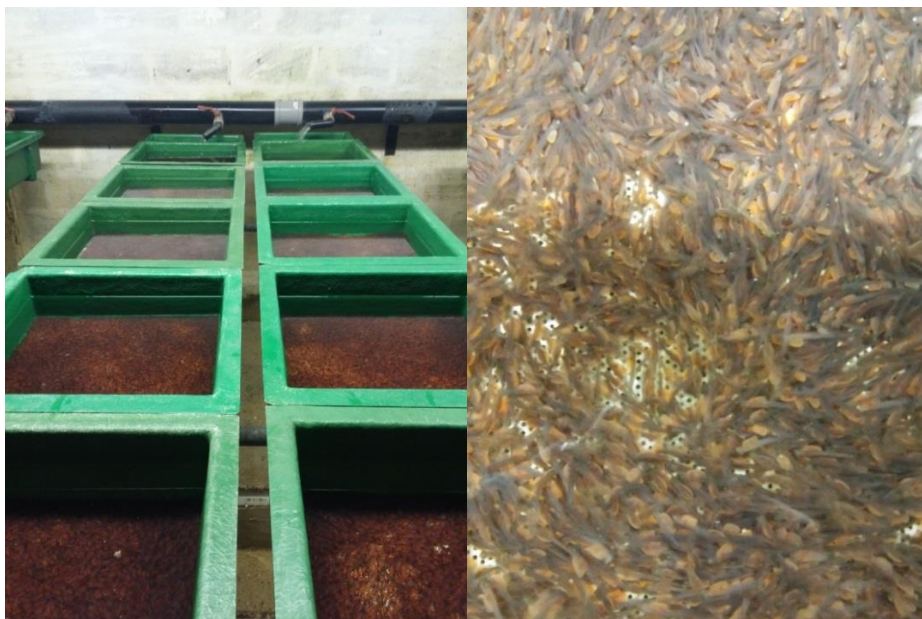
Slika 4: Ličinke u fazi mirovanja

U sljedećoj fazi ličinke (Slika 4) su se hranile preko viterusa, zadržavajući se na dnu ležnice. Prvih nekoliko mladunaca isplivalo je 9.4. te se počelo aktivno hraniti. Već sljedeći dan 10.4. obavljeno je odvajanje mladunaca koji su prvi isplivali, u tri bazena po 100 komada (1A, 1B i 1C). Isto tako zadnji mladunci koji su isplivali 14. 4. odvojeni su također u tri bazena po 100 komada (2A, 2B i 2C). Obje skupine mladunaca držane su u jednakim životnim uvjetima. Hranidba se odvijala ručno Biomar hranom za ribe granulacije 0,5 mm, 5-6 puta na dan ad libitum, kako su ribe rasle, granulacija se povećavala, a smanjivao se broj hranjenja u danu. Provođena je svakodnevna evidencija o broju uginulih ribica.