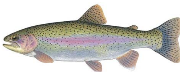
Slika 1: Kalifornijska pastrva ( Oncorhynchus mykiss )