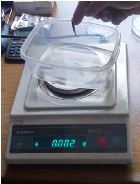
Slika 6: Elektronička vaga