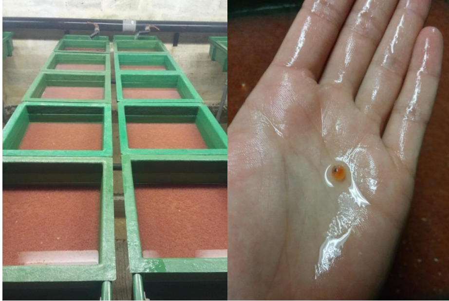
Slika 3: Ikra u fazi očiju

U sljedećoj fazi ličinke (Slika 4) su se hranile preko viterusa, zadržavajući se na dnu ležnice. Prvih nekoliko mladunaca isplivalo je 9.4. te se počelo aktivno hraniti. Već sljedeći dan 10.4. obavljeno je odvajanje mladunaca koji su prvi isplivali, u tri bazena po 100 komada (1A, 1B i 1C). Isto tako zadnji mladunci koji su isplivali 14. 4. odvojeni su također u tri bazena po 100 komada (2A, 2B i 2C). Obje skupine mladunaca držane su u jednakim životnim uvjetima. Hranidba se odvijala ručno Biomar hranom za ribe granulacije 0,5 mm, 5-6 puta na dan ad libitum, kako su ribe rasle, granulacija se povećavala, a smanjivao se broj hranjenja u danu. Provođena je svakodnevna evidencija o broju uginulih ribica.