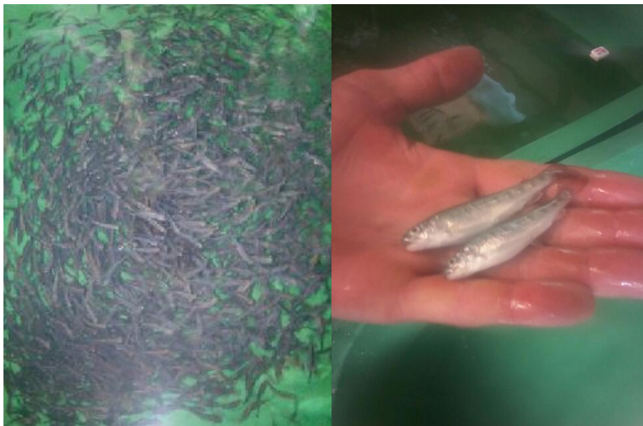
Slika 8: Mladunci stari približno dva mjeseca

Podaci o masi mladunaca unesini su u Excel tablice, te je izračunata prosječna masa jedinki ( \bar{x} ), zatim standardna devijacija (SD), 95% interval pouzdanosti, te maksimalna i minimalna masa jedinke za svaku skupinu. Također izračunata je i specifična stopa rasta za masu (SGRw) za svaku skupinu (1ABC I 2ABC) za četiri mjerenja po formuli: