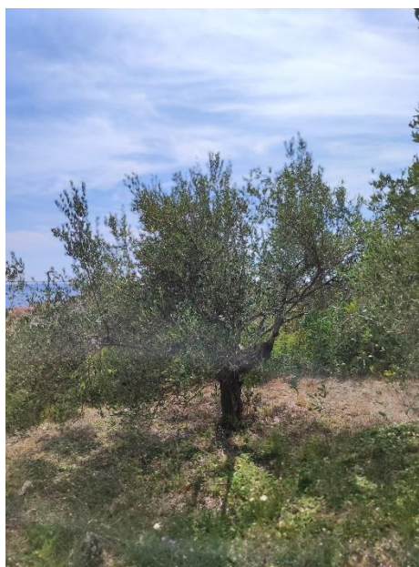
Slika 2.1.1. Stablo masline

Maslina ( Olea Europaea L.) se smatra biljnom kulturom starijom više od 45.000 godina, porijeklom iz područja Mediterana. U Hrvatskoj je poznata više od 2.500 godina. Jedna je od najčešće spomenutih biljaka u Bibliji te je mnogo puta opjevana i hvaljena kao hraniteljica ljudi Sredozemlja. Svoje porijeklo maslina vuče sa Bliskog istoka odakle se proširila u sve mediteranske zemlje. Danas se na tom području ostvaruje čak 98% svjetske proizvodnje, a Hrvatska sudjeluje s 0.2 % čime ne utječe bitno na svjetsko tržište (Mesić i sur., 2015.). Prema Homeru, osnivač Atene – Kekrops je donio maslinu u staru Grčku odakle se proširila i u Hrvatsku (Jemrić, 2008). Istraživanjima je u rimskoj Saloni pronađen mlin za masline koji potječe iz 1. ili 2. stoljeća poslije Krista, a arheološke iskopine iz starog Rima nalaze se i u Puli, Brijunima, Červaru kod Poreča i na još mnogo lokaliteta. Nadalje, na otoku Ugljanu u mjestu Muline te u pulskom Amfiteatru otkriveni su dijelovi antičke uljarice. O dugoj i očuvanoj tradiciji maslinarstva na hrvatskom svjedoče i stabla maslina stara preko 1.500 godina u Kaštel Štafliću i otočju Brijuni (Miljković i sur., 2011.).