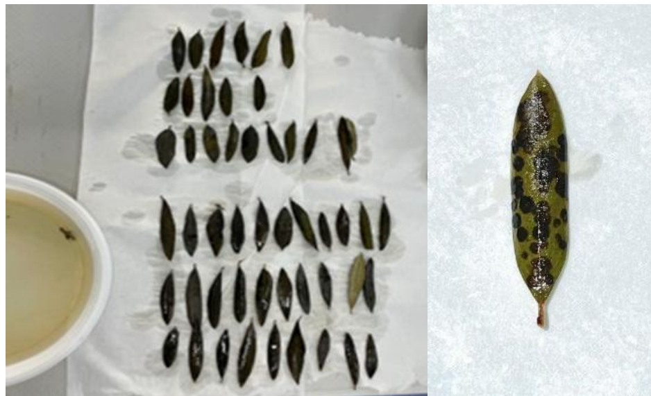
Slika 3.3.2. Sušenje listova do pojave tamnih mrlja