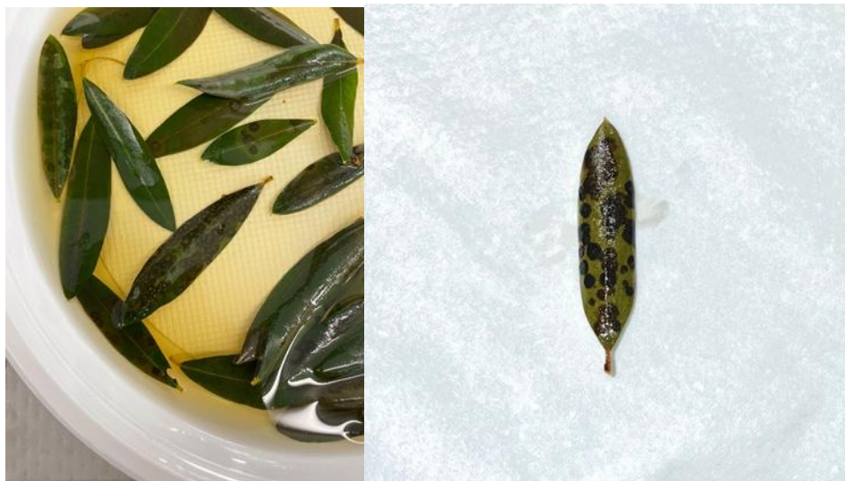
Slika 2.4.1. Pojava simptoma paunovog oka nakon namakanja u 5%-tnoj otopini NaOH

Jedan od načina praćenja je i provjera latentne zaraze natrijevom lužinom (NaOH). Prisustvo zaraze prije pojave vidljivih simptoma može se uočiti i ocijeniti umakanjem listova u 5%-tnu lužnatu otopinu NaOH u razdoblju od 2 do 4 minute nakon čega se pojavljuju simptomi zaraze (Slika 2.).