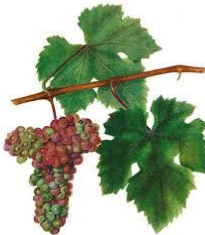
Slika 1. 'Veltlinac crveni'

Vršci mladica i mladi listići bijelo su pahuljasti, malo crvenkasti, brončani. Cvijet je dvospolan. Odrasli list je okruglast, velik, peterodijelan. Sinus peteljke je promjenjivog oblika; gornji postrani sinusi duboku su urezani, na dnu prošireni, preklopljeni; donji postrani sinusi su izraziti, ali manje urezani; lice je golo, a naličje pahuljasto s čekinjastim dlačicama uzduž rebra. Zupci su nejednaki, pilasti, oštri; boja lica tamnozeleno; rebra s obje strane crvena. List je mekan, tanak; peteljka lista dosta duga, čekinjasta, crvenkasta. Zrele bobice su srednje velike, nejednake, svjetlocrvene, u sjeni zelenkaste; potpuno zrele su smečkaste, modrikasto opružene; okruglaste ili malo duguljaste. Kožica je dosta debela; meso sočno; sok sladak, ugodna okusa. Rozgva je duga, sitno prugasta; članci dosta dugi, kora smeđa, na koljencima tamnija, crvenkasta, s brojnim točkama i mrljama. Rast je dosta snažan. Veltlinac crveni traži južne položaje i plodnija tla, inače popušta u razvitku i rodosti, a ne dozrijeva jednolično. Sorta umjerene klime, dozrijeva u trećem razdoblju. Rodnost je obilna i redovita u povoljnim prilikama. Otpornost prema smrzavici je slaba, kao i prema gljivičnim bolestima, a posebno rado trune za kišne jeseni. Vino je dobre ili natprosječne kakvoće; blago, specifičnog mirisa i okusa, srednjih kiselina. U pogledu rodosti i kvalitete bila bi vrlo preporučljiva sorta da nije tako osjetljiva na trulež grožđa (Mirošević, Turković, 2003).