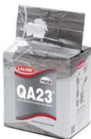
Slika 3. Kontrolni kvasac QA23