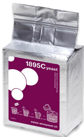
Slika 4. Kvasac 1895C