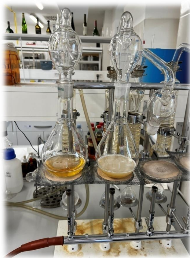
Slika 7. Destilacija vina u Kjeldahovoj tikvici (07.03.2023)