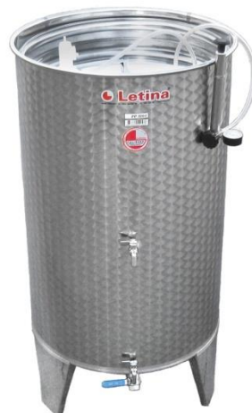
Slika 5. Tank Letina korišten u fermentaciji

Istraživanje je provedeno 2022. godine na sorti grožđa 'Veltlinac crveni', ubranog s položaja Borička u Lokošinom dolu. Grožđe je brano u tehnološkoj zrelosti, ručno, i stavljeno u PVC posude kapaciteta 20 kilograma. Nakon berbe, grožđe je prerađeno u vinariji Braje. Po dolasku u vinariju, grožđe je prošlo kroz procese muljanja i runjenja te je sulfitirano dodatkom kalijevog metabisulfita komercijalnog naziva Vinobran. Nakon prešanja, dobiveni mošt pretočen je u inox cisternu od 300 litara i ostavljen preko noći na taloženju pri temperaturi od 15°C. Nakon taloženja, bistri mošt raspoređen je u dvije cisterne kapaciteta po 150 litara. Koncentraciju šećera u moštu određena je pomoću refraktometra, a ona je nakon taloženja iznosila 85°Oe. Hlađenje oba tanka podešeno je na 18°C. U prvi tank dodan je kvasac QA23, a u drugi kvasac 1895C. U trećini fermentacije, svakom tanku dodana je hrana za kvasac Fermaid E. Kinetika fermentacije praćena je svaki drugi dan pomoću refraktometra.