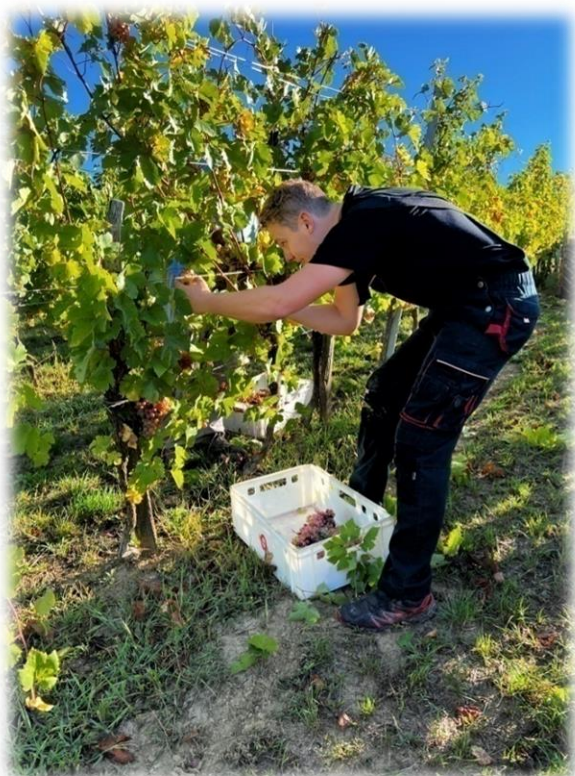
Slika 2. Berba grožđa sorte 'Veltlinac crveni' na položaju Borička

Vinograd je smješten u kontinentalnoj Hrvatskoj, podregiji Plešivica nedaleko od grada Jastrebarskog, u selu Lokošinj dol. Vinograd je zasađen 2002. godine, položaj je jugo-istok. Berba 'Veltlinca crvenog' je bila održana 12. rujna 2022. godine.