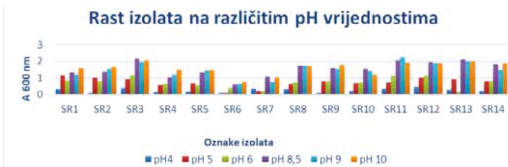
Graf 1. Rezultati spektrofotometrijskog određivanja rasta izolata na različitim pH vrijednostima Graph 1. Results of spectrophotometric determination of isolate growth at different pH values

Optimalna pH vrijednost na kojoj rastu rizobije je 6,8. U cilju procjene rasta i na drugim pH vrijednostima u ovom istraživanju provedeno je ispitivanje sposobnost rasta izolata na šest različitih pH vrijednosti (4, 5, 6, 8,5, 9 i 10). U provedenom istraživanju utvrđena je znatna varijacija u rastu između pojedinih izolata. Najslabiji rast utvrđen je kod pH vrijednosti 4 na kojoj su izolati najslabije rasli. Kao najbolji izolati pokazali su se izolati SR15 i SR16 s područja Koprivničko-križevačke županije (Gola). Pri pH vrijednosti 5 i 6 svi izolati su pokazali dobar rast. Pri pH vrijednosti 8,5, 9 i 10 svi izolati pokazali su jako dobar rast što ukazuje da sojevi toleriraju izrazito alkalnu pH vrijednost sredine. Detaljan pregled rasta svih izolata na različitim pH vrijednostima prikazan je na grafu 1.