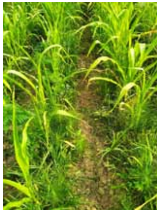
Slika 2. Detalj parcele s mehaničkim suzbijanjem korova samo između redova

Picture 2. Detail of the plot with mechanical weed control only between the rows