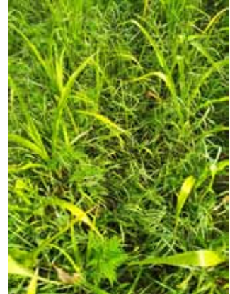
Slika 3. Detalj parcele bez suzbijanja korova

Picture 3. Detail of the plot without weed control