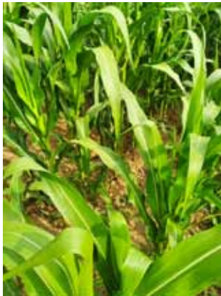
Slika 1. Detalj parcele s mehaničkim suzbijanjem korova između redova i ručnim okopavanjem unutar reda

Masa korova izuzeta s 1 m 2 u pojedinim varijantama suzbijanja prikazana je u tablici 4. Vidljiva je značajna razlika ( p < 0.05 ) u masi korova između pojedinih varijanti suzbijanja korova. Najmanja masa korova očekivano je bila na varijanti 1 kod koje je provedeno mehaničko suzbijanje korova između redova kukuruza motokultivatorom, a unutar redova ručno okopavanje motikom. Na toj varijanti bilo je korova, ali su bili niskog rasta jer su niknuli tek nakon provedenog suzbijanja. Na varijanti 2 kod koje je provedeno mehaničko suzbijanje korova samo između redova kukuruza, korovi unutar reda i uz biljke kukuruza su bili u punom rastu pa je prosječna masa po 1 m 2 bila 223% veća u odnosu na varijantu 1. Na varijanti 3 nije provedeno nikakvo suzbijanje korova, te su oni bili u punom rastu po cijeloj površini parcela, tako da je njihova prosječna masa bila 151% veća u odnosu na varijantu 2, a čak 334% veća u odnosu na varijantu 1. Detalji pojedinih parcela s različitim varijantama suzbijanja korova prikazani su na slikama 1-3.