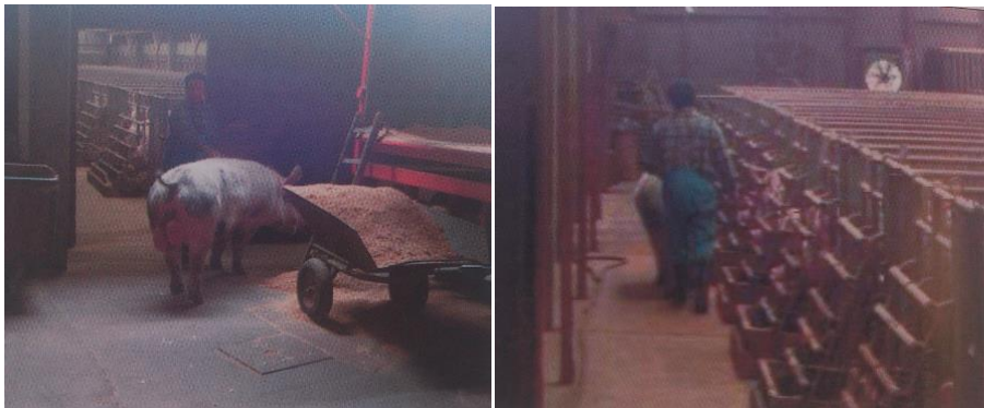
Slika 1. Prolazak nerasta „probača“ u pripustilište

Značajan broj nazimica (posebno u zatvorenom držanju) pokazuju tzv. „tihu“ tjeranje, bez vidljivih simptoma, te im je potrebno stimuliranje da bi pokazale znakove tjeranja i normalno se uključile u rasplod (Senčić i sur., 1990). Jedan od najčešćih načina koji se koriste za otkrivanje krmača s „tihim“ tjeranjem je upotreba tzv. nerasta „probača“. Ovaj način se provodi tako što se nerasti jednom, dva ili tri puta dnevno protjeruju kraj boksa te tako plotkinje, koje su u estrusu, reagiraju specifičnim ponašanjem. Plotkinje postaju nemirne, strižu ušima, podižu rep, približavaju se nerastu, glasaju se i dozvoljavaju zaskakivanje drugih plotkinja.