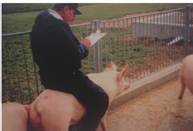
Slika 3. Test jahanja