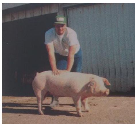
Slika 2. Lumbalni test

Također, treba izbjegavati i zajednički uzgoj nerasta i nazimica jer izaziva privikavanje i slabljenje reakcije nazimice na stimuliranje (Senčić i sur., 1990). Nadalje, plotkinje u tzv. fazi požude, kada im se rukama pritišće lumbalno – sakralno područje, pokazuju slično ponašanje kao i kod upotrebe tzv. nerasta „probača“. Ovaj postupak otkrivanja simptoma estrusa u plotkinja se zove lumbalni test, slika 2. Ako plotkinja dozvoljava da joj se sjedne na leđa (test jahanja) i pri tome miruje (refleks nepokretnosti), radi se o plotkinji u estrusu u fazi požude (Senčić i sur., 1990).