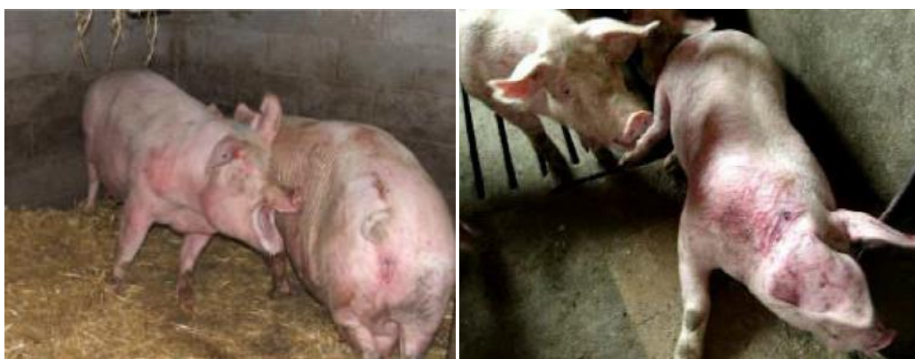
Slika 6. Posljedice agresivnog ponašanja

U većine životinjskih vrsta, pa tako i u svinja, mužjaci su obično agresivniji od ženki i ta agresivnost raste tijekom spolnog razvoja životinje (Senčić i sur., 1996). Također i krmače, u pojedinim situacijama, pokazuju izraženiju agresivnost. Agresivnost krmače se ogleda u njenoj jakoj uznemirenosti, divljanja i želji da tuče, ubije i pojede svoju prasad. Primijećeno je da se ova pojava češće javlja kod predebelih krmača ili nazimica, kod nekih pasmina ili linija. Pojava može biti uzrokovana nervoznom reakcijom krmače na preveliku bol tijekom prasnja ili na neodgovarajuće uvjete u prasilištu (Stančić, 2014).