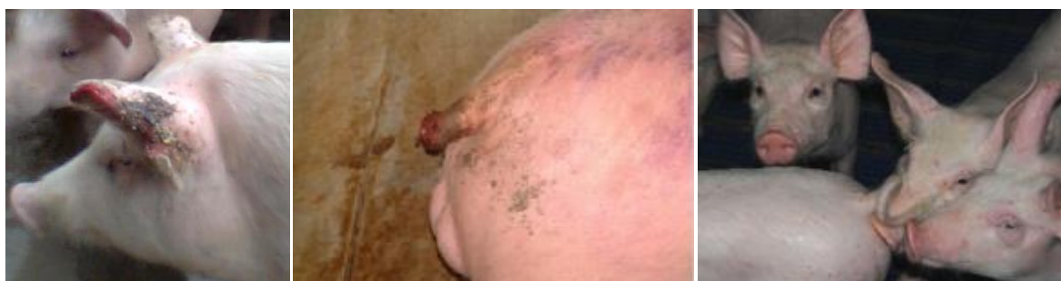
Slika 5. Griža uški i repova kod svinja

Čim se otkrije životinja koja napada, tj. kod koje je izražen kanibalizam, kao i ugrožene, pasivne životinje, potrebno ih je izdvojiti od ostalih svinja u individualne boksove (Stevović i sur., 2015). Ukoliko postoji indikacija, ponajprije treba dati preparate željeza. Stoga ne treba omalovažavati stavove etologa i nutricionista.