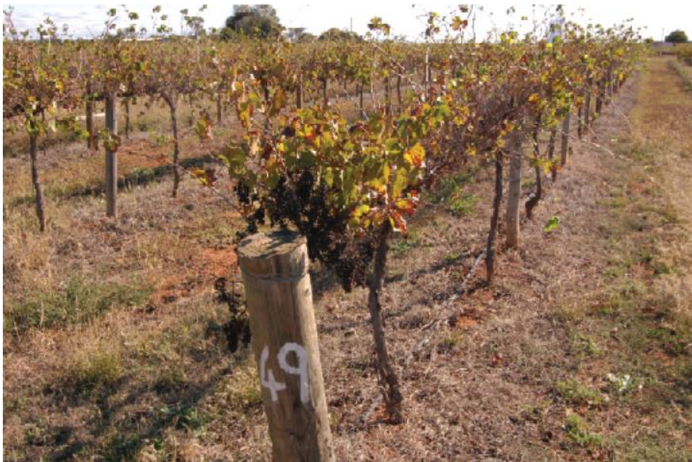
Slika 1. Posljedice suše u vinogradu

Povećana učestalost suša ili nepravilnosti u oborinama mogu smanjiti dostupnost vode za navodnjavanje i rast usjeva.