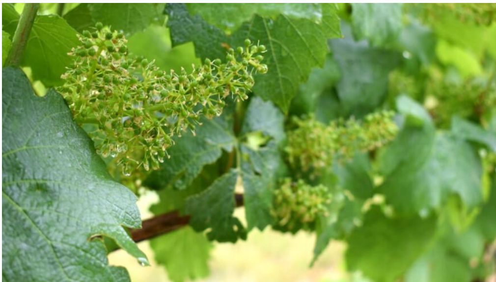
Slika 2. Cvatnja vinove loze

Kada razmatramo fiziologiju vinove loze u kontekstu utjecaja suše, fokusiramo se na kompleksne procese i prilagodbe koje biljka primjenjuje kako bi se nosila s nedostatkom vode. Suša predstavlja jedan od najvećih izazova za vinogradarstvo, posebno u svjetlu klimatskih promjena koje uzrokuju sve češće i intenzivnije sušne periode. Vinova loza ( Vitis vinifera ), kao višegodišnja biljka, razvila je niz adaptivnih mehanizama kako bi se nosila s nedostatkom vode. Razumijevanje fizioloških odgovora vinove loze na sušu ključno je za očuvanje prinosa i kvalitete grožđa u uvjetima promjenjive klime (Zhang i Keller, 2017).