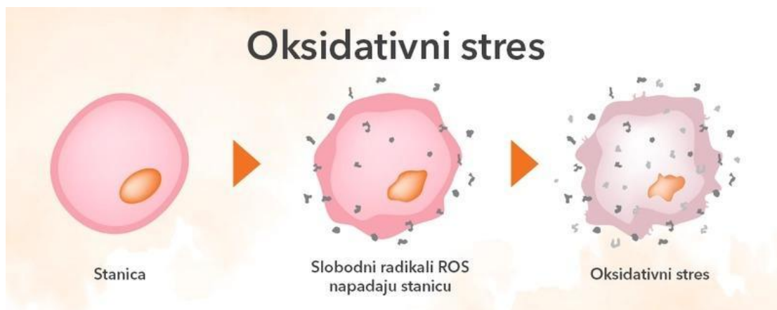
Slika 3. Oksidativni stres stanice

Akumulacija osmotskih regulirajućih tvari: Pod sušnim uvjetima, vinova loza može akumulirati osmotske regulirajuće tvari poput prolina, glicerola i šećera. Ove tvari pomažu u održavanju osmotskog tlaka unutar stanica i smanjuju rizik od dehidracije. Metaboličke prilagodbe vinove loze tijekom suše uključuju osmotsku regulaciju, gdje biljka akumulira osmolitike poput prolina i šećera kako bi održala turgor stanica. Ove tvari pomažu stanicama da zadrže vodu i zadrže svoj oblik unatoč sušnim uvjetima. Povećana sinteza antioksidansa još je jedan ključni mehanizam. Suša može uzrokovati oksidativni stres, a antioksidansi štite stanice od oštećenja. Promjene u fotosintezi također su uobičajene – zatvaranje puči smanjuje gubitak vode, ali i ograničava unos CO 2 , što može smanjiti fotosintetsku aktivnost i time utjecati na rast i razvoj biljke (Mikac, 2014).