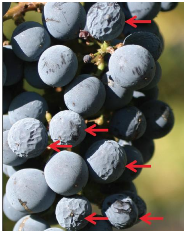
Slika 6. Početna faza sušenja bobice vinove loze