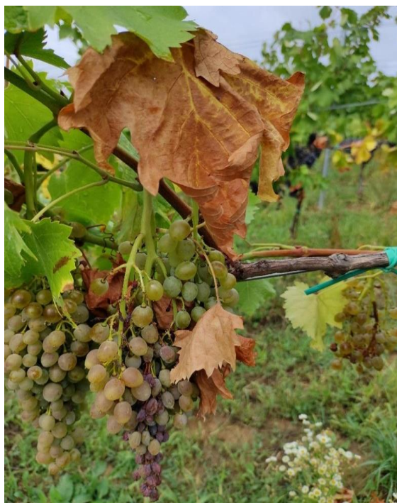
Slika 7. Posljedice suše na 'Pošipu'