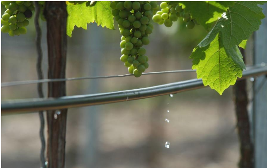
Slika 10. Navodnjavanje vinograda kap na kap sustavom

Teško je predvidjeti interakciju između vinogradarskih praksi i dozrijevanja grožđa s obzirom na specifičnosti okoliša. Postoji kompleksna veza između strategije navodnjavanja i drugih vinogradarskih praksi kao što su prorjeđivanje grozdova, manipulacije prinosem, primjene dušika i drugih abiotičkih faktora. Prema tome, da bismo fino podesili strategiju navodnjavanja potrebno je izravno mjeriti određene parametre vinove loze. U tom kontekstu, mjerenje promjena volumena bobice i akumulacije šećera pružiti će kritične informacije kako bolje procijeniti odgovor vinograda na deficit vode u kombinaciji s drugim faktorima. Promjene u sekundarnom metabolizmu biljke na stres od nedostatka vode su različite za različite kultivare pa prag i učestalost navodnjavanja trebaju biti definirane u skladu sa jedinstvenim zahtjevima svake sorte (Guilpart i sur., 2014).