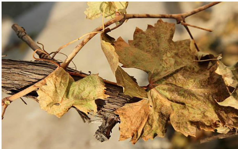
Slika 5. Sušenje vinove loze

Genetičke adaptacije uključuju selektivni uzgoj sorti vinove loze koje su otpornije na sušu. Kroz selekciju i križanje, vinogradari su uspjeli razviti sorte koje bolje podnose sušne uvjete. Također, aktivacija specifičnih gena u odgovoru na stres uzrokovan sušom omogućava biljci da se prilagodi i preživi nepovoljne uvjete (Tombesi i sur., 2018).