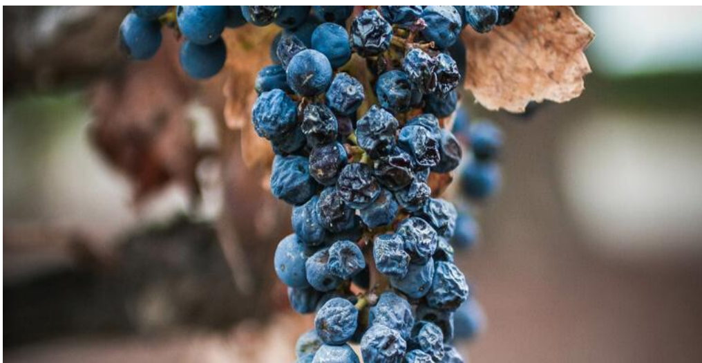
Slika 4. Simptomi suše na grozdu vinove loze

- Efekti na fizičku strukturu i rast: Suša može utjecati na fizičku strukturu biljke, uključujući smanjenje rasta zbog ograničenja unosa vode i hranjivih tvari.