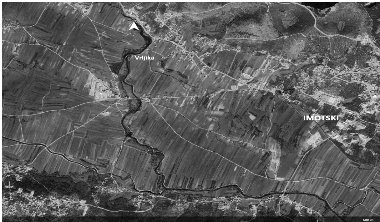
Slika 3. Područje istraživanja, gornji tok rijeke Vrljike (Izvor:

Uzorci su prikupljeni na transektu duljine 2100 m u gornjem toku s završnim koordinatama UTM (WGS84) 47°23'06"N, 17°10'05" E. Širina riječnog korita varirala je od 5 do 30 m, dok je dubina rijeke na mjestima uzorkovanja bila od 40 do 190 cm. U bržim i dubljim dijelovima vodotoka prevladavaju makrofiti dok se uz rubne dijelove korita i sporijim dijelovima vodotoka nalazi submerzna vegetacija. Područje istraživanja pripada području ekološke mreže NATURA 2000.