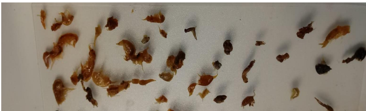
Slika 4. Organizmi uzorkovani iz probavila štuke

Probavilo iz analiziranih jedinki izolirano je na način da se napravio rez kod jednjaka i analnog otvora. Izolirane su sve jedinke i svaki je uzorak detaljno pregledan. Sadržaj probavila izvagan je kao mokra masa analitičkom vagom. Tako pripremljen uzorak premješten je u petrijeve zdjelice i pregledan kroz mikroskop s povećanjem 10-40x. Izdvojeni i prebrojani makroskopski beskralješnjaci i ribe razvrstani su prema zasebnim taksonomskim skupinama u odvojene epruvete s 80%-tnom otopinom alkohola koja je prije toga etiketirana s mjestom i datumom uzorkovanja i nazivom sistematske kategorije. Uz pomoć priručnika Kerovac (1986), Nilsson (1996 i 1997) i Engelhardt (2008) determinirani su makroskopski kralješnjaci do razine razreda i reda, dok se za determinaciju ribe do razine vrste koristio ključ Kottelat i Freyhof (2007). Obradeni podaci uzorkovanih jedinki su kasnije uneseni i obrađeni u računalnom programu MS Excel.