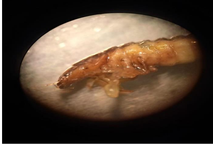
Slika 5. Organizam uzorkovan iz probavila kroz lupu