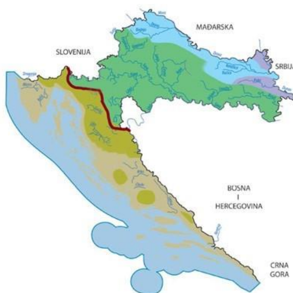
Slika 1. Granica između jadranskog i dunavskog sliva

Raznolikost hrvatske ihtiofaune, s obzirom na bogatstvo vrsta i endema, svrstava Hrvatsku u jednu od ihtiološki najraznolikijih zemalja Europe. Bogatstvo vrsta je posljedica zemljopisnog položaja koji obuhvaća dva riječna sustava, jadranski i dunavski sliv. Čak 38 vrsta je iz jadranskog sliva (Čaleta i sur., 2019).