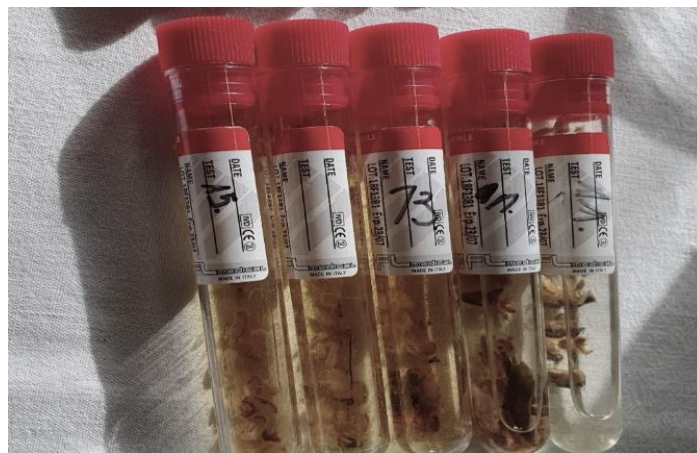
Slika 6. Razvrstani uzorci u epruvetama sa 80%-tnom otopinom alkohola

Pri analizi prehrane štuke određeni su sljedeći hranidbeni indeksi: