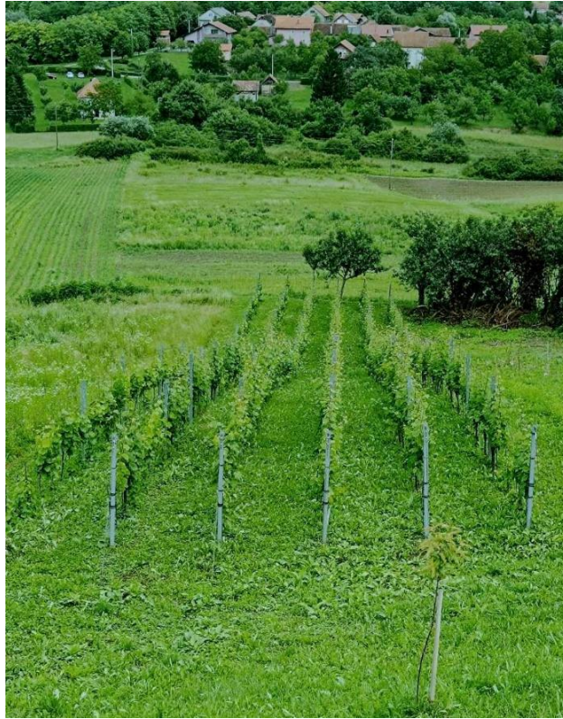
Slika 1: Pokusni nasad (osobna galerija)