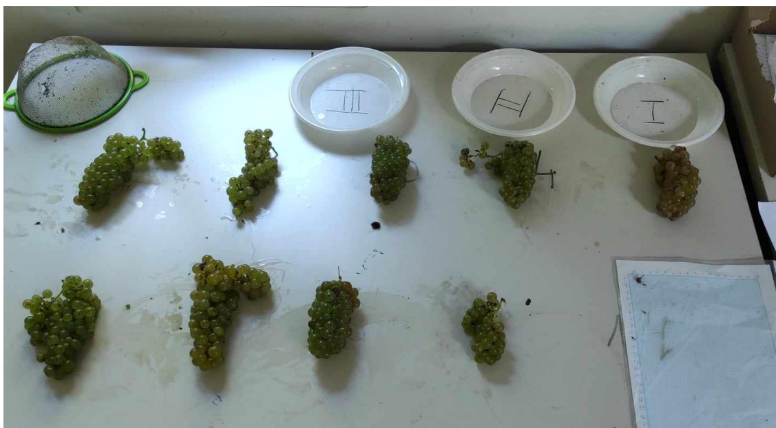
Slika 10: Ampelometrijska mjerenja sorte 'Rizling rajnski'

** Razlika je signifikantna za (Pr > F) < 0,05 uz 95% vjerojatnosti