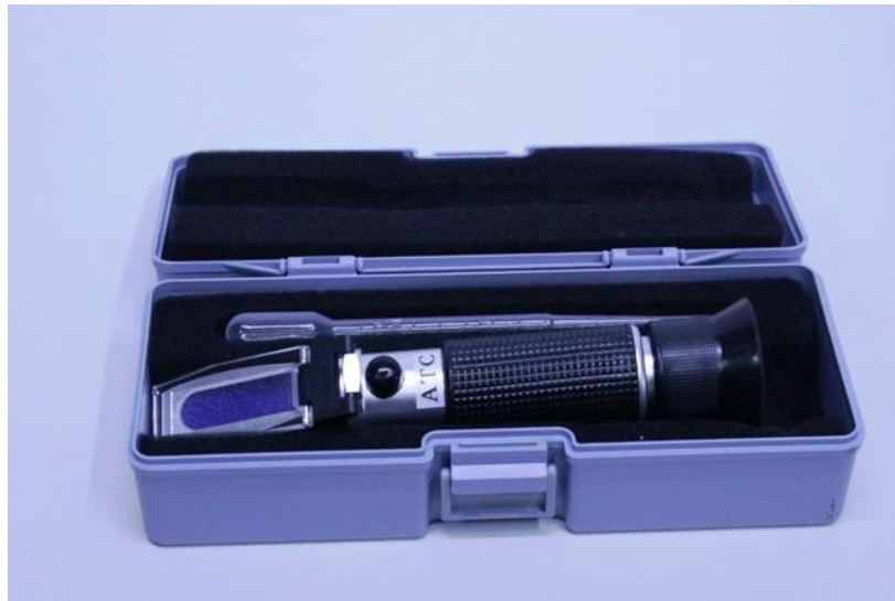
Slika 7: : Refraktometar