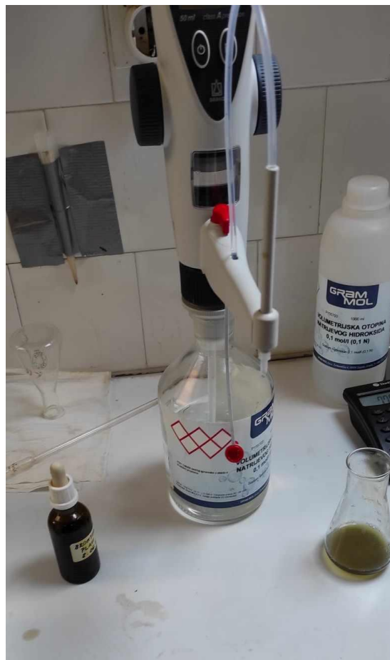
Slika 8: Određivanje ukupne kiseline