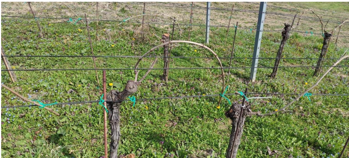
Slika 4: ' Guyot '

U svrhu istraživanja odabrana su dva ista uzgojna oblika kod obje sorte, „Guyot“ i „dvokrak“ kako bi vidjeli ima li razlike kod gospodarskih karakteristika s obzirom na gospodarsku važnost. „Guyot“ se sastoji od jednog lucnja (8 do 12) nodija i jednog prigojnog reznika. Prigojni reznik je smješten na nižoj razini od lucnja. „Dvokrak“ se sastoji od dva lucnja (8 do 12 nodija) i dva reznika. Lucnjevi i reznici se raspodjele tako da jedan reznik i jedan lucanj se nalazi na jednoj strani, a drugi lucanj i reznik na drugoj strani (Mirošević, 2008).