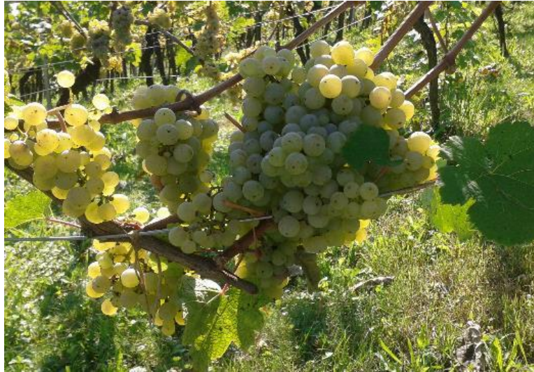
Slika 2: Grožđe sorte 'Rizlinga rajnskog' u punoj zrelosti