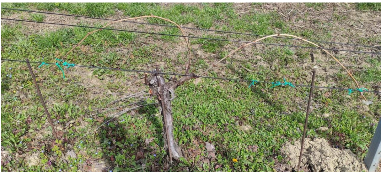
Slika 5: ' dvokrak ' (osobna galerija)