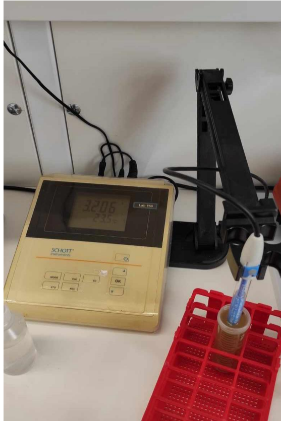
Slika 9: pH metar