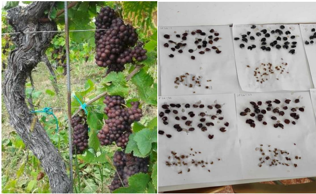
Slika 3: Grožđe sorte 'Pinot sivi' u punoj zrelosti