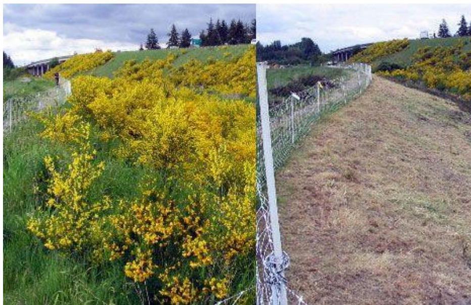
Slika 9. Kanal prije i poslije „mob grazing“ usluge (M.G. Richard, 2009)

Prilagodba koza na brstenje rezultira prehranom bogatijom proteinima, ali manje probavljivosti nego prehrana ovaca (Wilson i sur., 1975). Koze najradije jedu biljne vrste s većim udjelom lista, cvijeta i sjemena, odnosno bjelančevina i topivih ugljikohidrata, a manje stabljike. Sklonost koze prema brstu povezuje se i s većom tolerancijom na razinu tanina u biljkama (Mioč i Pavić, 2002). Maleček i Provenza (1981) su utvrdili da koze vrlo učinkovito iskorištavaju vegetaciju brdsko-planinskih područja na kojima dominiraju različite drvenaste vrste i grmlje, dok godišnji obrok koza čine 60% različite grmolike vrste, 30% trave i 10% zeljanice (Mioč i Pavić, 2002). Zbog takvih kvaliteta sve su popularnije u uslugama čišćenja određenih površina. U praksi se to izvodi tako da se ciljana područja čišćenja vegetacije nekoliko dana opterete velikim brojem koza, tzv. „mob grazing“ (slika 9).