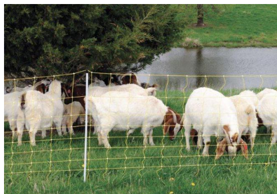
Slika 12. mrežasta električna ograda (valleyvet)