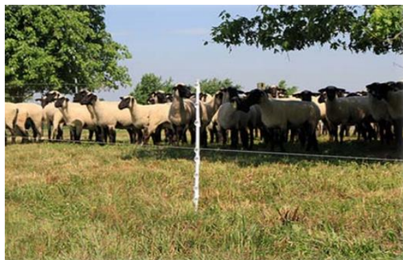
Slika 11. Jednožičana električna ograda

najoptimalnije su se prikazale mrežaste električne ograde. Vrlo su lagane, lako se prenose i postavljaju, te su ujedno i obrana od predatora. Hoće li električna ograda biti efikasna ovisi i o utreniranosti stada. Zato se svaku životinju u ovakvom proizvodnom obliku upoznaje sa ogradom pod naponom, na način da se životinja šokira, nakon čega obično poštuje ogradu. Ograde su najčešće naboja od 3000 V do 9000 V.