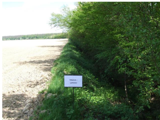
Slika 8. Neodržavan melioracijski kanal Lapovci (Petošić i sur., 2015)