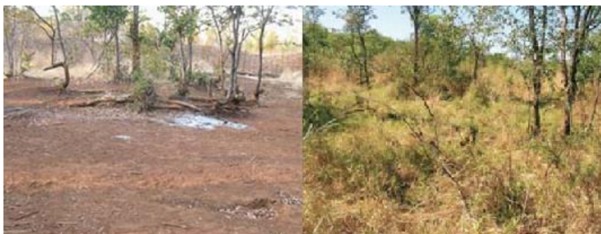
Slika 13. Zimbabve, prije planirane ispaše stoke lijevo i dvije godine nakon ispaše stoke desno (Mercola, J)

Za velik dio opustošenih područja diljem planeta krivi se ispaša stoke, no u zadnje vrijeme je prepoznata kao sredstvo obnove pustinja u pašnjake, pod nazivom „holistic planned grazing“ (slika 13). Osiromašena područja se opterećuju se stokom koja omekšava koru zemlje i širi sjeme biljaka. Stručnjaci smatraju da inteligentnim pristupom u ispaši osiromašenih područja možemo obnoviti ekosustav i svesti količinu ugljika u zraku na razini predindustrijskog doba (Savory, A., 2013).