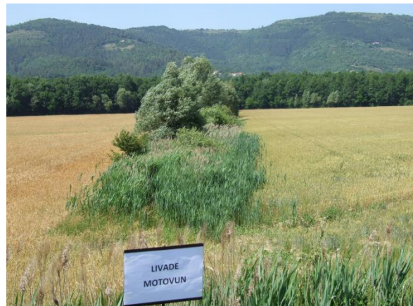
Slika 3. Zarasli melioracijski kanal, Motovun, Istarska županija (Petošić i sur., 2015)