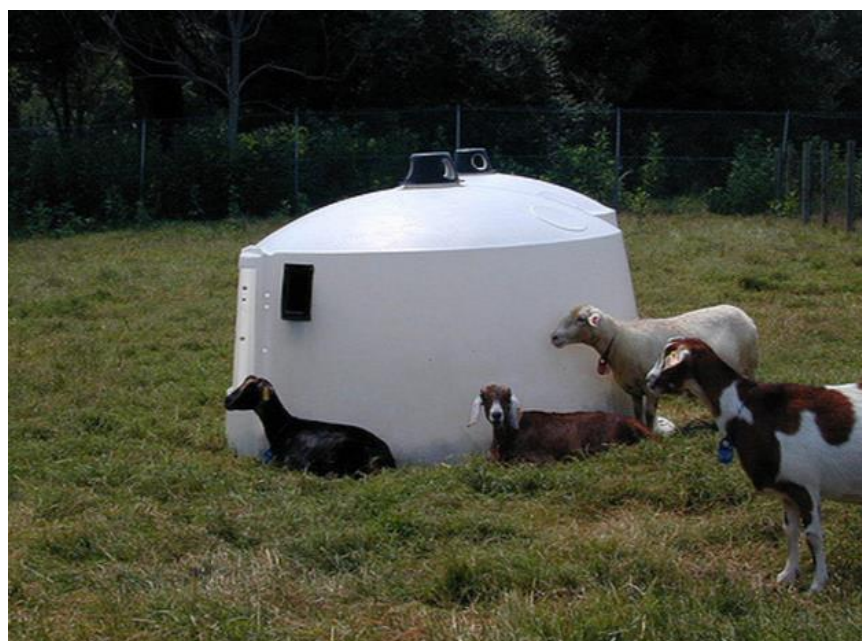
Slika 10. Često korišteno plastično prenosivo sklonište Polyodome

Kad je vruće, ovce se sklanjaju u sjenu i prestaju jesti (Johnson, 1987). Stoga je u takvim situacijama potrebno osigurati prirodno ili umjetno prenosivo sklonište (slika 10) da se životinje mogu skloniti od dugotrajne izloženosti sunčevim zrakama.