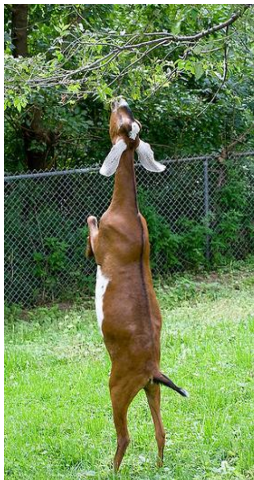
Slika 6. Koza može dosegnuti i 2 m visoke grane

Koze imaju veća jetra (usporedno sa veličinom tijela) nego ovce i krave, a time i veće detoksifikacijske sposobnosti. Istraživanja pokazuju da je detoksifikacija aktivnija i učinkovitija kod koza nego kod ovaca i krava (Ortega-Reyes i Provenza, 1993).