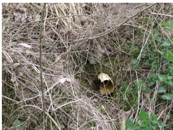
Slika 4. Oštećenje drenske cijevi prolaskom strojnih kosilica (Petošić i sur., 2015)

Često je strojevima onemogućen pristup kretanja kroz kanale jer u protivnom oštećuju drenažne cijevi (slika 3). Stoga se u praksi oko izljeva drenažnih cijevi ručna košnja pokosa kanala obavlja dva puta godišnje (Vidaček, 1998). Nažalost, u praksi se često paljenjem vegetacije kanala također oštećuje i drenske cijevi (slika 4).