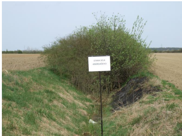
Slika 2. Zarasli melioracijski kanal, Stara Sela, Vukovarsko-srijemska županija (Petošić i sur., 2015)

Osnovni razlog slabljenja funkcije melioracijskih kanala je nekontrolirani rast vegetacije (slika 2 i 3) koji svojom biomasom pogoršavaju stanje kanala, često do razine apsolutne neiskoristivosti.