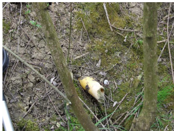
Slika 5. Oštećenje drenske cijevi spaljivanjem vegetacije (Petošić i sur., 2015)