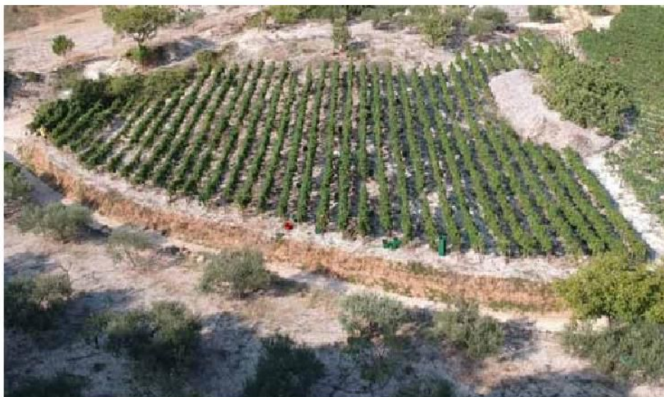
Slika 1. Vinograd u općini Postira/ Picture 1. Vineyard in Postira Municipality