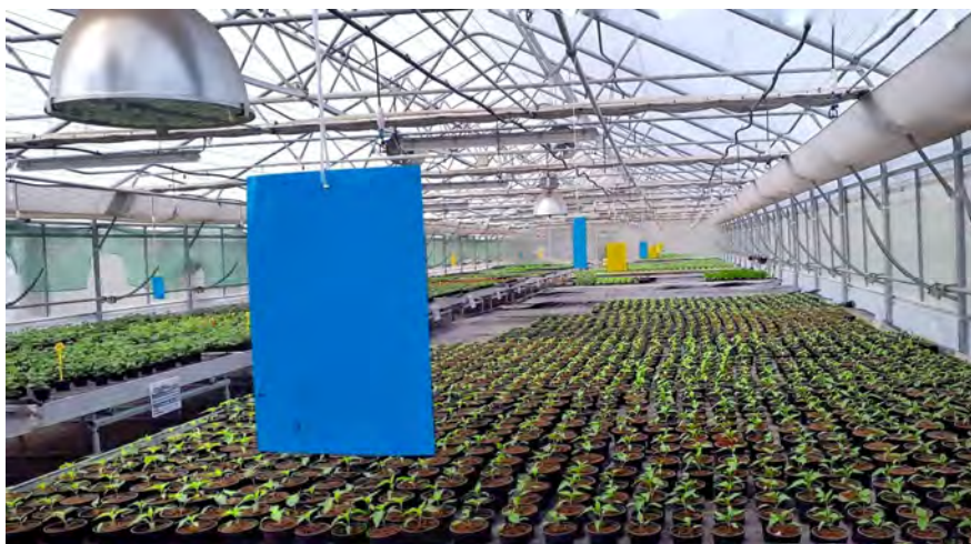
Slika 1. Prikaz plavih i žutih ljepljivih ploča u zaštićenom prostoru