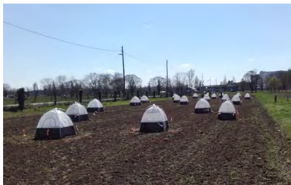
Slika 1. Postavljeni entomološki kavezi

uspješno prezimile, na svaku je parcelu postavljen entomološki kavez (slika 1) u koji su prikupljane krumpirove zlatice.