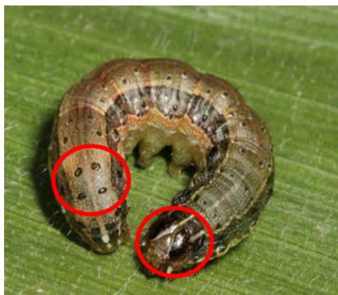
Slika 2. Gusjenica jesenske sovice

koja su obično tamne boje (Capinera, 2017.). Jesensku sovicu najlakše se može prepoznati u stadiju već odrasle gusjenice koja ima četiri crne točkice u obliku kvadrata na zadnjem segmentu tijela i oznaku u obliku slova Y na glavi (slika 2). Kukuljice su crvenkastosmeđe boje i najčešće se mogu naći u tlu. Odrasli leptiri najaktivniji su uvečer i noću kada mogu preletjeti udaljenosti do 100 km. Tijekom dana odrasli su skriveni između listova kukuruza ili u pazušcu lista. Raspon krila leptira iznosi od 32 do 40 mm, te je prisutan spolni dimorfizam (Visser, 2017.).