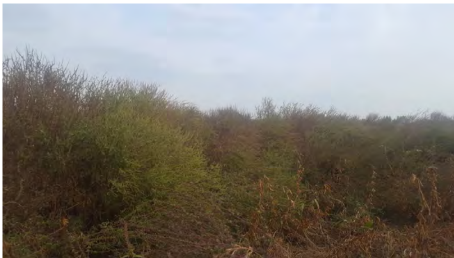
Slika 3. Usjev soje zakorovljen populacijom ambrozije rezistentne na herbicid okasuslfuoron na lokaciji Johovec

Za razliku od divljeg sirka kojemu je u Europi već dokazana rezistentnost na ALS herbicide, podataka o rezistentnim populacijama ambrozije u Europi nema. Stoga su ovi nalazi o rezistentnim populacijama ambrozije na ALS herbicide u Hrvatskoj i prvi službeni nalazi za tu vrstu u Europi (slika 2).