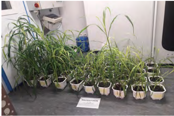
Slika 4. Rezistentna populacija divljeg sirka s lokaliteta Dubrovčak Lijevi tretirana linearno rastućim (od \frac{1}{2} do 64 x veća doza od registrirane) dozacijama herbicida foramsulfurona (gore), imazamoksa (sredina) i nikosulfurona (dolje)

Otkriće rezistentnih populacija u Republici Hrvatskoj velik je problem za cjelokupnu biljnu proizvodnju. Rezistentne populacije divljeg sirka potvrđene u usjevu kukuruza opasnost su i za ostale usjeve zakorovljene tom korovnom vrstom, a u kojima se koriste ALS herbicidi. Još su veći problem utvrđene rezistentne populacije ambrozije, i to iz nekoliko razloga. Prvo, ambrozija je najzastupljenija širokolisna korovna vrsta okopavinskih usjeva Hrvatske (Šarić i sur., 2011.). Drugo, za suzbijanje ambrozije u usjevu soje u post-emergence roku primjene nema alternativnih herbicida jer se suzbijanje donedavno obavljalo isključivo ALS herbicidima (okasulfuron, tifensulfuron i imazamoks). I treće, rezistentne populacije ambrozije svakako su potencijalni problem i u drugim okopavinskim usjevima gdje se redovito koriste ALS herbicidi (kukuruz, tolerantni suncokret, strne žitarice). Stoga je u daljnjim istraživanjima potrebno testirati te populacije na sve ALS herbicide koje se koristi u ratarskim i povrtnim kulturama.