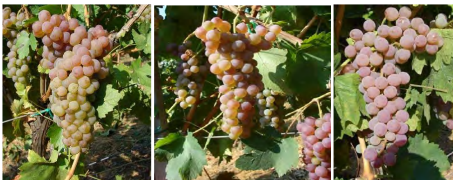
Slika 1. Klonovi sorte 'Kraljevina' VV-181, VV-360 i VV-427

Trenutačno su kao rezultat klonske selekcije na tržištu dostupni sljedeći klonovi sorata: graševine (četiri klon: OB-412, OB-414, OB-435 i OB-445), kraljevine (tri klon: VV-181, VV-360 i VV-427), škrleta (tri klon: ŠK-29, ŠK-33 i ŠK-74) i moslavca (pet klonova: PUŠ-017, PUŠ-026, PUŠ-030a, PUŠ-087 i PUŠ-111). Osim toga, u završnoj su fazi ispitivanja i klonovi sorata: plavac mali, pošip, plavina, maraština, vugava, debit, grk i žlahtina. Klonska selekcija započeta je kod još nekoliko autohtonih sorata. Certificirane plemke registriranih klonova proizvode se na Znanstveno-nastavnom pokušalištu Jazbina Agronomskog fakulteta, u suradnji s nekoliko proizvođača, a koriste se u proizvodnji sadnog materijala u domaćim, ali i stranim loznim rasadnicima. Navedene količine dostupnog materijala registriranih klonova trenutačno nisu dostatne za potrebe domaćih vinogradara. Međutim, u provedbenoj je fazi projekt „Novi početak za stare hrvatske sorte vinove loze” koji će omogućiti dugoročnu održivost rezultata klonske selekcije kroz dostupnost trenutačno registriranih, ali i novoregistriranih klonova najvažnijih autohtonih sorata.