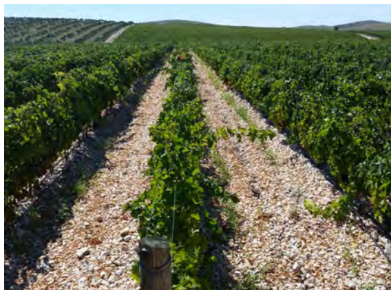
Slika 2. Vinogradi na melioriranu kršu

Osim toga, nove tehnologije koje se sve više koriste u poljoprivredi, pa tako i u vinogradarstvu, povezane su s daljinskim praćenjem ( Remote Sensing ) i detekcijom stanja i promjena u nasadima u realnom vremenu na velikim površinama. Takvi sustavi imaju široku paletu primjena, ovisno o njihovoj razlučivosti, te postaju sve prikladniji i za manje proizvođače. Detekcija zona različite bujnosti u nasadu direktno se povezuje s različitim potrebama za hranjivima ili navodnjavanjem, a može se koristiti i za odvojenu berbu pojedinih zona s obzirom na bujnost i kvalitetu, tj. zrelost grožđa. Strategije primjene zaštitnih sredstava, osim na prognosnim modelima temeljenima na praćenju okolišnih uvjeta, u stvarnom vremenu mogu se bazirati i na daljinskom praćenju i utvrđivanju pojava simptomatičnih biljaka u pojedinim zonama vinograda. Sve se to temelji na dostupnim tehnologijama i postupno se sve više primjenjuje u vinogradarskoj proizvodnji. Veće i značajnije korištenje ovih tehnologija zbog njihove će cijene ipak kod malih i srednjih proizvođača biti moguće isključivo udruživanjem proizvođača.