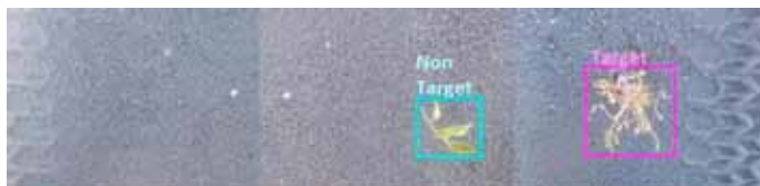
Slika 11. Pametno otkrivanje korova za apliciranje i biljke (Partel i sur., 2019)