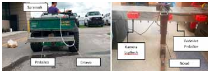
Slika 10. Pametna prskalica montirana na terensko vozilo (Partel i sur., 2019)

Jedan od suvremenih primjera zaštite bilja od korova je upotreba Smart Sprayer-a odnosno sustava koji se zasniva na strojnom učenju (machine learning). Smart Sprayer sadrži mlaznice, crpku, RTK GPS (točnost oko 2 cm), tri video kamere (Webcam Logitech c920), pametni kontroler (Arduino mega) za upravljanje svim sensorima i aktuatorima (npr. crpka), računsku jedinicu (NVIDIA Jetson TX2 GPU) za obradu slike i detekciju korova (Slika 10.). Kako bi se postigla precizna aplikacija i kreirala aplikacijska karta (karta korova) razvijen je program korištenjem C programskog jezika. Softver radi u stvarnom vremenu i može obraditi do 28 sličica u sekundi u svim koracima zajedno: akvizicija slike, detekcija objekata i komunikacija. Za preciznu mrežnu detekciju upotrebljava se YOLOv3 (Slika 11.)