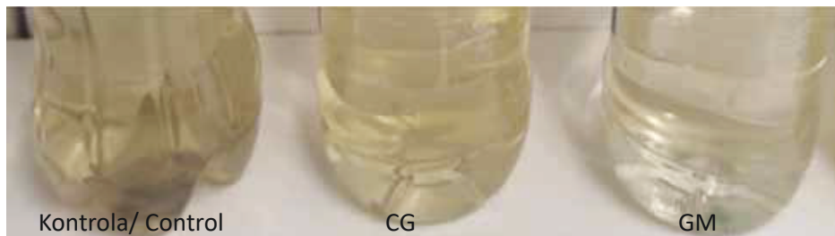
Slika 1. Razlika u nijansi i intenzitetu boje vina 'Pošip' Picture 1. Differences in the tone and intensity of of the wine Pošip color

Iz rezultata prikazanih u Tablici 2. vidljiva je značajna razlika između koncentracije otopljenog kisika u kontrolnom tretmanu i tretmanu GG u odnosu na tretman GM. Niže koncentracije kisika prisutne u kontrolnom uzorku dokazuju antioksidativnu aktivnost sumporovog dioksida. Osim toga, prema rezultatima, tretman primjene glutaciona na grožđe također ima zadovoljavajuću ulogu u očuvanju oksidativne stabilnosti. S obzirom na rezultate mjerenja parametara boje vina prikazane u Tablici 3., možemo zaključiti kako je glutacion dodan u mošt (GM) imao značajniju ulogu u očuvanju nijanse i intenziteta boje vina. Dokaz tome je upravo povećana količina otopljenog kisika te vidljivo manji intenzitet boje vina nego u druga dva slučaja. Na Slici 1. prikazana je jasna razlika u boji vina gdje je prvi i najintenzivniji uzorak kontrolni, u sredini uzorak GG te treći uzorak tretman GM, vidljivo najsvjetlije nijanse i najmanje intenzivne boje.