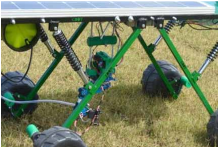
Slika 8. Robot za suzbijanje korova vodenom parom i laserskim uređajem Mapplics GBOT

statak veliki utrošak energije koja je potrebna za zagrijavanje vode (Slaughter i sur., 2008). Glavne komponente ovog sustava su spremnik za vodu, crpka za vodu, parni kotao, generator pare i mlaznice za usmjeravanje pare. Sustav djeluje tako da nakon što sustav strojnog vida prepozna korov, pokretna ruka postavlja mlaznicu iznad korovske biljke i ispušta određenu količinu vodene pare na biljku. Giles i sur. (2005) modificirali su sustav preciznog apliciranja koji su razvili Lee i sur. (1999) za primjenu tekućina zagrijanih do 200 °C. Sustav je dizajniran za robotsku kontrolu korova korištenjem precizne primjene grijanih organska ulja za uništavanje korova s uljima na različitim temperaturama. Korištenjem ulja temperature 177 °C gotovo svi korovi bili su uništeni, dok se učinkovitost smanjila sa smanjenjem temperature i utvrđeno je da je minimalna temperatura pri kojoj je učinkovitost sustava bila pouzdana 150 °C. Uspjeh primjene vodene pare za uništavanje korova ovisi o građi korova i visini stabljike. Vruća para izvrsno je sredstvo za uništavanje širokolisnih korova različitih veličina, dok je nešto slabije djelovanje na travne korove i višegodišnje korove (Leskošek i sur., 2003). Za poboljšanje učinkovitosti, sustav za suzbijanje korova vodenom parom se može kombinirati s nekim drugim sustavom, pa je tako argentinska tvrtka Mapplics razvila robota GBOT koji je uz sustav za suzbijanje korova vodenom parom opremljen i laserskim uređajem za suzbijanje korova (Slika 8).