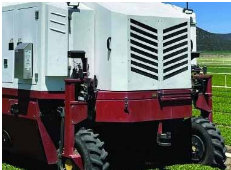
Slika 10. Robot za suzbijanje korova pomoću lasera tvrtke Carbon Robotics

( Amaranthus retroflexus L.) u fazi rasta prvog lista. Primijenjena su tri različita položaja lasera i tri veličini laserske točke 3.0, 4.2 i 6.0 mm. Istraživanja su pokazala da se minimalna energija potrebna za uništavanje korova kretala od 10 do 71 J po korovu, a utvrdili su važnost preciznog pozicioniranja lasera, budući da je model oštećenja pokazao potrebno povećanje energije od 1.3 J za svakih 1% gubitka u točnosti pozicioniranja. Američka robotička tvrtka Carbon Robotics razvila je svoju treću generaciju autonomnog robota koji koristi robotiku, umjetnu inteligenciju i lasersku tehnologiju velike snage za precizno kretanje kroz usjeve te za prepoznavanje i uklanjanje korova (Slika 10). Kamere visoke razlučivosti prenose slike u stvarnom vremenu na ugrađeno superračunalo koje pokreće modele strojnog vida za prepoznavanje usjeva i korova. Lasersko uklanjanje korova može se provoditi danju i noću u svim vremenskim uvjetima.