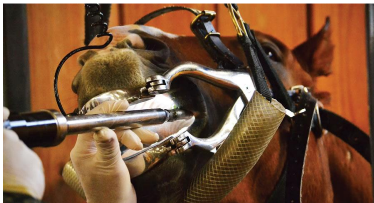
Slika 5.12. Korekcija zuba kod konja

Učestalost pojavnosti kolika možemo spriječiti pravilnim držanjem i hranidbom konja. Važno je konjima omogućiti redovito kretanje, socijalizaciju s drugim konjima, omogućiti ispašu, redovite godišnje preglede i prema potrebi korekcije zubala (slika 5.12.), redovitu primjenu antiparazitika uz održavanje pašnjaka, omogućiti stalan pristup čistoj, svježoj vodi. Također potrebno je konjima postaviti i solni kamen u blizini vode, jer na taj način potičemo konja da pije veće količine vode.