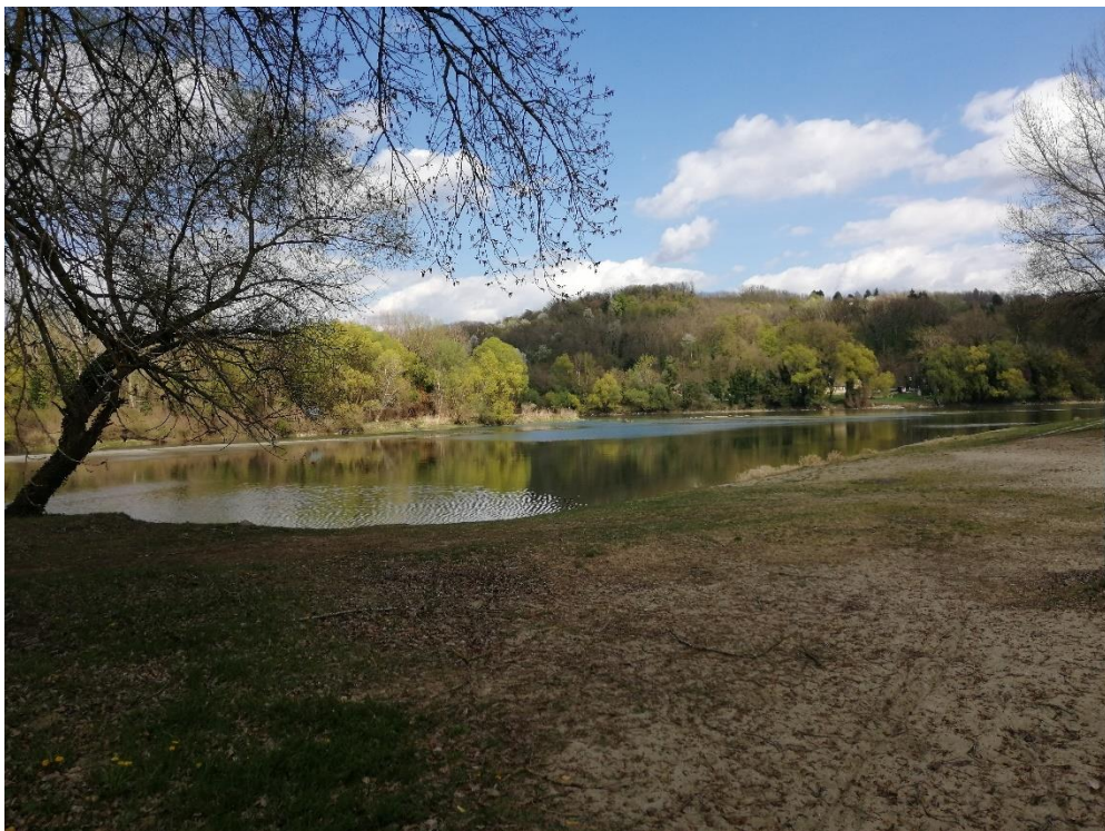
Slika 2. Halasz Csarda

Halasz Csarda je izletište i ribolovno područje koje privlači veći broj ljudi tijekom toplijih mjeseci (Slika 2). Na području su odabrana dva lokaliteta za uzorkovanje, međusobno udaljena otprilike 100 metara. Oba lokaliteta su pogodna za uzorkovanje, supstrat se sastoji od mulja i šljunka. Temperatura zraka prilikom uzorkovanja iznosila je oko 28°C sva tri mjeseca, dok je razina vode bila niska. Tok je izrazito spor, i na površini vode su na mnogim mjestima vidljivi znakovi onečišćenja. Uzorci su uzeti u rasponu od 10.00 - 16.00 h, a plima je rasla kako je vrijeme odmicalo.