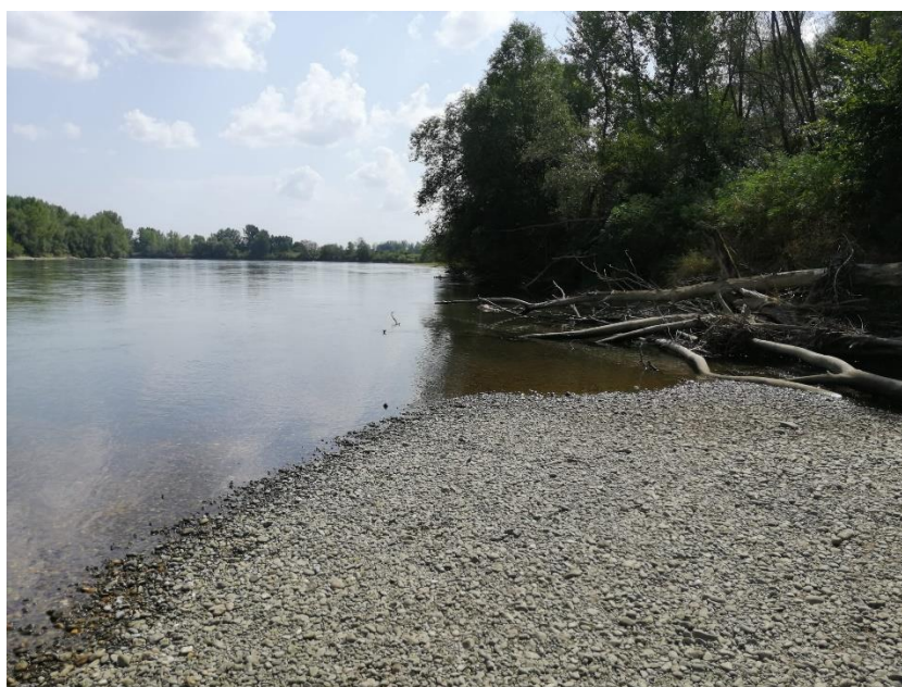
Slika 4. Lokacija Drava, lokalitet 2