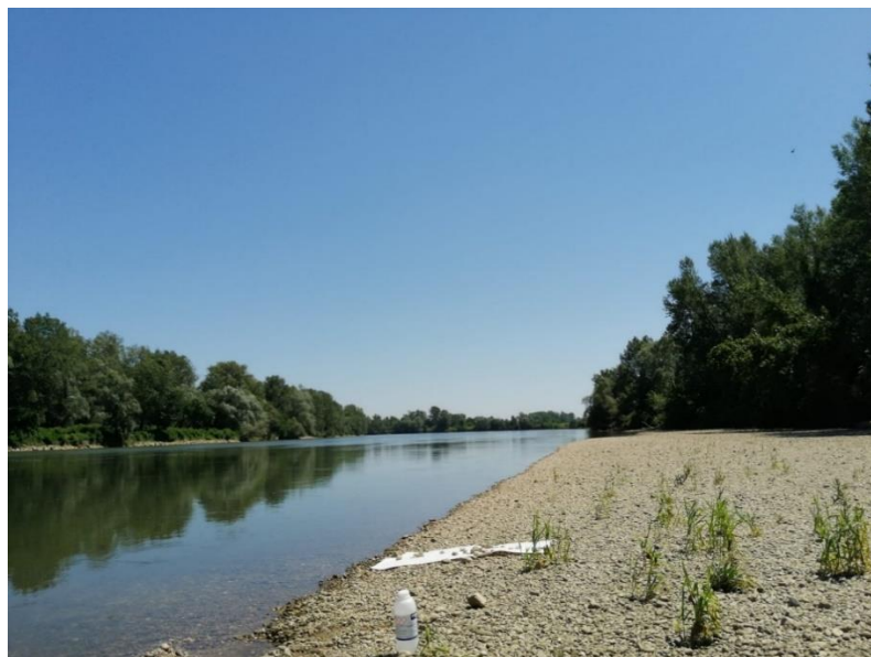
Slika 3. Lokacija Drava, lokalitet 1

Druga dva lokaliteta nalaze se na rijeci Dravi, na području gdje nanos šljunka uz njen tok omogućuje lak pristup rijeci, pa tako i uzorkovanje supstrata. Dva lokaliteta također su udaljena oko 100 metara, a supstrat je pretežito šljunkovit (Slike 3 i 4). Tok vode je varirao od umjerenog do brzog, a razina vode je bila niska ranije u danu, nakon čega je stupila plima. Uzorkovalo se u rasponu od 10.00 -16.00 h. Temperatura je iznosila ~28°C tijekom, sva tri dana uzorkovanja, a vidljivog zagađenja nije bilo.