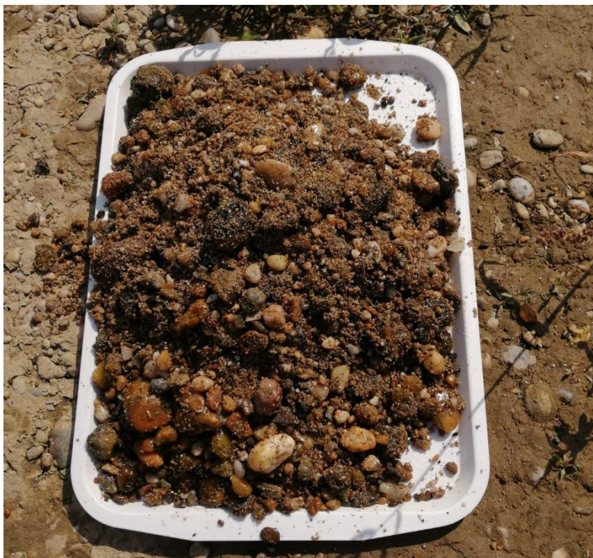
Slika 6. Supstrat s rijeke Drave na podlozi