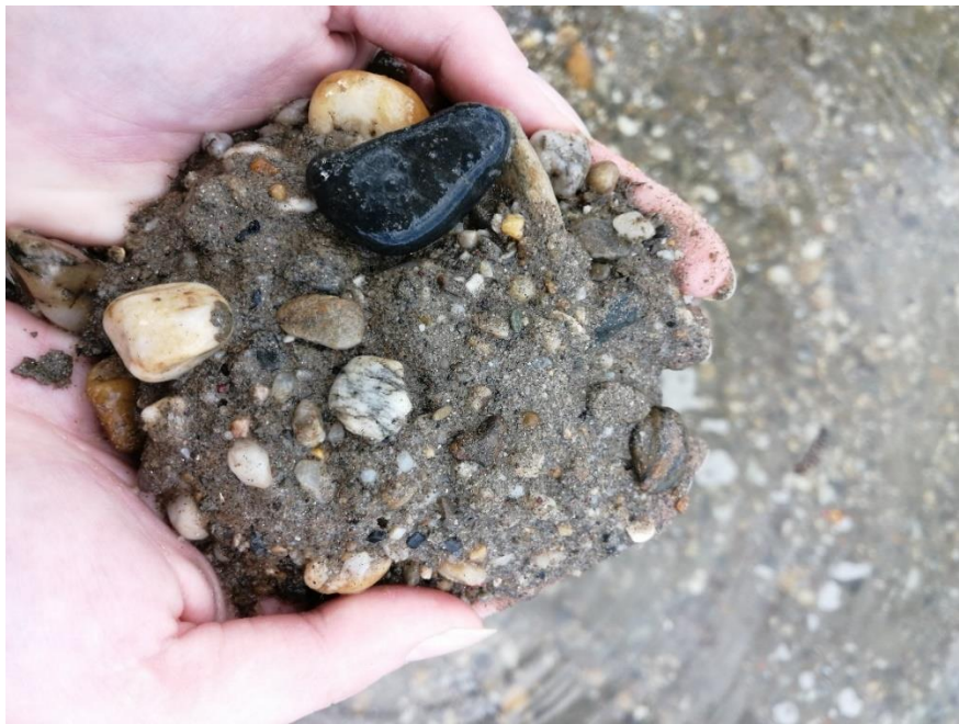
Slika 5. Primjer supstrata na Halasz Csardi

Istraživanje je provedeno u dva dijela: a) uzorkovanje makrozoobentosa na terenu tijekom svibnja, lipnja i srpnja 2022. godine (Slike 5 i 6) i b) determinacija prikupljenih organizama u laboratoriju. Makrozoobentos uzorkovan je ručnom bentos mrežom veličine oka 0,5 mm – povlačeći okvir mreže po dnu, u smjeru suprotnom od toka vode, u mrežu se sakupila veća količina supstrata i odložila na podlogu, nakon čega su se organizmi pincetom izdvojili od ostatka supstrata. Nakon što je prikupljena dovoljna količina uzorka, organizmi su prebačeni u posudice ispunjene 96%-tnim etanolom kako bi se sačuvali za daljnju analizu. Svaka posudica imala je napisanu šifru i datum uzorkovanja. Na obje lokacije su izdvojena dva lokaliteta, te se za svaki lokalitet, svakog mjeseca uzimala jedna skupina/bočica uzoraka (ukupno 12 posudica sa uzorcima). Nakon završetka terenskog dijela, organizmi su u laboratoriju uklonjeni iz etanola te su uz pomoć lupe i ključa za determinaciju makrozoobentosa determinirani do najniže moguće taksonomske kategorije.