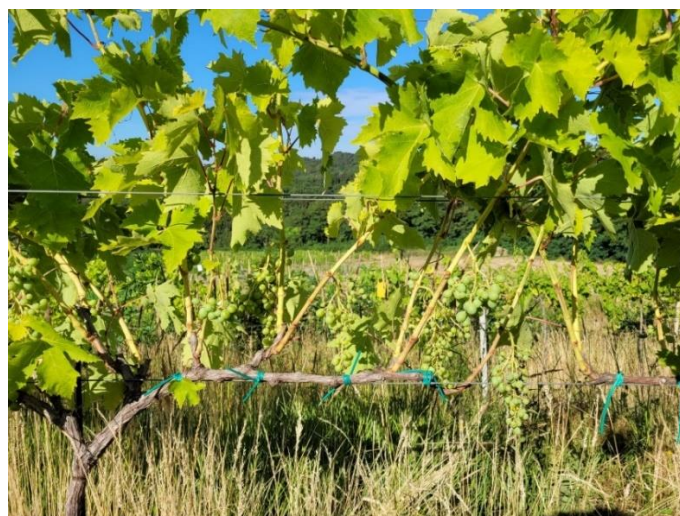
Slika 4. Prikaz defoliranih trsova