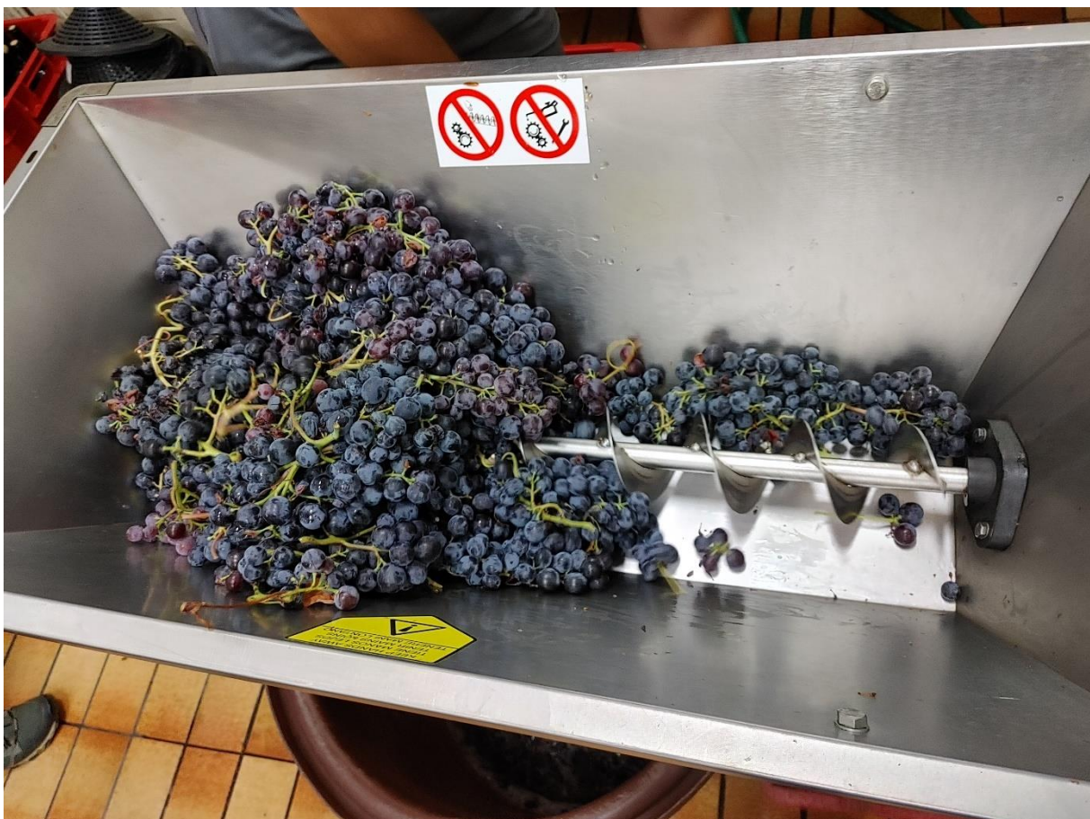
Slika 5. Prikaz runjanja i muljanja grožđa sorte 'Muškati Hamburg'

Vinifikacija je obavljena po standardnom postupku za dobivanje crnih vina. Grožđe je muljano te stavljeno na fermentaciju u inoks-tankove zapremnine 120L opremljenih sustavom za kontrolu temperature gdje je provedena kontrolirana fermentacija. U most je dodan selekcionirani soj kvasca S.cerevisae Uvaferm 228, na temperaturi od 18^{\circ}\text{C} . Nakon 5 dana provedeno je prešanje te je vino nastavilo sa tihom fermentacijom. Nakon završetka fermentacije, vino je sumporeno i pretočeno s taloga. Uzorci su se uzimali u staklene boce te su se analizirali na Zavodu za vinogradarstvo i vinarstvo Agronomskog fakulteta Sveučilišta u Zagrebu.