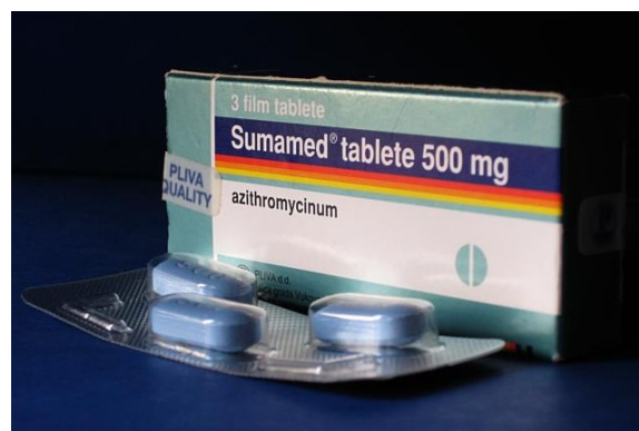
Slika 3.6. Sumamed – najpoznatiji Plivin antibiotik

Do prije dvadesetak godina Pliva je bila kompanija koja je oko 75 posto prihoda od proizvodnje lijekova ostvarivala na domaćem tržištu. Pliva je iz lokalne prerasla u snažnu regionalnu kompaniju i postala jedan od najpoznatijih brendova u regiji Srednje i Istočne Europe. Devedesetih je u tijeku jedan od većih investicijskih ciklusa: tih su godina otvoreni novi pogoni za proizvodnju azitromicina u Savskom Marofu i suhih oralnih oblika lijekova u Zagrebu te Novi istraživački institut, a dominantna odrednica Plivinog poslovanja je njegova internacionalizacija. 2006. godine, Pliva ulazi u sastav američkog Barra, a do nove promjene vlasnika dolazi 2008. godine kada Pliva postaje dijelom izraelske Teve. Pliva, danas članica Teva grupe, najveća je farmaceutska kompanija u Hrvatskoj i vodeća u regiji Južna i Istočna Europa kako se navodi na službenim internetskim stranicama Plive ( https://www.pliva.hr/about-pliva/our-history/ ).